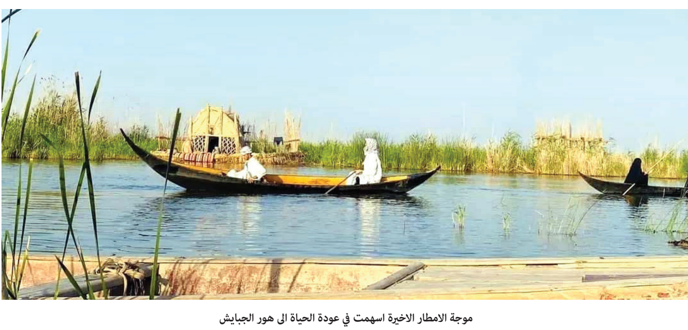
موجة الامطار الاخيرة اسهمت في عودة الحياة الى هور الجبايش

وقال السوداني في المؤتمر الصحفي المشترك مع أردوغان في