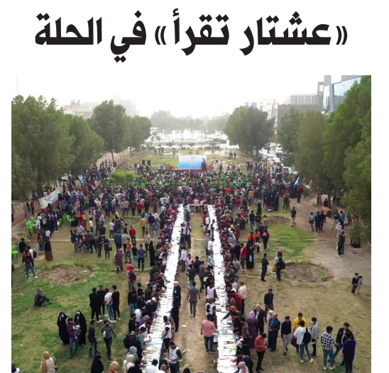
الحلة - مأدعة جميلة