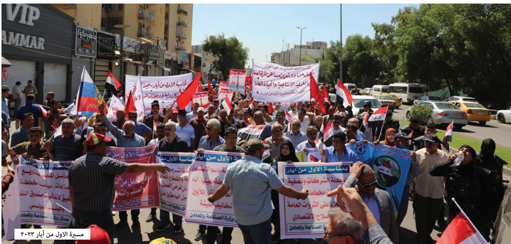
أيار.. حافز للعطاء والعمل من أجل غد أفضل

الوعي الطبقي بين العمال وتحشيع الشباب على الانخراط في هذا الكفاح وتقوية الاتحادات.