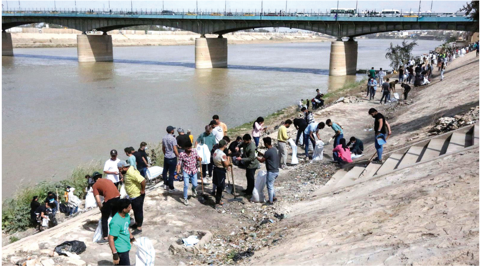
حملة شبابية لتنظيف نهر دجلة من النفايات ومخلفات البلاستيك

شكراً لك يا معلمي، بورتك، وبورك عيدك الأمي المجيد.