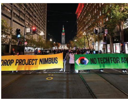
احتجاج امام مقر غوغل