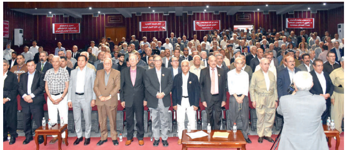
جلسة افتتاح المؤتمر