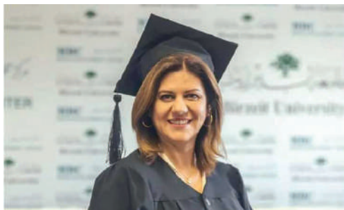
شيرين أبو عاقلة

كشفت جامعة إكستر البريطانية عن فتح باب التقديم لمنحة الصحافية الفلسطينية الشهيدة «شيرين أبو عاقلة»، حول ماجستير الدراسات الفلسطينية في معهد الدراسات العربية والإسلامية في الجامعة للعام الأكاديمي 2024/25. وأشارت الجامعة إلى أنه ستكون هناك فرصة واحدة للتقديم هذا العام، وسيكون الموعد النهائي للتقديم في 30 الشهر المقبل. وأوضحت الجامعة أنه يفضل التقديم للمنحة في أقرب وقت ممكن بعد استلام عرض البرنامج الدراسي لضمان النظر في الطلب لهذه المنحة. وتهدف هذه المنحة إلى دعم الطلاب الفلسطينيين الذين يحملون جواز سفر السلطة الفلسطينية، أو ينتمون إلى أصول فلسطينية. بالإضافة إلى ذلك، يتم النظر تلقائياً في مقدمي الطلبات لهذه المنحة لمنحة التفوق الدراسي للماجستير في معهد الدراسات العربية والإسلامية، بما في ذلك إعفاء الرسوم الدراسية بالكامل، بالإضافة إلى مبلغ معيشة، الذي يُمنح للطلاب كمساعدة مالية لتغطية تكاليف المعيشة خلال فترة الدراسة. وأوضحت الجامعة أنه باستثناء أي مكافأة فورية، لن يحصل المتقدم على أكثر من منحة واحدة من جامعة إكستر، وسيمنح المنحة ذات القيمة الأعلى إذا كان مؤهلاً للحصول على عدة منح. للتقديم، يجب عليك ملء وتقديم نموذج الطلب عبر الإنترنت ورفع بعض الوثائق. وستُفحص الطلبات أولاً للتأكد من استيفاء معايير الأهلية، ثم سيتم النظر فيها من قبل لجنة معينة داخل الكلية. وسيبلغ المتقدمون بنتيجة طلباتهم عن طريق البريد الإلكتروني بحلول 21 أيار المقبل. وتعتبر هذه المنحة تكريماً لذكرى شيرين أبو عاقلة، الصحافية الفلسطينية البارزة التي استشهدت خلال تغطيتها لاحتجاج إسرائيلي في جنين في 11 أيار 2022.