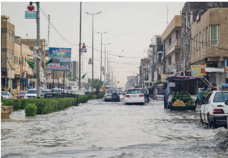
هكذا بدت شوارع السماوة أول أمس الثلاثاء بعد موجة مطرية قصيرة!