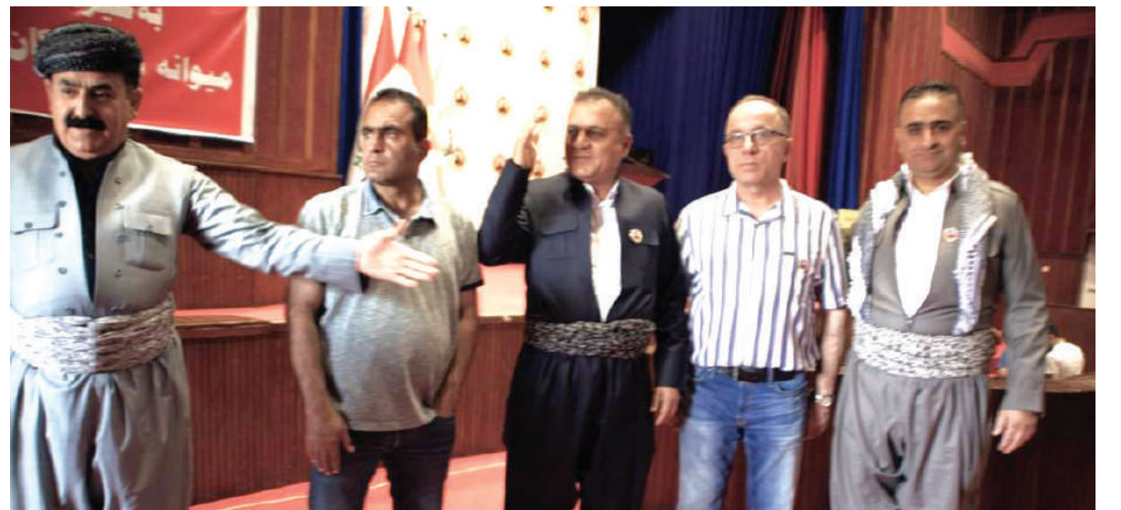
من اجواء مؤتمر الأنصار الشيوعيين