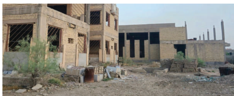
هيكل المبنى تحوّل إلى مكب نفائيات ومأوى للحيوانات السائبة

المشروع الذي يقع في "حي الحسين" في مركز القضاء، بحدود 5 مليارات دينار، وان الشركة المنفذة، وتدعى "شركة الوصايا"، تكدت في هذا التنفيذ، لذلك شرعت وزارة الشباب والرياضة عام 2019 بإنهاء العقد معها.