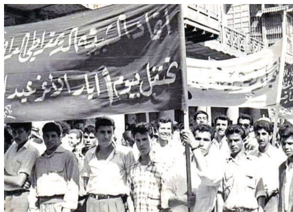
من مسيرة الاول من ايار ١٩٥٩ في شارع الرشيد ببغداد

نيسان ١٩٥١: أضرّب (٤٠٠) عامل نسيج في المعامل اليدوية في النجف. كما تم في ١٤ تشرين الثاني من نفس العام إعلان الإضراب العام تأييداً للشعب المصري في نضاله الوطني. وأضرّب جميع عمال