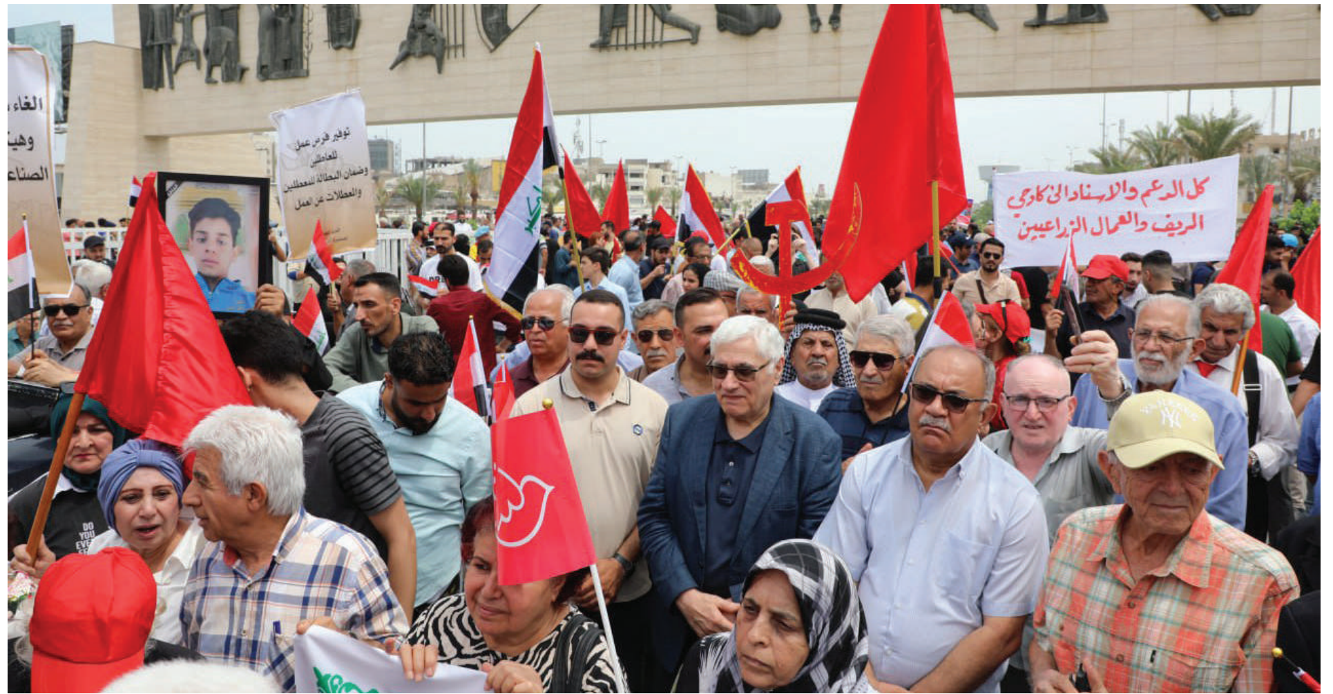
التجمع احتفاءً بالاول من ايار 2024 في ساحة التحرير ببغداد