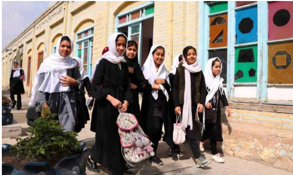
حظر الغناء على الفتيات في العاصمة الأفغانية

من النساء لديهن مخاوف بشأن حقوقهن رغم الرغبة في إنهاء العنف.