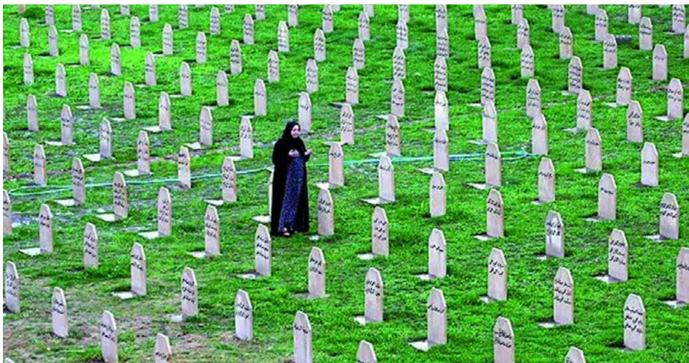
مقبرة الشهداء في حلبجة

للعلاج. إلا إنهم يواجهون الان مصاعب كثيرة بسبب عدم وضع برامج صحية لهم من قبل حكومة كردستان والحكومة العراقية».