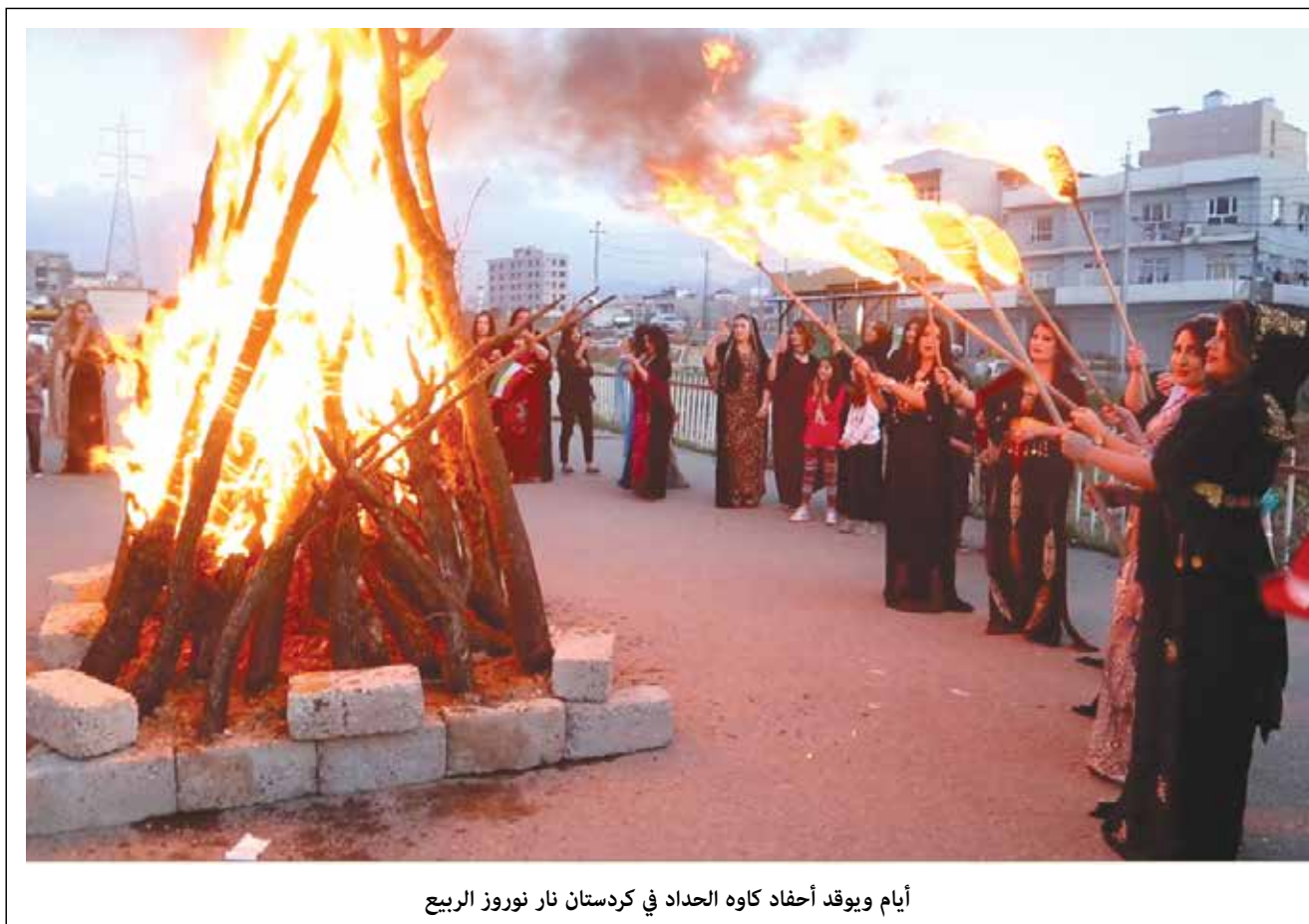
أيام ويوقد أحفاد كاوه الحداد في كردستان نار نوروز الربيع