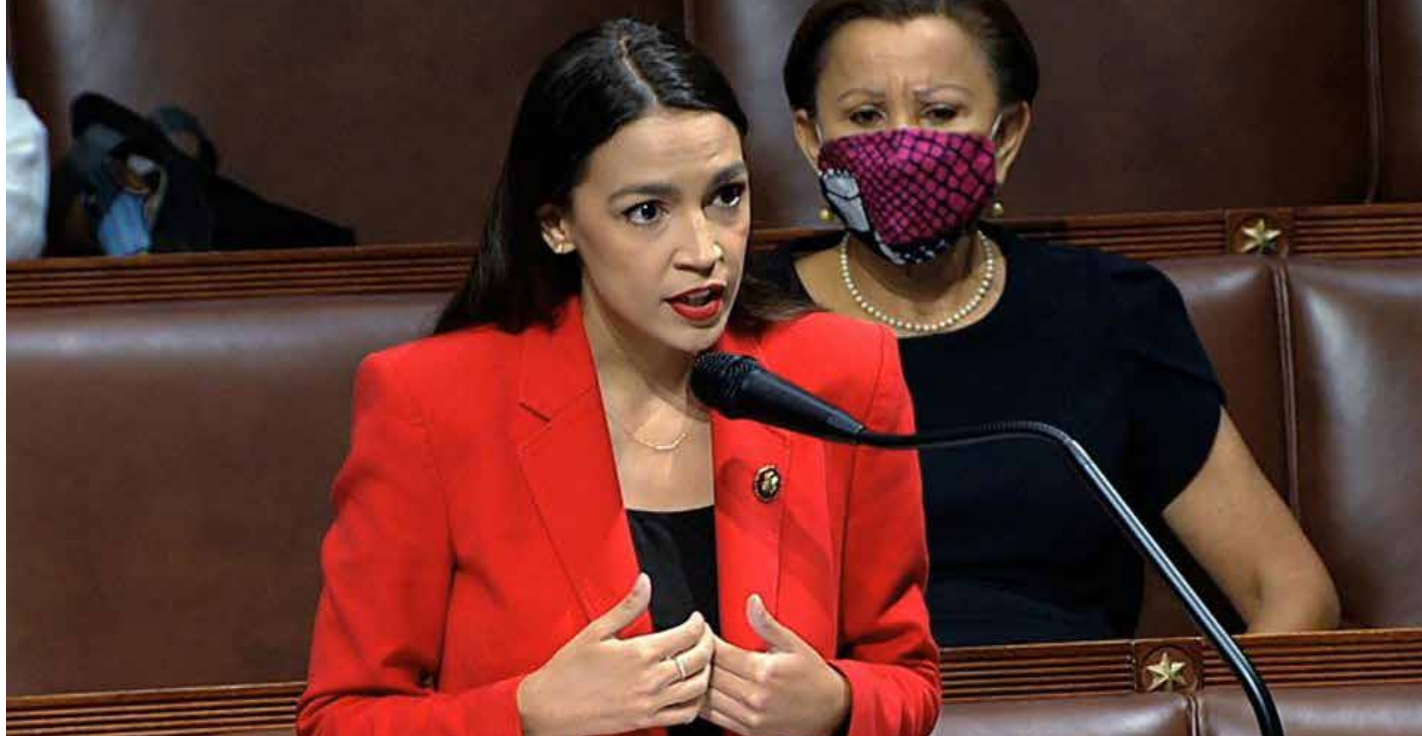
ألكسندرا أوكاسيو-كورتيز : هناك الكثير الذي يجب تحقيقه

عضوة الكونغرس اليسارية عن نيويورك، وأحد أهم الشخصيات في تنظيم الاشتراكيين الديمقراطيين الأمريكيين ألكسندرا أوكاسيو-كورتيز، وعبر تغريدة مصورة في تويتر أوضحت بالضبط ما تعنيه القرارات للجمع: "عليكم أن تقوموا بالتعبئة، والآن حان وقت التنظيم وممارسة الضغط السياسي. لا يزال هناك الكثير الذي نريد تحقيقه، وعلينا بناء القوة المطلوبة للقيام بذلك، وعلينا إدراك معنى ما حققناه وتقديره ثم نتنقل إلى الأمام. لأنه لا يزال هناك الكثير الذي يتعين القيام به، ولكن ما تحقق مهم، ومهم جداً!"