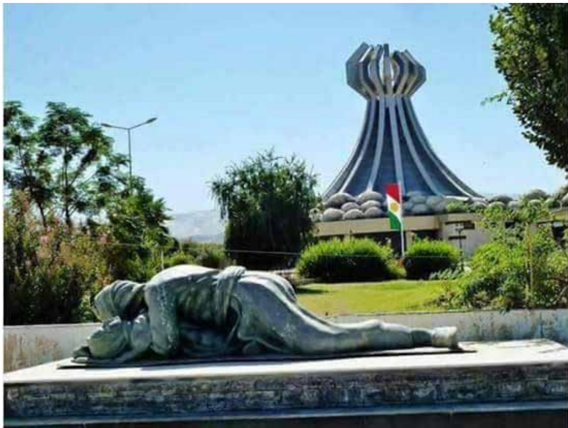
النصب التذكري لضحايا الجريمة المروعة في المدينة البتلة