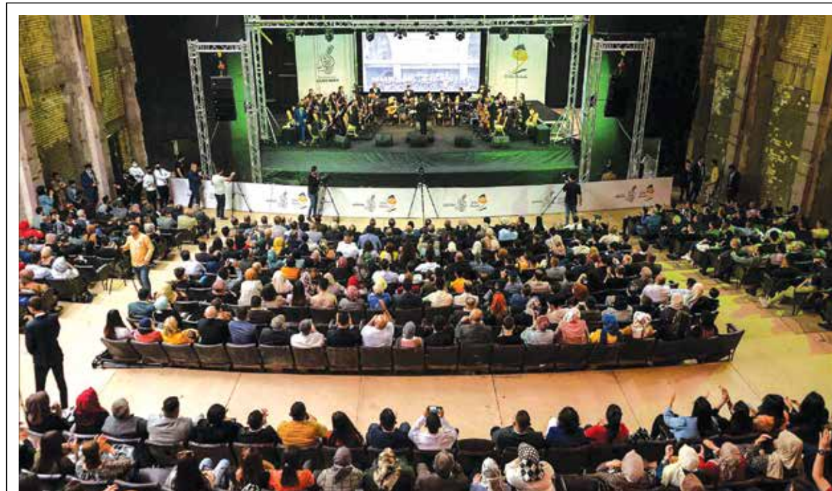
حفل موسيقي لأوركسترا "وتر" يصدح بألحان الحياة من قلب مسرح الربيع في الموصل