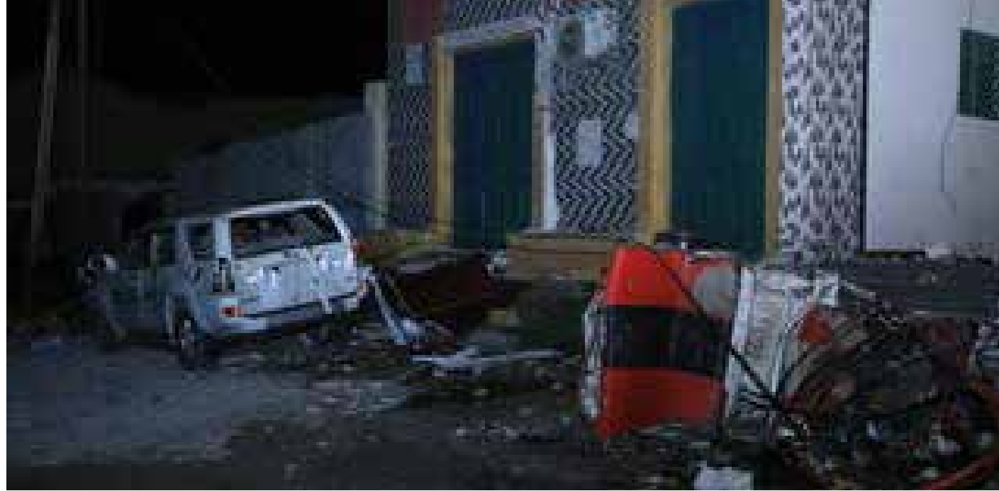
الإعلام الناقل لرسائل الإرهابيين

وفق جريدة الغارديان، استطاعت المخابرات البريطانية إفشال 3 هجمات إرهابية خلال الـ 12 شهراً الماضية، عملتين خطط لها إرهابيون اسلاميون، والثالث لليمين المتطرف. وانخفض عدد المعتقلين بتهم الإرهاب من 282 في العام السابق إلى 185، أي أقل مما كان عليه في عام 2011. وبالمقابل ازداد عدد المدانين بموجب قانون مكافحة الإرهاب من أنصار اليمين المتطرف، وحقق رقماً قياسياً في العام الفائت بلغ 42 مداناً.