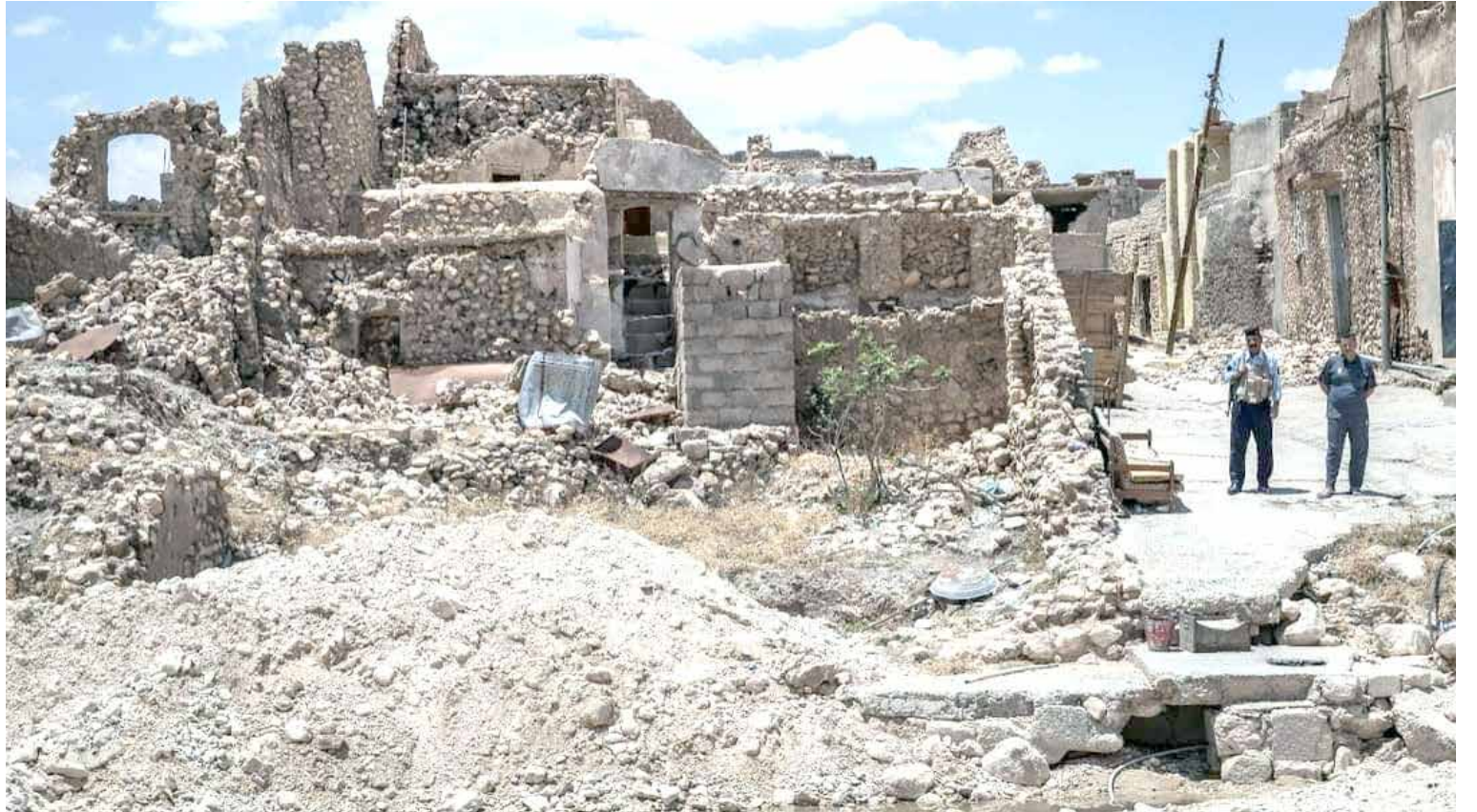
مدينة سنجار في محافظة نينوى