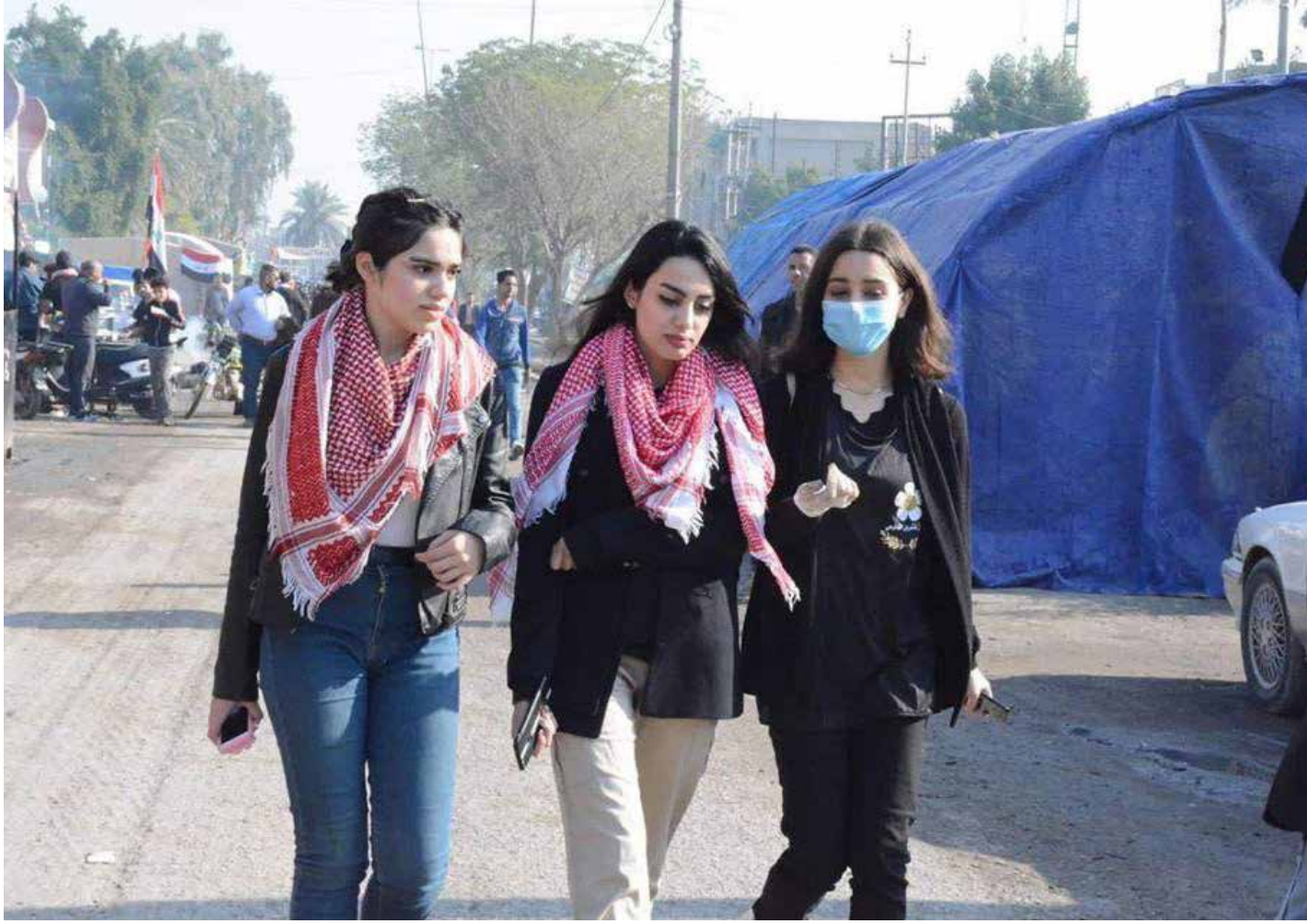
في انتفاضة تشرين الباسلة.. كسر الشباب القيد

واعترفت الناشطة أن "قوة تشرين دليل على هذا الاصرار والعزيمة والقوة التي تحلت بها النساء، واثبتت جداتها، جنبا الى جنب الرجل في الدفاع عن حقوقها".