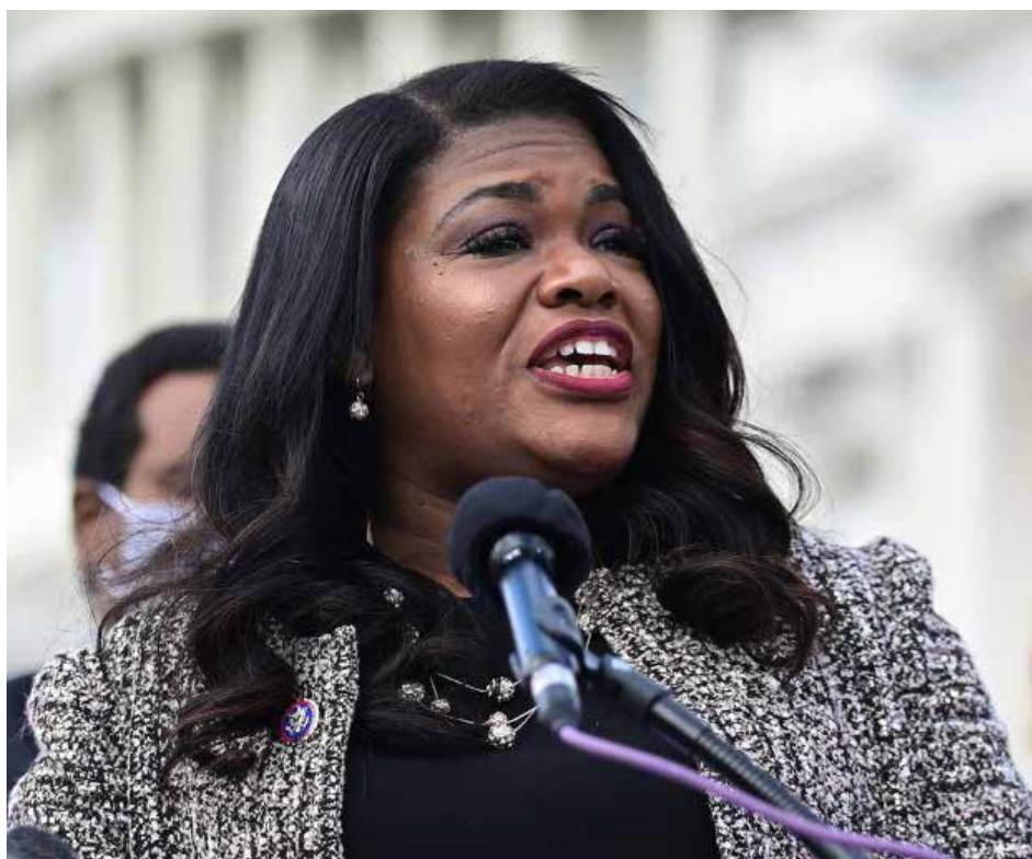
عضوة الكونغرس الأمريكي اليسارية كوري بوش

وبسعادة تقول ماريانيل دابريل عضو اللجنة السياسية الوطنية: «كنت أتطلع بشكل خاص إلى خطاب انديا والتون، فهي اشتراكية جريئة وستدير قريباً مدينة متوسطة الحجم، يوجد منها الكثير في الولايات المتحدة». فازت السياسة البارزة في منظمة الاشتراكيين الديمقراطيين والتون في انتخابات رئاسة بلدية بوفالو بولاية نيويورك في حزيران الفائت. «إنه أمر لا يصدق أن ترى فوزاً اشتراكياً هناك عندما يقولون إن المنظمة ليس لها جاذبية خارج المدن الكبرى». وتعتقد ماريانيل دابريل أن هناك عدة أسباب أدت إلى تماسك الاشتراكيين الديمقراطيين، منها الدور الفاعل في مقاومة ترامب والأكثرية الجمهورية في الكونغرس الأمريكي، كذلك الدور المؤثر لبرني ساندرز، الذي يعد من أبرز رموز اليسار، الذي