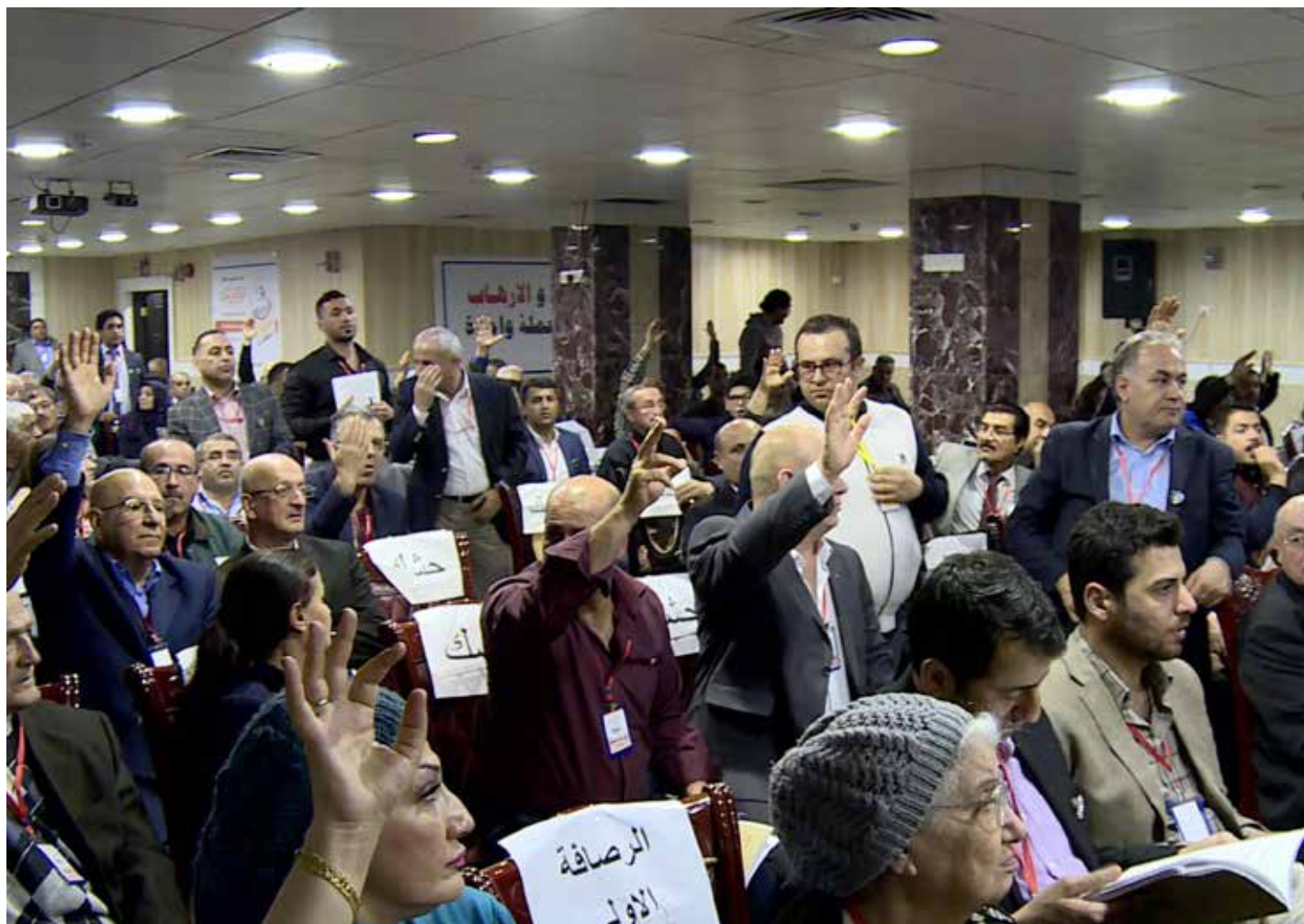
جانب من جلسات المؤتمر الوطني العاشر