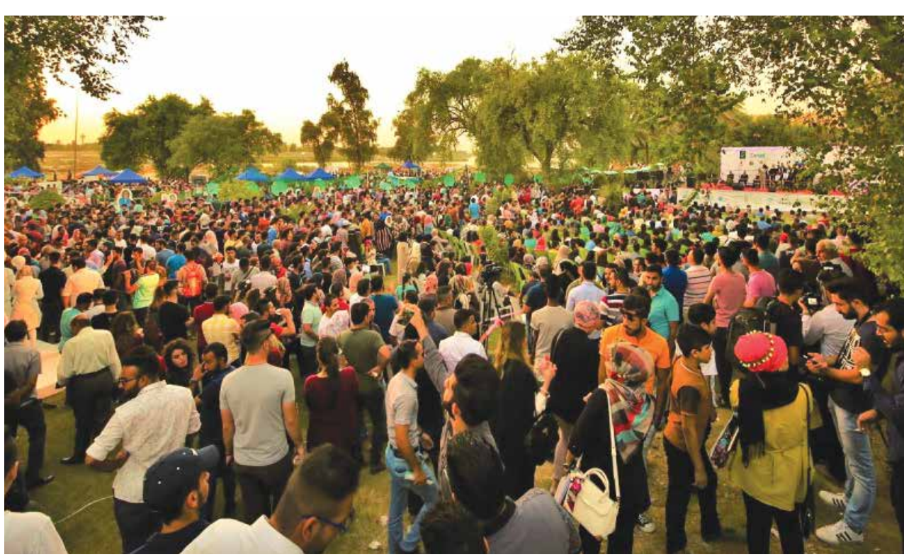
في يوم الشباب العالمي.. تحديات كبيرة تواجه الشبيبة العراقية

قال سكرتير اللجنة المركزية للحزب الشيوعي العراقي السابق، الرفيق حميد مجيد موسى، ان القوى المنتفذة المسيطرة على صنع القرار السياسي في البلد استمرت تقسيم المتغنايم على اساس المحاصصة.