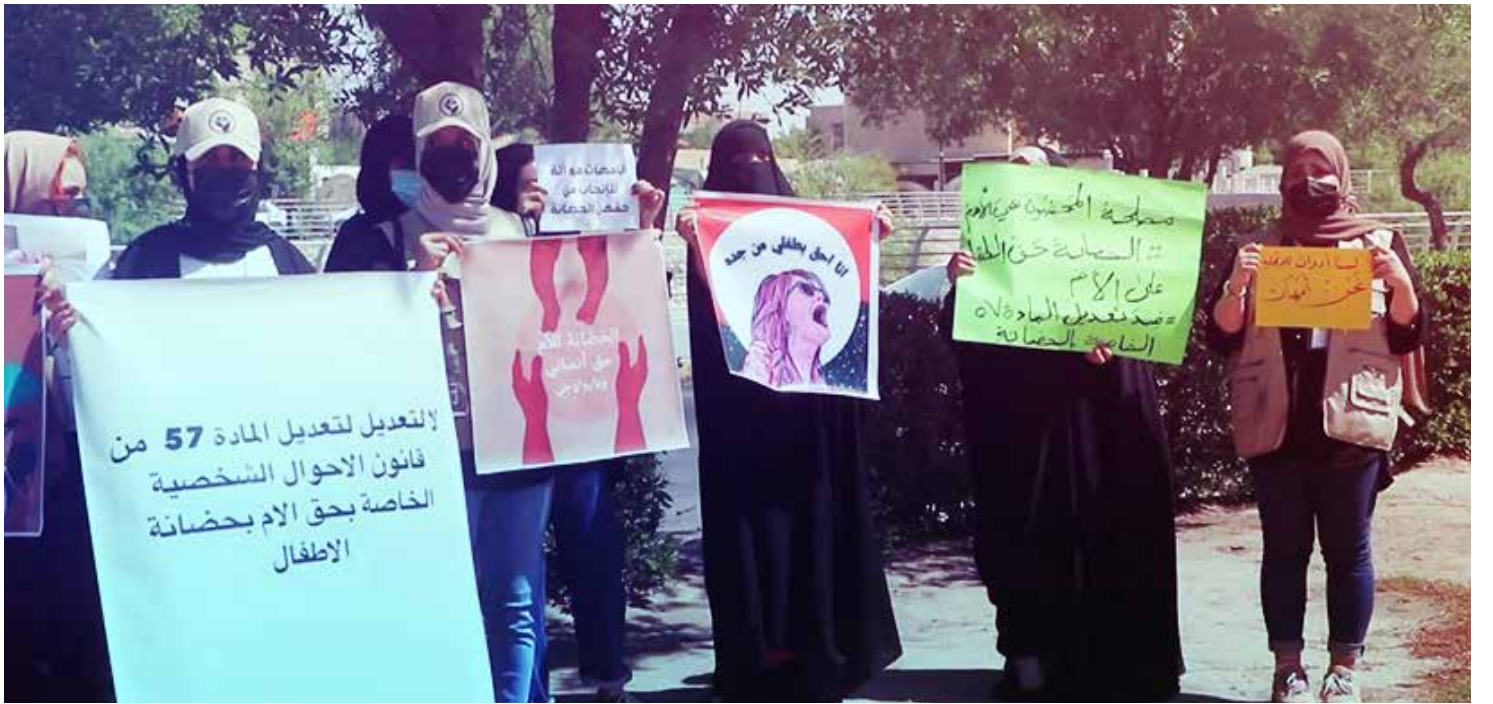
وقف احتجاجية في البصرة ضد تعديل المادة 57 من قانون الاحوال الشخصية

واضاف انه "بعد وصول عبد الكريم قاسم عام 1958 إلى السلطة، ووفقا لمولده اليسارية وعزمه على تحديث البلاد اجتماعيا واقتصاديا وسياسيا، تم تشكيل لجنة من وزارة العدل لتنفيذ المرسوم رقم 560 بتاريخ 7 شباط 1959 وظيفتها توحيد قانون الأحوال الشخصية لكل المذاهب"، مبينا أن "صدور القانون قوبل بترحيب القوى اليسارية وهو ما اثار حفيظة رجال الدين الذين قابلوا القانون بهجمة شرسة تمثلت بإصدار مجموعة من الكتب التي تعتبره مفسدة للمجتمع".