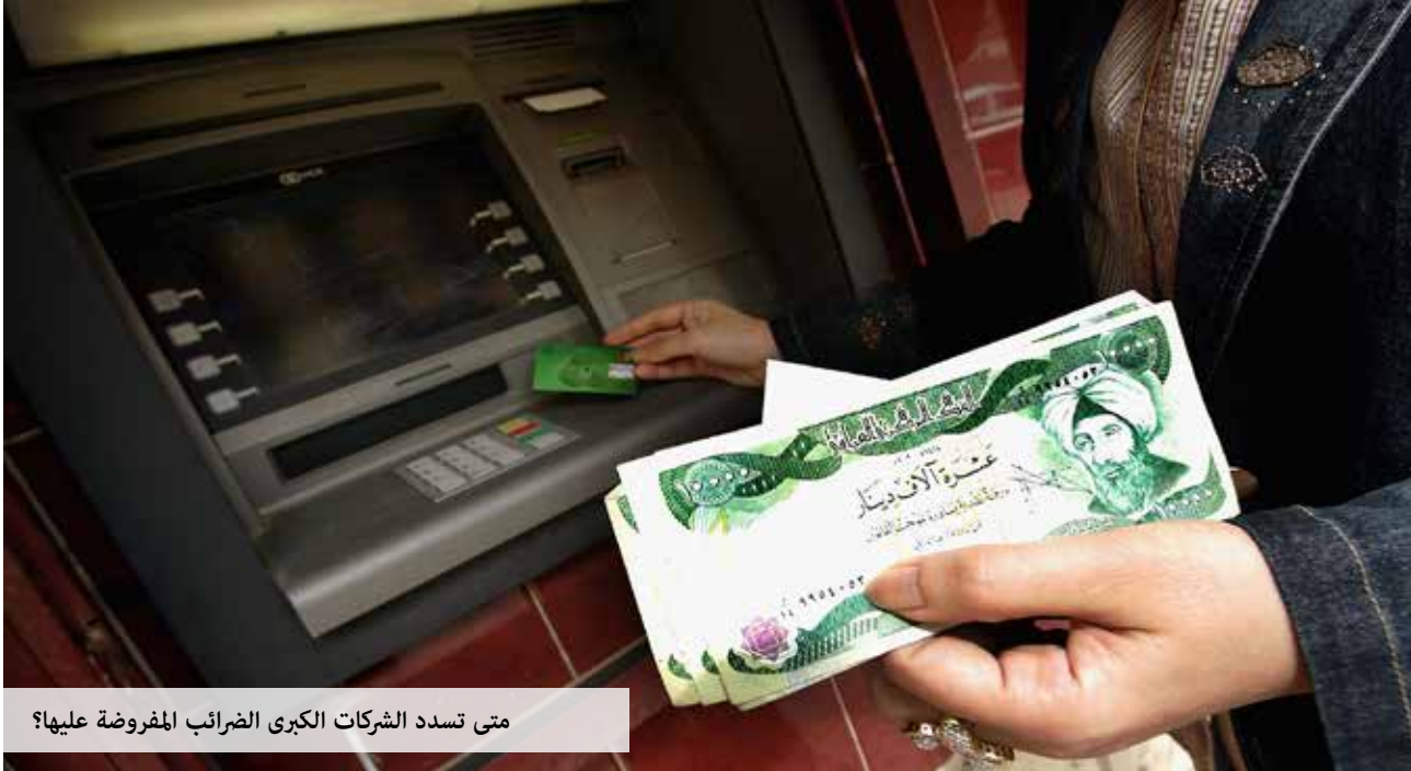
متى تسدد الشركات الكبرى الضرائب المفروضة عليها؟

لا تشرح متطلبات تطبيق القانون بشكل واضح، وتمنح موظفي الإدارة الضريبية حرية تقدير واسعة وتطبيق غير منسجم مع الواقع الحالي، ما يفتح الباب واسعاً أمام التلاعب والفساد.