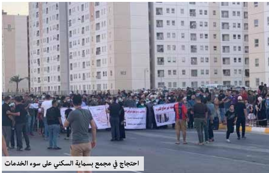
احتجاج في مجمع بسماية السكني على سوء الخدمات

في ذكرى وثبة كانون الثاني ١٩٤٨ كان شبابها يرددون: "بلله يا شباب نجدد الوثبة"، واليوم نقول ان الظروف الموضوعية مهيئة لتجديد عنفوان انتفاضة تشرين، ونريدها على الدوام ان تكون سلمية جماهيرية تطيح بالمنظومة الحاكمة الفاشلة والفاسدة، وتضع بلادنا على سكة التغيير الشامل وتدشين عملية البناء والاستقرار والحياة الكريمة، في دولة المواطنة والمؤسسات والقانون والديمقراطية الحقّة والعدالة الاجتماعية .