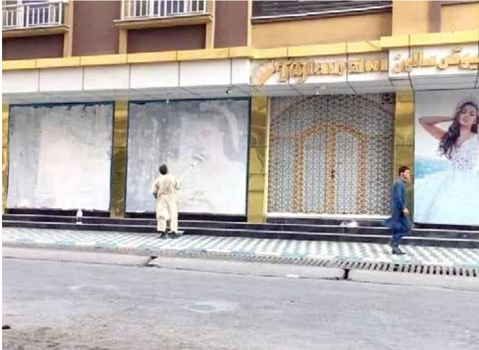
صاحب مركز للازياء النسائية يخفي صور النساء على جدار محله في العاصمة كابول قبيل دخول طالبان

تطورت الاحداث الأمنية سريعاً في أفغانستان بعد اعلان الولايات المتحدة عزمها على ترك قواعدها العسكرية هناك، بحسب مراقبين. وقال المراقبون انه بعد 20 عاماً من التواجد الأمريكي ظهر انها لم تقم بأي جهد لتسليم السلطة الى حكومة ديمقراطية، ما يعني انها فشلت فشلاً ذريعاً في تدخلها العسكري، إضافة الى عدم اجادتها للتفاهم مع القوى السياسية من اجل تداول السلطة سلمياً، بل تركت سلاحها سائباً لتسيطر عليه طالبان، ما يعني فشلاً سياسياً وعسكرياً آخر.