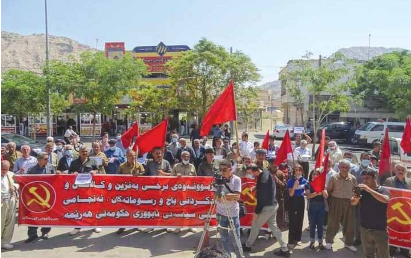
جانب من الفعاليات الاحتجاجية للحزب الشيوعي الكردستاني يوم أمس

في عموم الاقليم، للمطالبة بتخفيض اسعار رغيف الخبز والوقود ومعالجة مسألة الفقر والبطالة المنتشرة في الاقليم، ورفض السياسات التقشفية الجديدة، مبيناً ان المطالبات بإصلاح الوضع في الاقليم ستبقى مستمرة حتى تحقيق العدالة الاجتماعية.