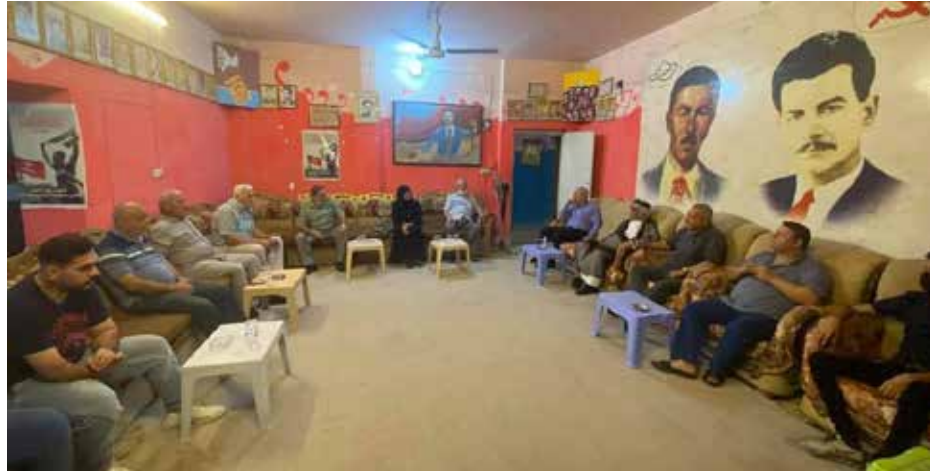
وفود تضامنية تزور مقر حزبنا في النجف