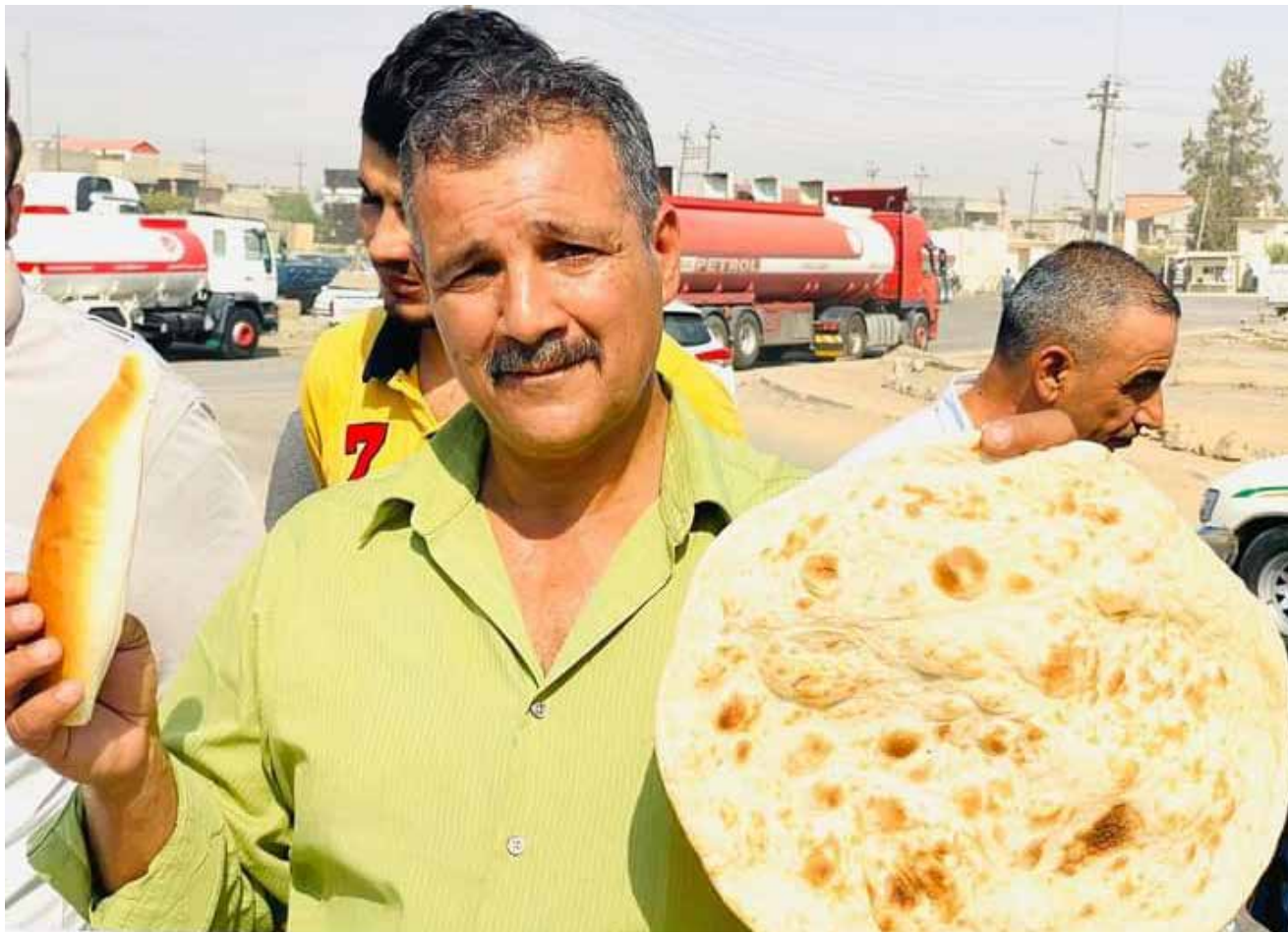
يتلاعبون حتى بالخبز والسمون!

الشعب اعتدت بالضرب على المحاضرين المجانيين لعام 2020، خلال مسيرة احتجاجية، للمطالبة بالتعاقد معهم، مشيراً الى ان "العشرات من المحاضرين في المجان، نظمو مسيرة احتجاجية امام مبنى المحافظ".