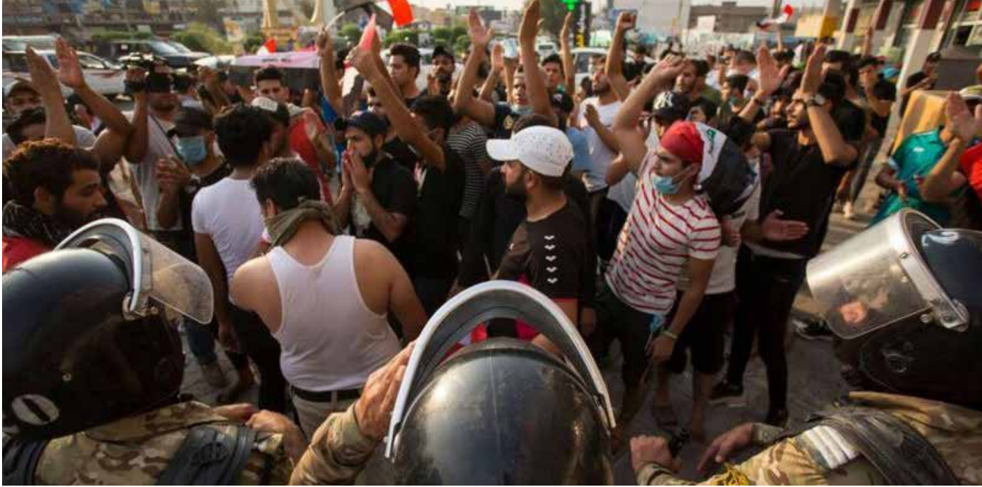
يتظاهرون احتجاجاً على تفشي البطالة والفساد

عاقق وزارة العمل بمفردتها، وإنما هي مسؤولية الحكومة بصورة عامة. وزاد العقابي ان وزارته «عملت مؤخراً على اطلاق القروض الميسرة ذات الفوائد القليلة من صندوق الاقراض للشباب العاطلين عن العمل، فضلاً عن المضي في مشروع توسيع الكشكات». وتابع ان الهجرة والمهجرين «تعمل وبالتنسيق مع امانة بغداد على تخصيص قطع اراضٍ نموذجية لنصب كشكات للشباب». كما تعمل الوزارة، بحسب متحدثها، على «فتح دورات تدريبية تسعى من خلالها تطوير مهارات الشباب ضمن الحرف والاعمال التي يميلون اليها».