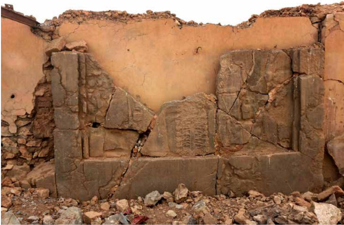
آثار مدمرة من قبل داعش في النمرود بينوي

بالآثار أو فرض ضرائب على مهربين في أراض تحت سيطرته بـ20 مليون دولار، من أصل إجمالي إيراداتهم المقدر بـ2.3 إلى 2.68 مليار في 2015، بحسب تقرير لمنظمة "غلوبال أنشانتيف ضد الجريمة المنظمة" في 2020.