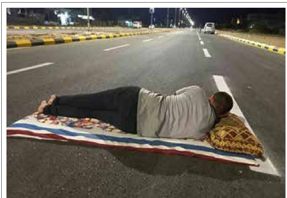
إيفاء لـ "نذر" قطعه على نفسه.. مواطن واسطي ينام على الشارع بعد تبليطه!

أفاد تقرير صادر عن موقع "اوبن ديمقراطي" البريطاني، بأنه "على الرغم من مرور سبع سنوات على اجتياح تنظيم داعش الارهابي لمناطقهم في سنجار، ما زال الآلاف من النازحين الإيزيديين العراقيين يعيشون ظروفاً إنسانية سيئة جداً في مخيمات بائسة بإقليم كردستان". وذكر التقرير الذي ترجمته وكالة "المعلومة"، ان "حوالي 18 الفا من الإيزيديين يعيشون في ظروف مزرية داخل المخيمات. ففي معسكر شارب لا تزال 3 آلاف أسرة إيزيدية تعيش في خيمات تنتشر فيها رائحة القمامة الكريهة"، مضيفاً أن المعسكر تم إنشاؤه عام 2015 وتديره حكومة إقليم كردستان، ومعظم سكانه من إيزيديي سنجار، الذين فروا من حملة الإبادة الجماعية التي شنها تنظيم داعش