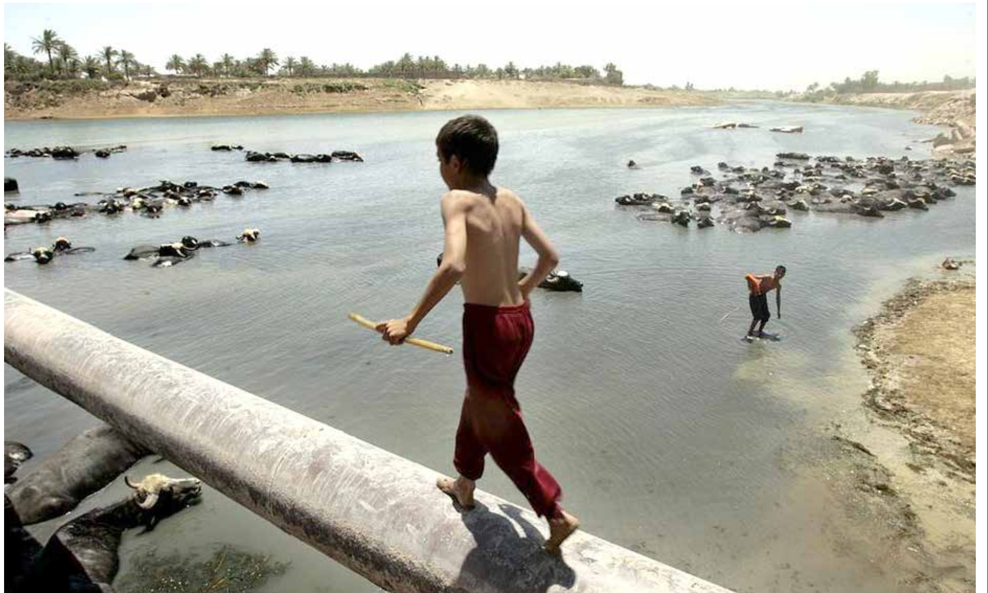
مؤشرات على تراجع الثروة الحيوانية نتيجة شح مياه دجلة والفرات

وفق أوراق بحثية عراقية يُقدّر التدفق الطبيعي لمستجمعات مياه الفرات ما بين 27,0 إلى 35,1 مليار متر مكعب/ السنة، في حين يصل تدفق مستجمعات مياه دجلة، بما في ذلك روافده، ما بين 41,2 إلى 58,3 متر مكعب/ السنة، إلا ان كمية التدفق السطحي انخفضت بسبب انخفاض