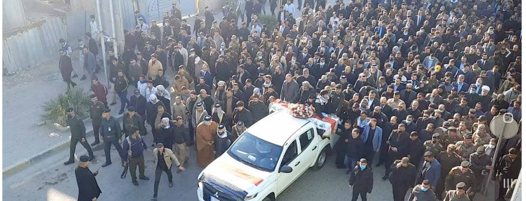
جانب من تشييع القاضي احمد فيصل في محافظة ميسان، يوم امس