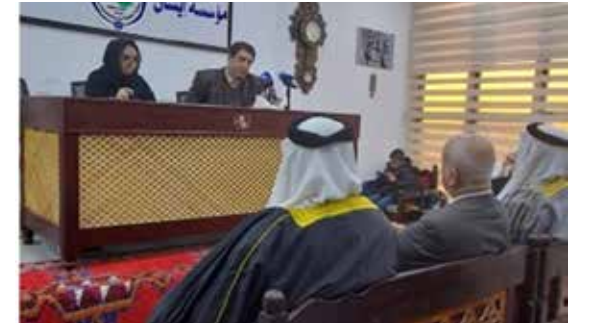
بغداد - ستار الناصر

أقامت "مؤسسة إيشان" للثقافة الشعبية في بغداد، اخيراً، حفل استذكار للعلامة الأب أنستانس ماري الكرمل، في مناسبة مرور 75 عاماً على رحيله. الحفل الذي حضره جمهور من المثقفين والأدباء والأكاديميين، قدم فيه عدد من المختصين في الثقافة الشعبية، أوراقاً بحثية حول مسيرة الراحل العلمية ومنجزاته ومؤلفاته الصادرة والمخطوطة.