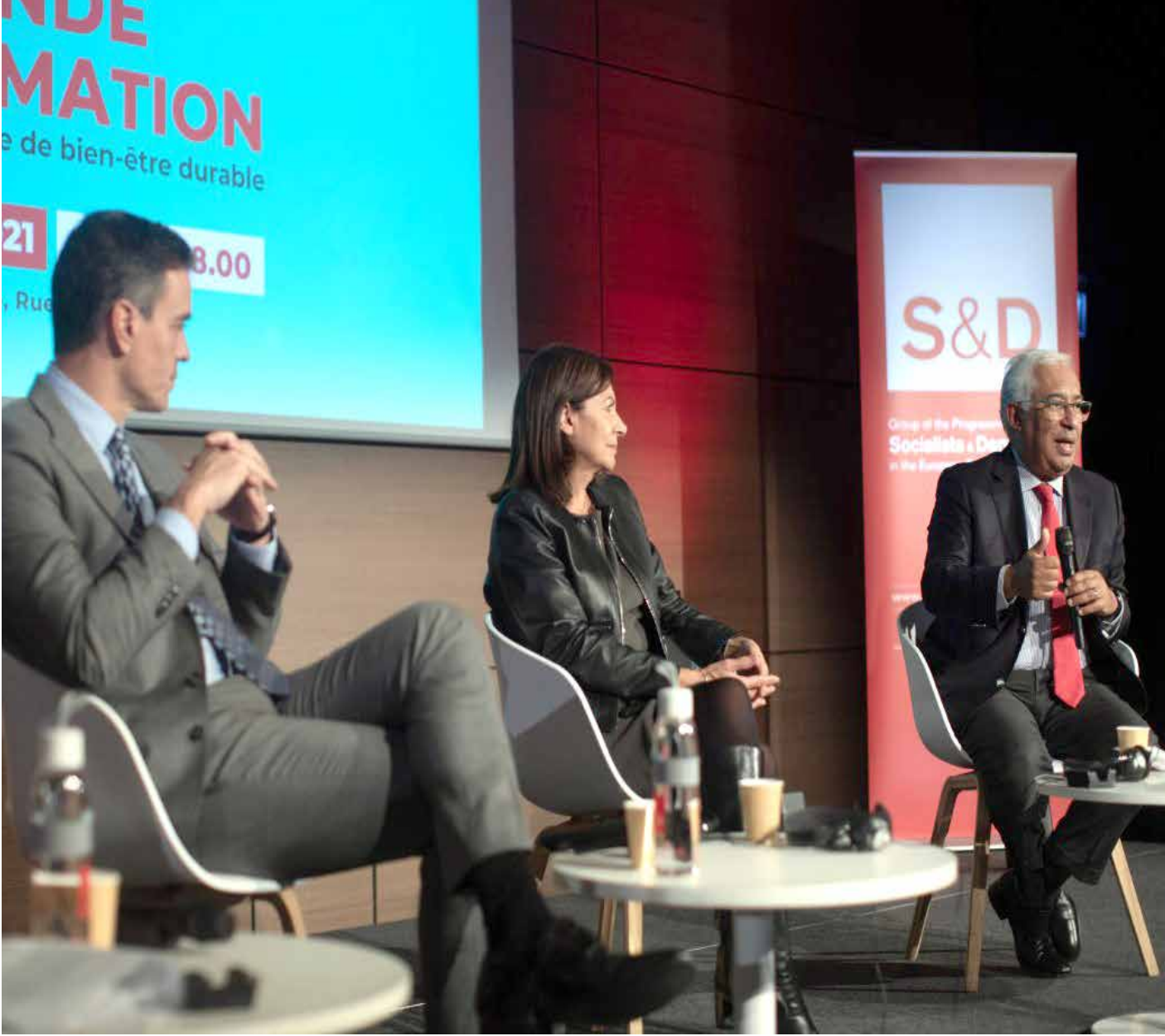
من اليمين: زعماء الشيوعي والاشتراكي وكتلة اليسار

وبعد انتخابات 2019، أراد حزب كتلة اليسار التفاوض المسبق على اتفاق جديد للفترة التشريعية على غرار الدورة البرلمانية السابقة. وقدمت الكتلة برنامج الحد الأدنى بشأن قضايا العمل، أي إلغاء القيود التي فرضتها الترويكا: تخفيض قيمة العمل الإضافي، وتقليل عدد أيام الإجازة، وتقليص أساس حساب تعويض إنهاء الخدمة من 30 إلى 12 يوماً لكل سنة عمل. من جانبه، رفض الحزب الشيوعي الاتفاق المسبق، وفضل التفاوض السنوي على الموازنة فاختار الحزب الاشتراكي هذا المسار، مما مكنه من عدم الاضطرار إلى قبول أي شروط