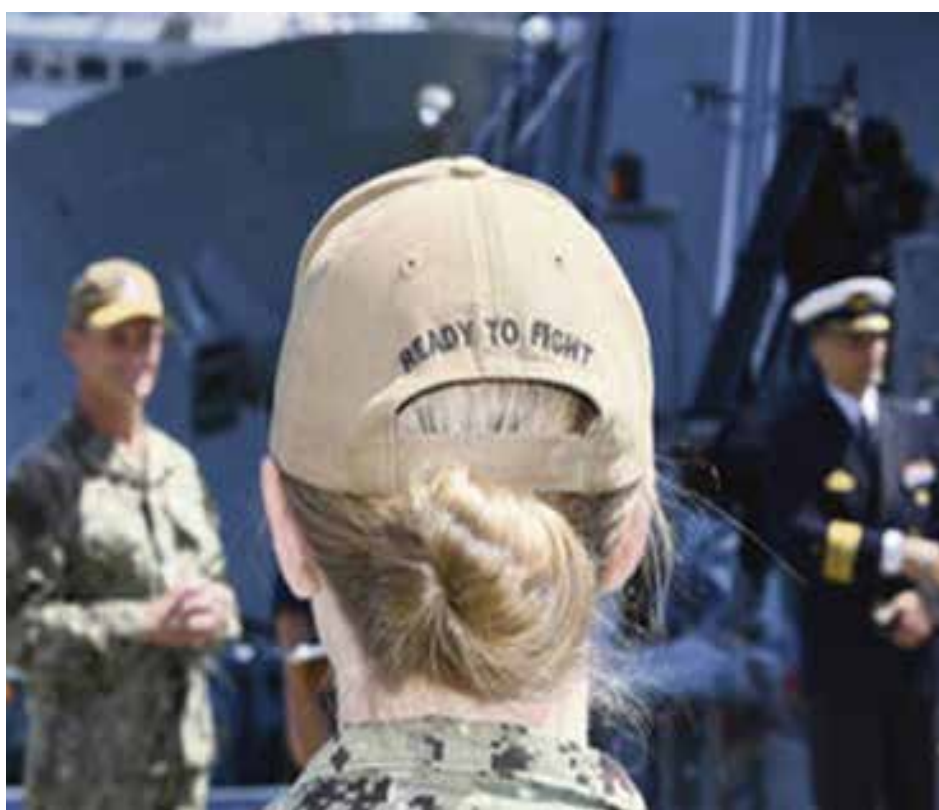
مناورات أمريكية في بلدان البلطيق

ان ما يجري ليس صراعا اوربيا جانبيا، بل يقف في مركز الصراع الأمريكي الروسي، ولا يمكن تجاوزه، الا بإنهاء الضغط العسكري على روسيا، والا سبكون الرد اقتراب الصواريخ الروسية من مناطق الأمن القومي الأمريكي، وهذا ما دعا إدارة الرئيس بايدن لفتح قنوات الحوار المباشر مع روسيا. ولهذا تطالب قوى اليسار والاعتدال بمشاريع الأمن الأوربي المشترك والكف عن استبعاد روسيا او محاصرتها. وان استمرار التوتر بين مراكز الهيمنة يخدم مصالح الولايات المتحدة بشكل مباشر، ويعمق تبعية أوروبا الغربية لها.