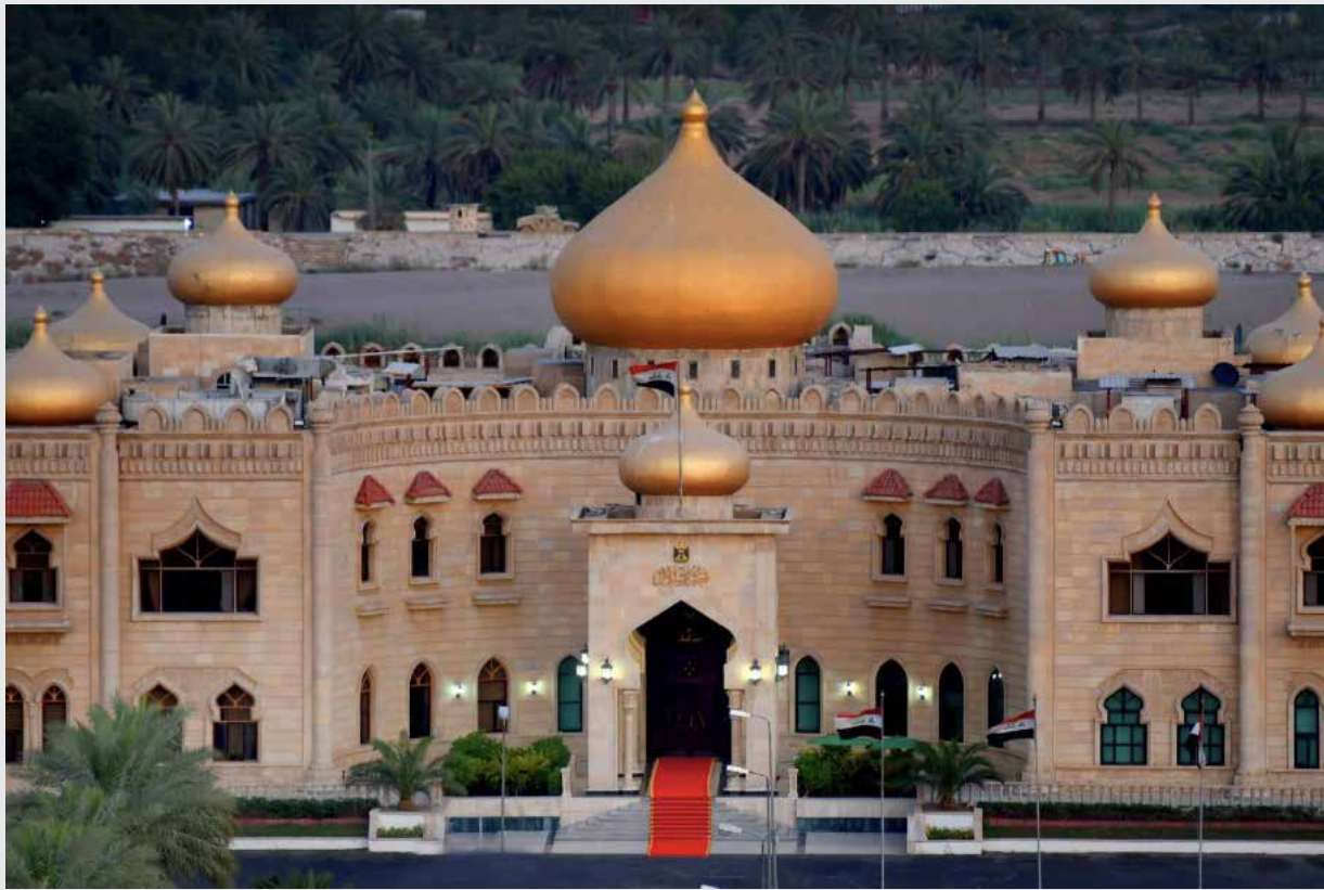
قصر السلام في بغداد

رئيس الجمهورية في حالة عدم وجود نائب له، على أن يتم انتخاب رئيس جديد خلال مدة لا تتجاوز ثلاثين يوماً من تاريخ الخلو... إي أن الذي يحل محل رئيس الجمهورية عند إعلان خلو المنصب هو رئيس مجلس النواب، وأن المجلس الذي هو سبب التعطيل لانتخاب الرئيس الجديد، تتم مكافأته بإعلان رئيسه أن يكون رئيس الجمهورية، وهذا ما لا يستجيب للمنطق وروح الدستور.