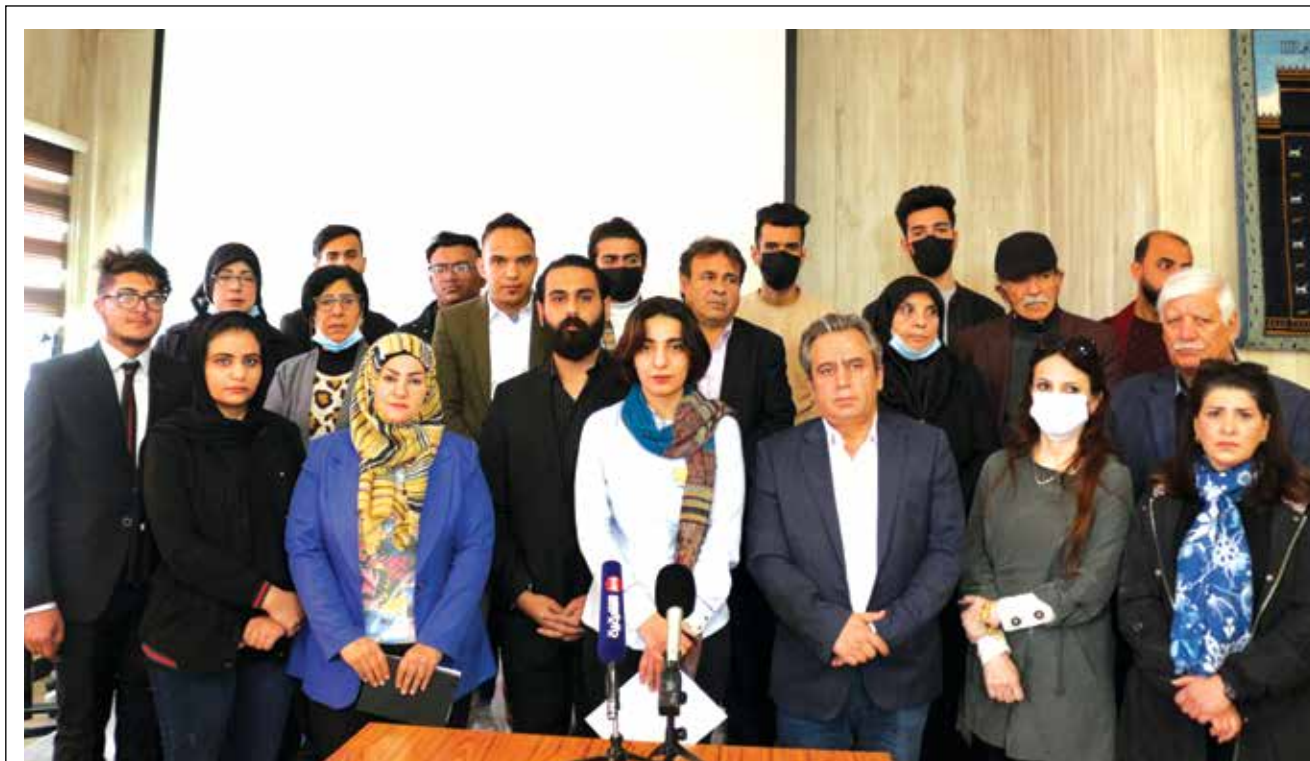
من المؤثر الصحفي لمجموعة من الناشطين أمس الاول السبت في بغداد حيث اطلقوا حملة وطنية لتشكيل حكومة اقلية سياسية، تبني برنامجا عمليا بتوقيبات زمنية محددة. وقد أكدوا رفضهم العودة الى نقطة الصفر عبر توزيع الحصص والمنافع بين المنتفذين.

من المقرر أن ينتخب مجلس النواب رئيساً للجمهورية، في الجلسة التي تقرر عقدها اليوم الاثنين، لكن الخلافات والجدل المثار حول بعض المرشحين للمنصب وقرار المحكمة الاتحادية بخصوص النصاب، ومن بعد ذلك مقاطعة الكتلة الصدرية الجلسة، كل هذا قد يلقي بظلاله على إمكان تأمين النصاب الدستوري لعقدها.