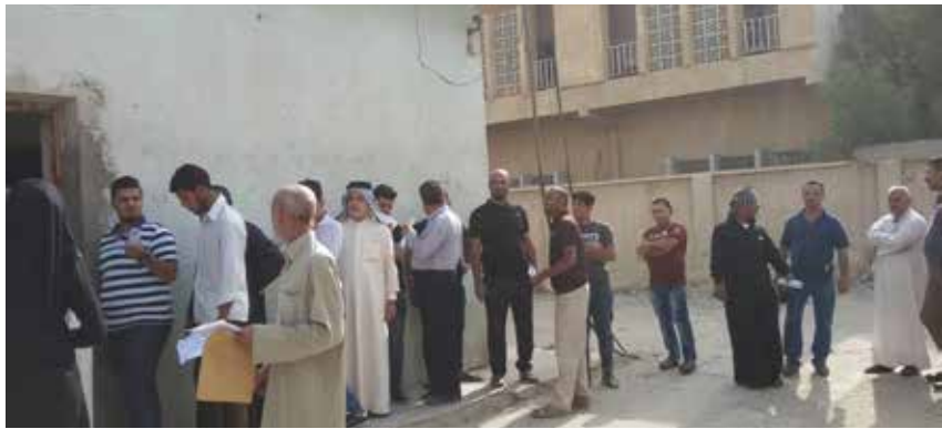
مطالبات بتخفيض رسوم المعاملات والابتعاد عن البيروقراطية

يشكو كثير من المواطنين من ارتفاع اسعار الرسوم الواجب دفعها لأجل استحصال الاوراق الثبوتية الرسمية، كجواز السفر وبطاقة اللقاح الدولية وغيرها، مؤكداً ان هذه الرسوم تُجمع دون أن يتم تقديم أية خدمة للمواطن، لأن الحصول على هذه الاوراق الرسمية هو حق من حقوقهم.