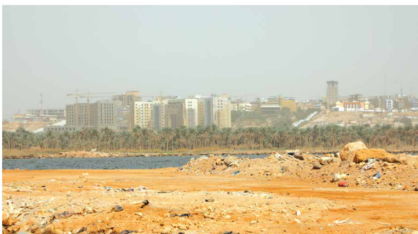
هكذا يبدو حال بحيرة "النجم" احدى اهم مدن السياحة الدينية