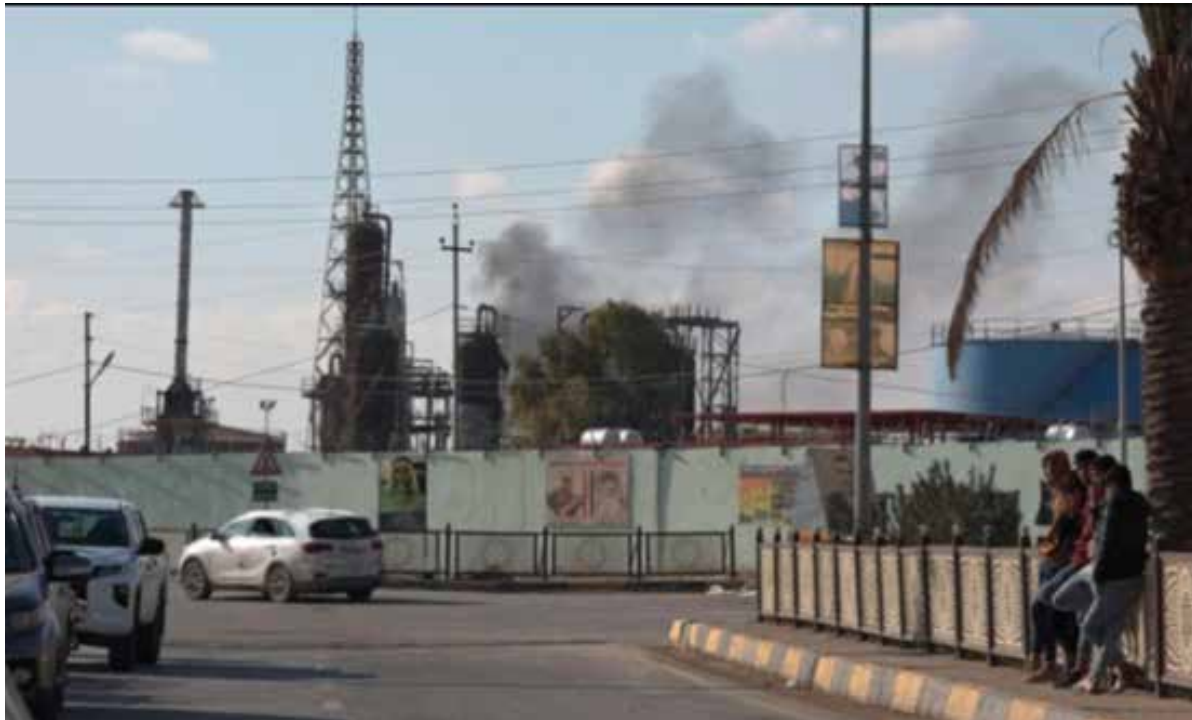
الدخان الأسود ينبعث باستمرار من مصفى القيارة