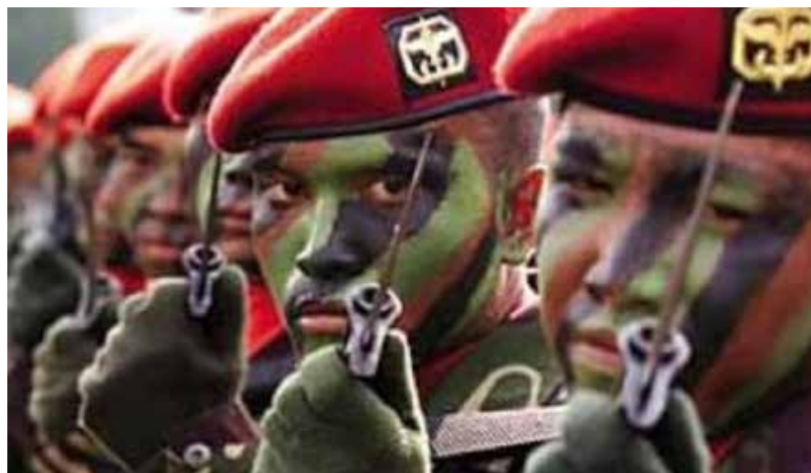
الحرب في أوكرانيا انعشت سباق التسلح في آسيا

فقط، بل وفي آسيا أيضاً. تتناوب الشركاء العسكريين للولايات المتحدة "مخاوف" متزايدة، بشأن أي عمل صيني محتمل. واتسعت دائرتها بعد إعلان "الشراكة الاستراتيجية" في الاجتماع الأخير بين الرئيسين الصيني والروسي.