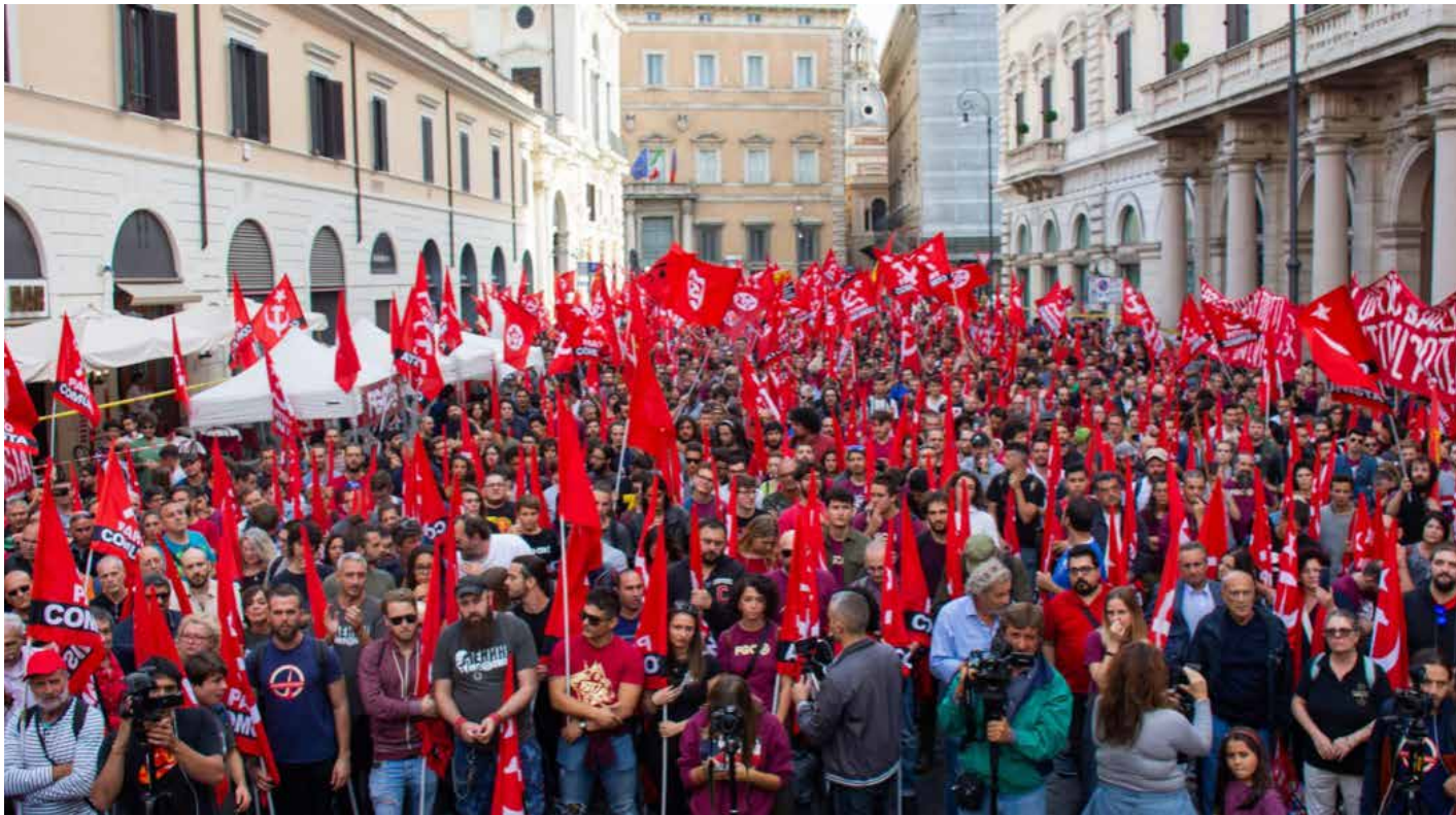
تظاهرة لانصار الحزب الشيوعي الإيطالي

حين ترد كلمتا يسار أو يمين يتبادر للذهن مباشرة التفسير الجهوي الجغرافي. أي بمعنى مادام هناك يمين فأنا هناك يساراً أيضاً، وبالعكس. يفسر المنجد في اللغة كلمة اليسار وجمعها يسر بفتح الياء، على أنها مرادفة لمعنى البركة والقوة والمنزلة الحسنى، وأيضاً السهولة واللين بالصد من العسر. كما أن اليسرة ترد معاكسة لليمنة، وهكذا فأنا الأيسر يكون عكس أو خلاف الأيمن. ومن المتعارف عليه أن هناك دلالات سياسية وفكرية لمصطلح يسار ويسارية، لكن المعنى الجهوي الجغرافي قد سبق بزمان طويل المعنى والدلالات السياسية والفكرية.