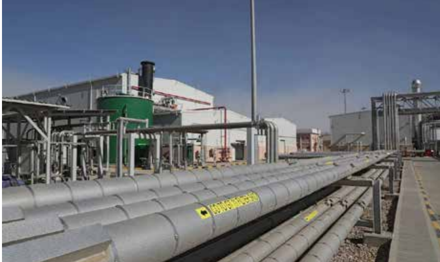
محطة لتوليد الطاقة الكهربائية في الناصرية