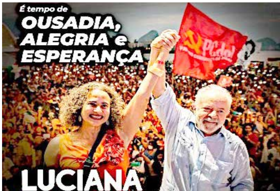
لولا مع زعيمة الحزب الشيوعي في البرازيل