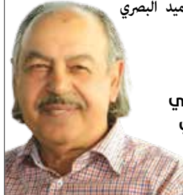
المكتب السياسي للحزب الشيوعي العراقي 2022-4-27