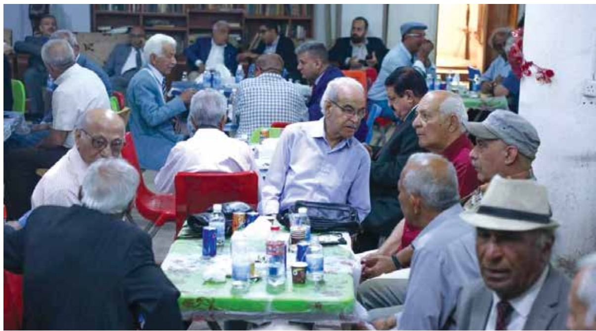
جانب من استقبال المهنيين بمناسبة عيد الفطر في مقر اللجنة المركزية للحزب الشيوعي العراقي الاثنين الماضي في بغداد