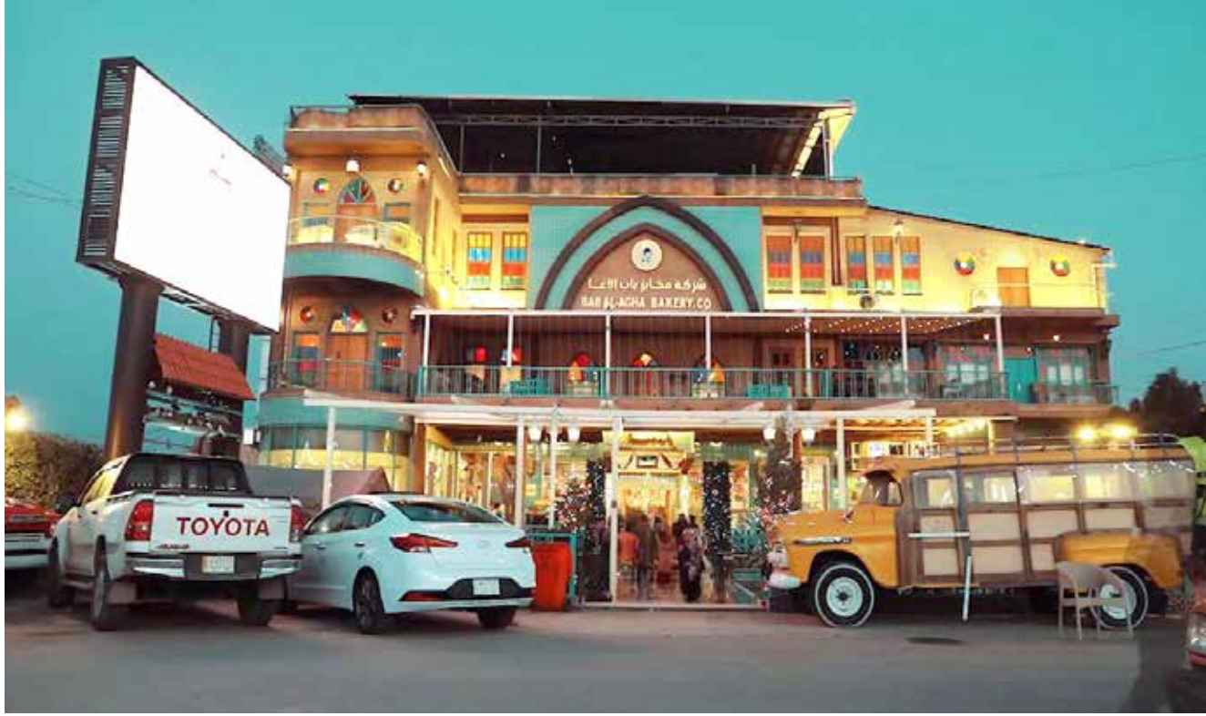
صورة لمخابر باب الاغا التي تم اغلاق بواباتها أخيراً