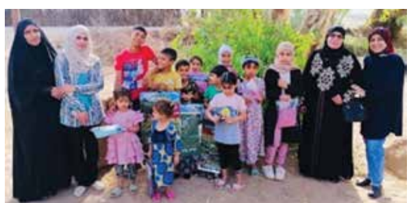
في ريف آل بدير

ومع حلول عيد الفطر، وزعت رابطة المرأة العراقية في النجف "ملابس العيد" على الأطفال في "ريف آل بدير" في المحافظة. وتحرص الرابطة في كل عيد على اشاعة الفرحة في نفوس الأطفال من خلال مبادرتها هذه، ساعية في الوقت ذاته إلى التخفيف من الأعباء الاقتصادية المترتبة على أسرهم في ظل الظروف المعيشية الصعبة.