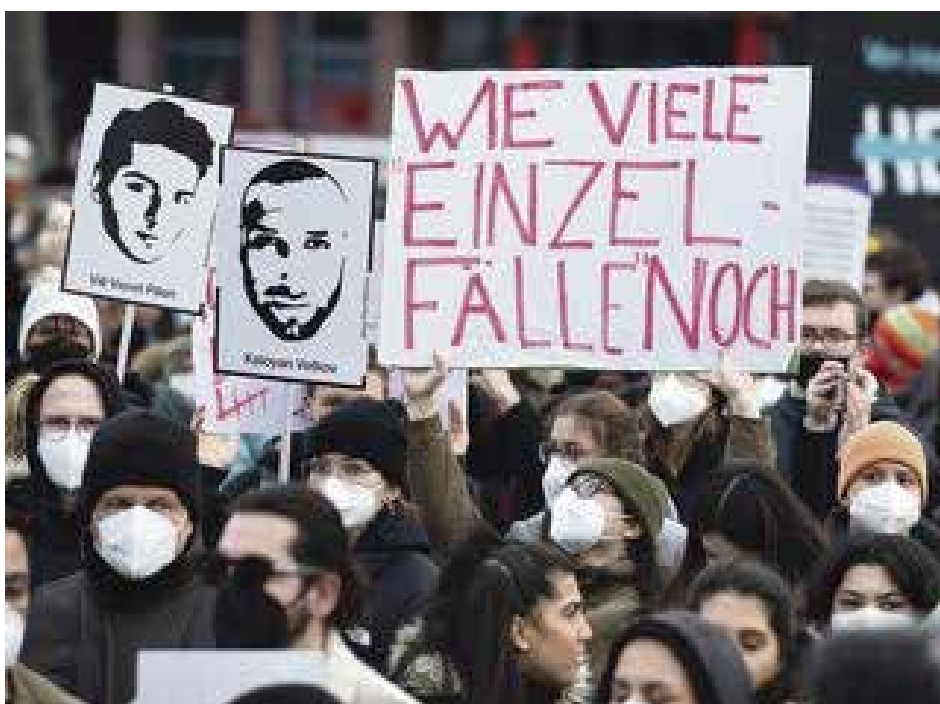
تجمع مناهض للعنصرية في ألمانيا

وقالت وزيرة العائلة في الحكومة الاتحادية ليزا باوس (حزب الخضر): "لقد شكلت العنصرية مجتمعنا لفترة طويلة، وبالتالي شكلتنا أيضاً". والوزيرة تراهن على استعداد العديد من الناس للانخراط في مكافحة العنصرية. وأكدت على مشروع "الديمقراطية الحية" وقانون تعزيز الديمقراطية قيد الاعداد، والذي يهدف إلى إلزام الحكومة الفيدرالية بحماية هياكل المجتمع المدني بشكل دائم من التطرف والعنصرية. وفيما يتعلق بمسألة التدابير التي ينبغي اتخاذها ضد عنصرية مؤسسات السلطات العامة، قالت باوس "يجب أن تكون هناك مجموعة من الإجراءات". ولم تشرح بالضبط ماهية هذه الإجراءات.