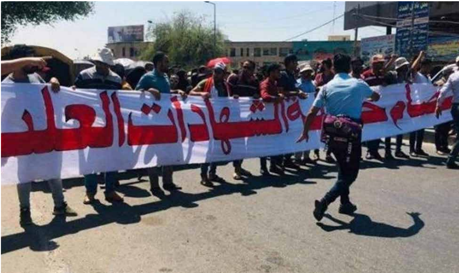
حملة الشهادات العليا.. ثروات علمية تجاهلتها الحكومات

وأكد الخريجون الأوائل الذين باشروا ن تجمعات لهم للمطالبة بتعيينهم، أن حقوقهم ما زالت ضائعة وهناك