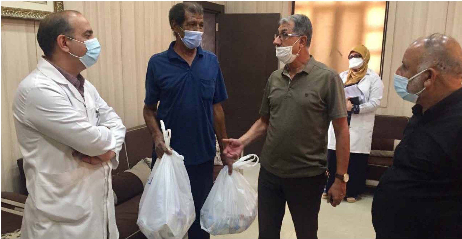
جانب من زيارة شيوعي كربلاء الى مستشفى الطفل التعليمي لتحية جهود الكادر الطبي في مواجهة جائحة كورونا والتبرع ببعض المستلزمات الطبية