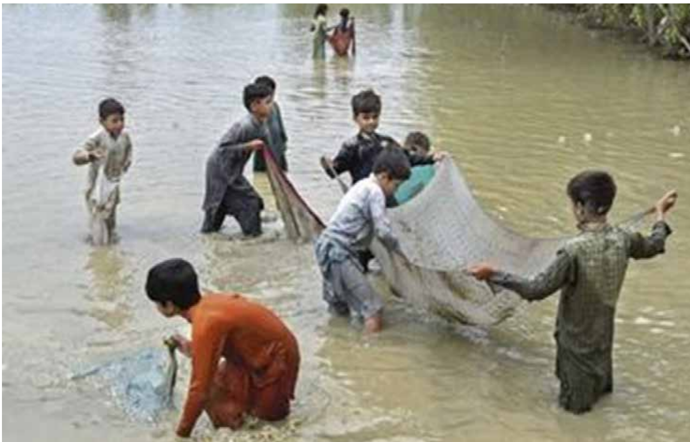
أطفال يبحثون عما يغني عن جوع

في الأسبوع الأخير من آب غطت مياه الامطار والفيضانات ثلث مساحة باكستان. ودمرت السيول جسوراً وطرقاً وقصبات بأكملها. والبلاد التي كانت تنتظر موسم الامطار بأمل، بعد ربيع حار وجاف، فوجئت بأمطار لم تر مثلها خلال الثلاثين سنة الاخيرة. حيث لم يفقد الملايين من الناس منازلهم فقط، بل فقدوا أيضاً محاصيلهم، وبالتالي مستقبلهم. وأصبح منظر الشاحنات الطويلة والدراجات النارية ومجموعات لا حصر لها من الأفراد، الذين يفرون سيراً على الأقدام عبر الشوارع المغمورة بالمياه، مألوفاً في البلاد.