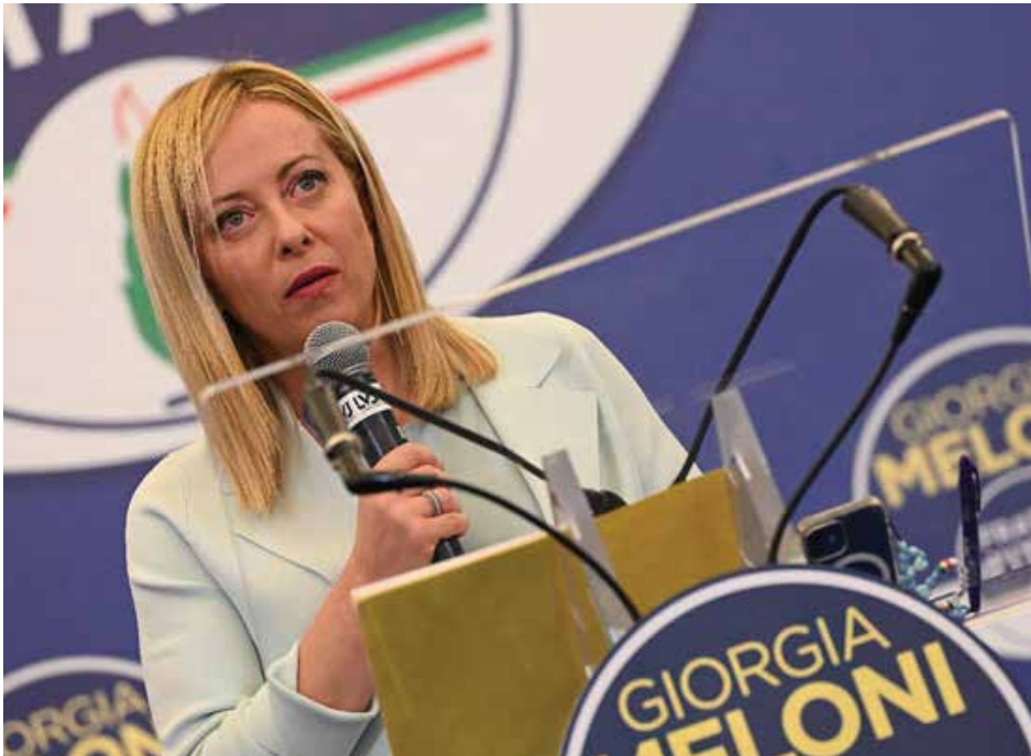
السياسية الفاشية ميلوني ستقود حكومة إيطاليا المقبلة

الليبرالية الجديدة وعدم شعبية أجندة حكومة دراغي، لم تتمكن من أن نصبح نقطة مرجعية للبدل. ومن الواضح أن القيام بالشيء الصحيح لم يكن كافياً، كنا نعلم أنه نظراً لتوازن القوى في المجتمع ووسائل الإعلام، كانت هذه مهمة صعبة للغاية. ولم يسمح لنا الوقت القصير لحملة انتخابية سريعة جداً بتطوير مشروع التحالف".