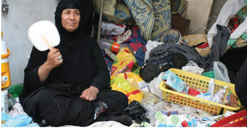
كدح مستمر.. متى يمكن ان تحض بفسحة من الراحة؟

وتشير إلى أن رب الأسرة في أغلب العوائل يحرص على وضع ميزانية شهرية خاصة تحت يد المرأة بغية تدبير الشؤون المنزلية، لذلك وبعد ارتفاع الأسعار بات أبرز موضوع يطرح في مجالس النساء هو كيفية تدبير شؤون البيت وتوفير الطعام في ظل الارتفاع الجنوني للأسعار، من دون أي زيادة مالية تدعم مخصصات الاتفاق الشهري".