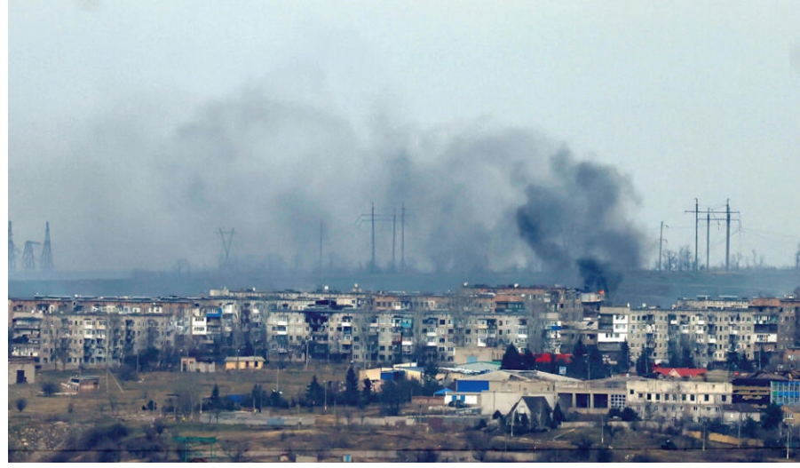
الدخان يتصاعد في مدينة سوليدار الأوكرانية

سيطرت مجموعة من القوات الروسية، على مدينة سوليدار، الواقعة شرق أوكرانيا، أمس الأربعاء، بعد معارك كثيفة خلال الأسبوع الحالي، وفقاً لقائد مجموعة فاغز الروسية "يفغيني بريغوجين". وفي تطورات الحرب الروسية - الأوكرانية، تعتمز كندا شراء منظومة دفاع جوي من طراز "ناسام" من الولايات المتحدة لتقديمها هبة لأوكرانيا. فيما تدرس بريطانيا إمكانية تزويد كييف بدبابات "تشانلجر 2".