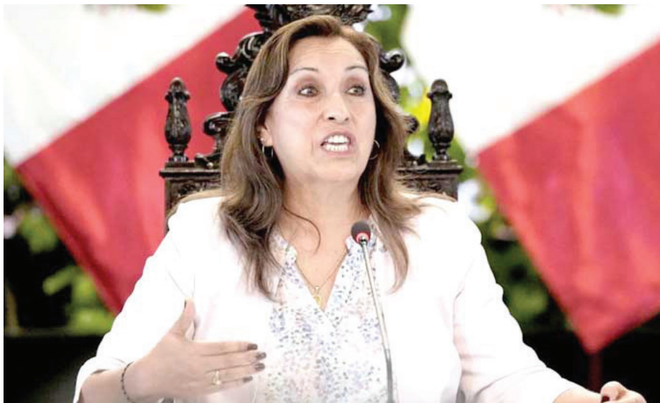
الرئيسة المتهمه دينا بولوارتي

الرئيس اليساري حل السلطة التشريعية في البلاد. ومنطقة بونو الحدودية مع بوليفيا هي مركز الاحتجاجات في البلاد إذ تشهد منذ 4 كانون الثاني 2026 إلى نيسان 2024.