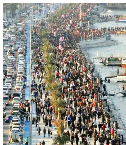
كورنيش العشار يكتظ بالوافدين