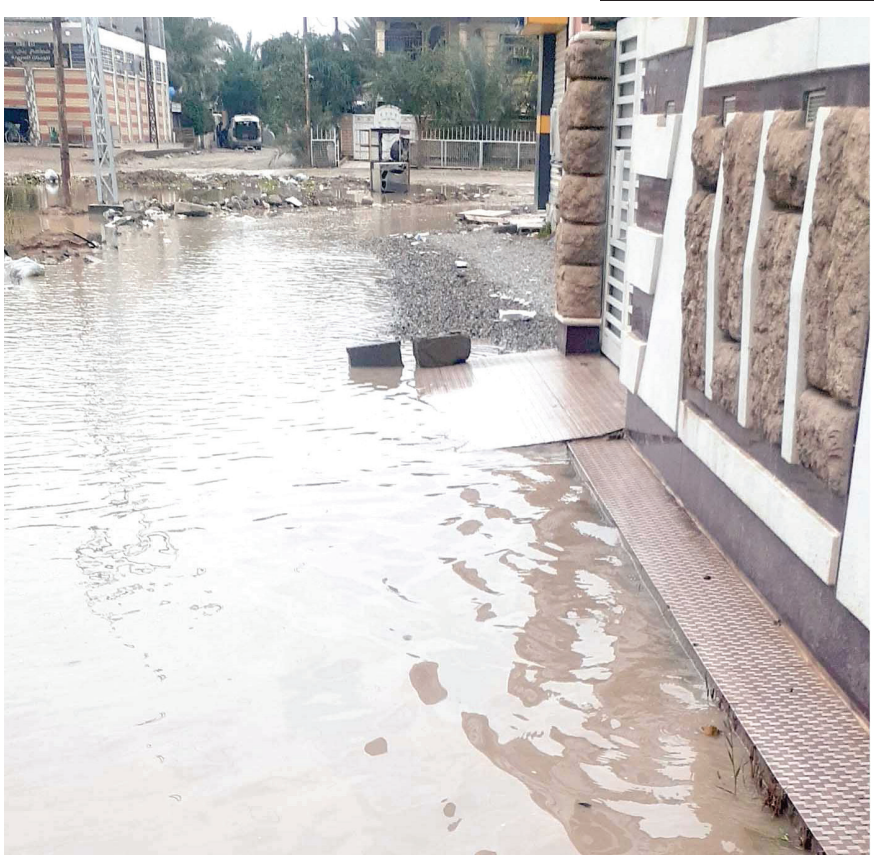
أهالي منطقة الرحمة - المجمع الصناعي في بعقوبة: انقذونا.. مياه الأمطار دخلت إلى منازلنا، منذ ثلاثة أسابيع ونحن على هذا الحال!