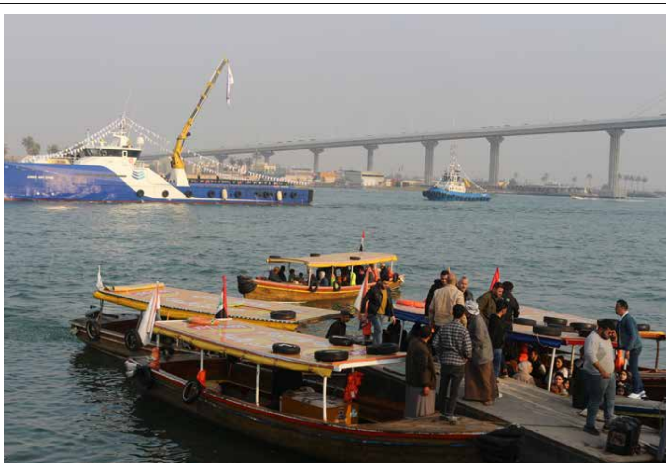
شط العرب في البصرة يشهد اقبالا لافتا للمواطنين على ركوب الزوارق والسفن الكبيرة خلال مشاركتهم في بطولة خليجي 25