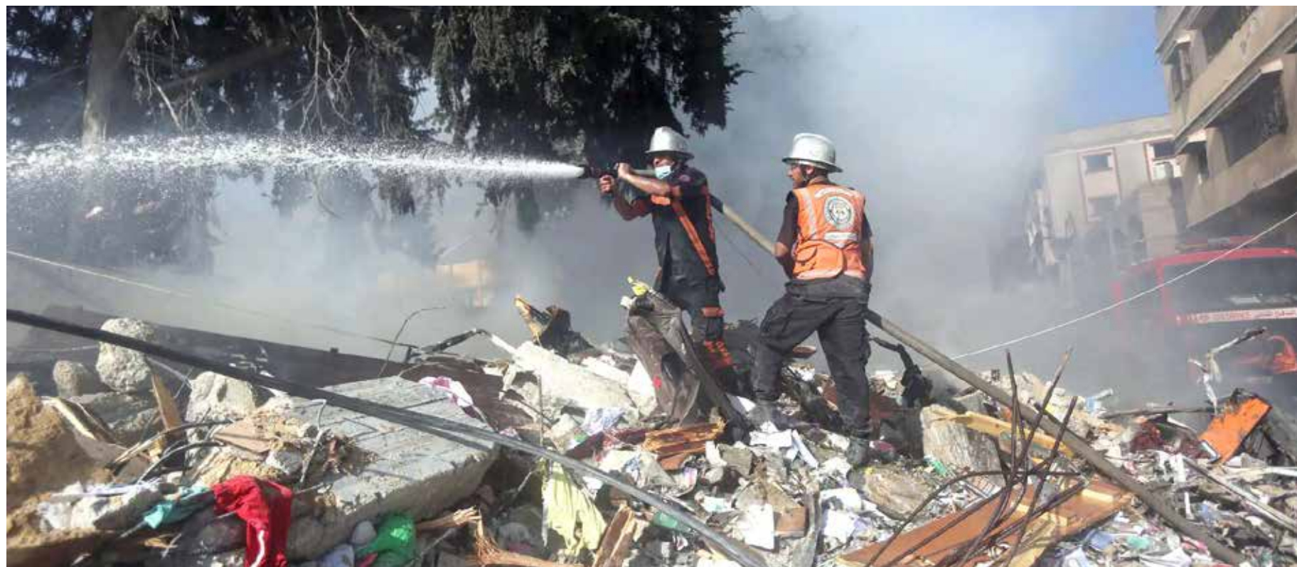
الدفاع المدني في غزة يكافح حرائق القصف الصهيوني في قطاع غزة