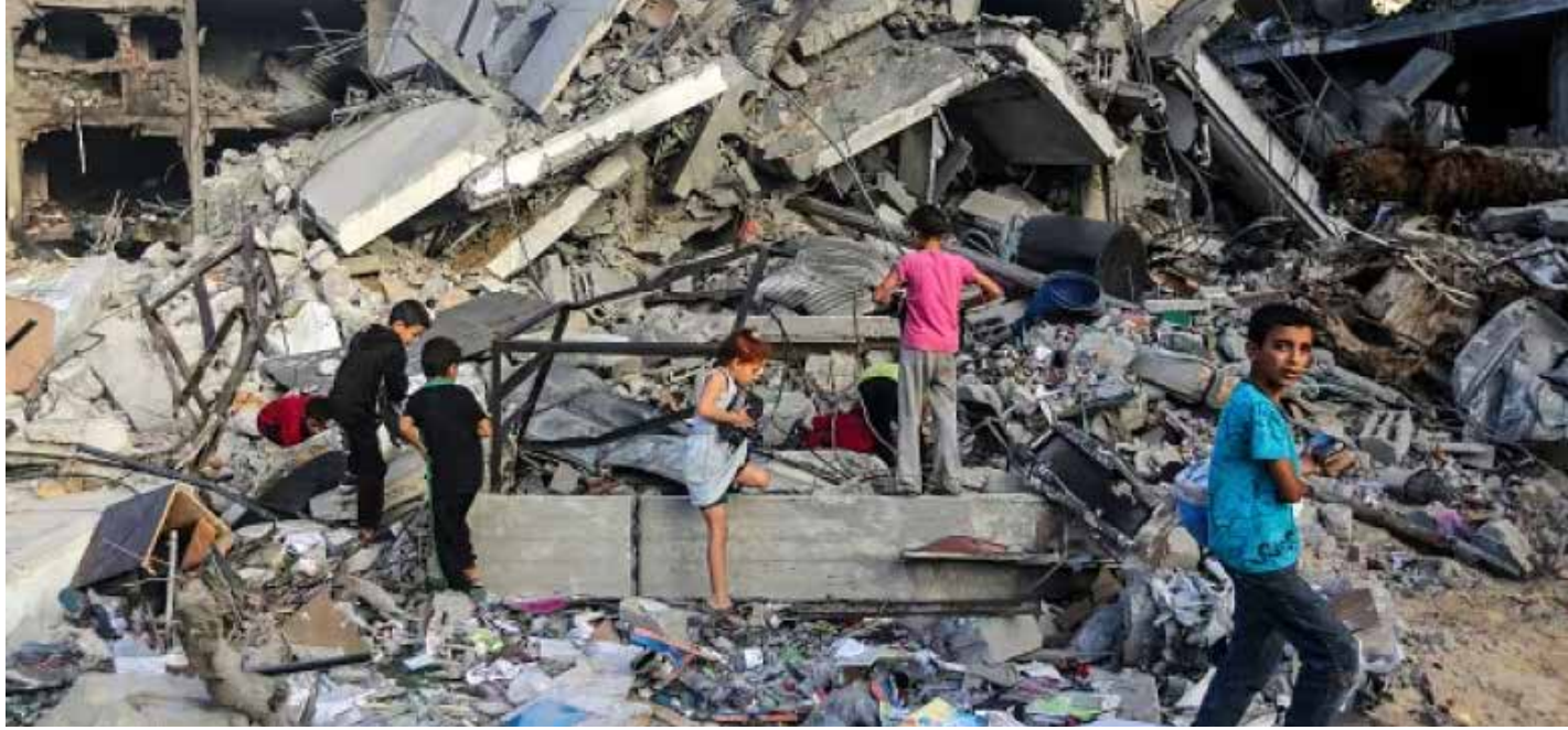
أطفال في ركام المباني التي دمرتها الغارات الجوية الصهيونية في خان يونس جنوب قطاع غزة أمس الأربعاء