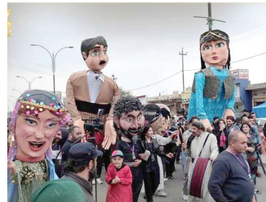
جانب من فعاليات افتتاح المهرجان

اختتمت الثلاثاء الماضي في مدينة كركوك، فعاليات المهرجان الدولي لمسرح الشارع بنسخته السابعة، والذي أقيم برعاية وزارة الثقافة والشباب في حكومة كردستان. وشاركت في المهرجان الذي استمر ثلاثة أيام، 24 فرقة مسرحية من كردستان وبقية محافظات الوطن، إلى جانب سورية والجزائر وتونس والمغرب وإيران وإيطاليا. وانطلق المهرجان بفعاليات فنية متنوعة نظمت في الهواء الطلق، وبدأت من «شارع الخيام» قرب قلعة كركوك الأثرية، بحضور الوفود المشاركة وجمع كبير من المواطنين. بعدها توجه الجميع إلى المركز الثقافي وسط المدينة، وهناك أقيمت كلمة باسم اللجنة العليا للمهرجان ومدير ثقافة وفنون كركوك. ثم انطلقت فقرات غنائية وموسيقية ودبكة شعبية، لتعرض بعدها المسرحيات تباعاً على مدى أيام المهرجان، وتتوزع بين المركز الثقافي و«جامعة الكتاب». وعلى هامشه، شهد المهرجان ندوات نقدية حول المسرحيات التي قدمت. كما جرى تكريم عدد من الرموز الفنية ذات الحضور المتميز في المشهد المسرحي العراقي.