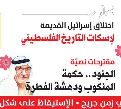
مقترحات نصية الجنود.. حكمة المنكوب ودهشة الفطرة