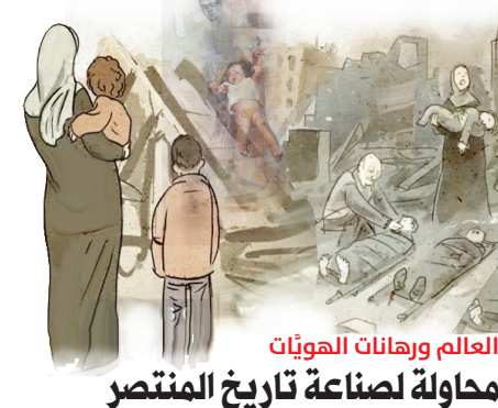
العالم ورهانات الهويات محاولة لصناعة تاريخ المنتصر