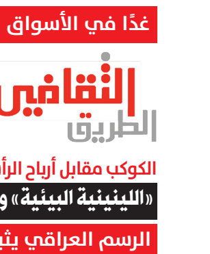
عذًا في الأسواق العدد 131 من جريدة النقابي الطريق

الرسم العراقي يثير طمع المزورين • عندما تنمو الشتلات الحقيقة الإنسانية • تأملات في زمن جريح • الإستيقاظ على شكل فراشة • العيادات الحمراء..