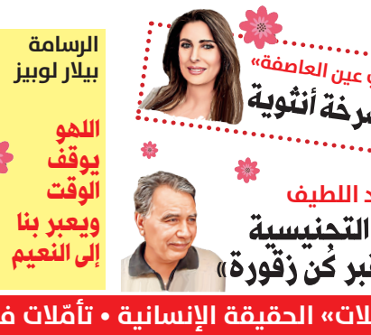
حسين عبد اللطيف العتبات التجنيسية «أيها القبر كن زقورة»