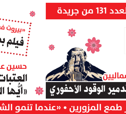
الكوكب مقابل أرباح الرأسماليين «اللييندية البيئية» وتدمير الوفود الأحموري