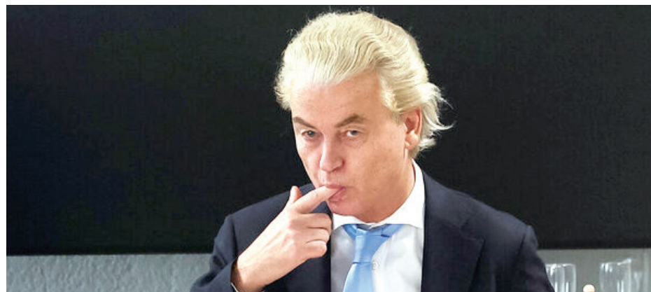
هل يستطيع فيلدرز تشكيل الحكومة الجديدة؟

الانتخابات البرلمانية العامة التي شهدتها هولندا الأحد الفائت، جاءت بمفاجأة حصول حزب "الحرية" اليميني المتطرف بزعامة العنصري خيرت فيلدرز بالموقع الأول، بعد حصوله على 37 مقعداً في البرلمان الجديد، وبزيادة قدرها 20 مقعداً عن الانتخابات العامة الأخيرة. وحل تحالف يسار الوسط لحزب "العمل" و"الخضر" بالموقع الثاني بحصوله على 25 مقعداً، وبزيادة قدرها 8 مقاعد. وكان الموقع الثالث من نصيب اليمين المحافظ الذي قاد الحكومة المنتهية ولايتها، والذي حصل على 24 مقعداً، بخسارة 10 مقاعد. وجاء رابعاً حزب "العقد الاجتماعي الجديد" اليميني بحصوله على 20 مقعداً. أما الحزب "الاشتراكي" الذي يمثل اليسار الجذري في البرلمان الهولندي فقد حصل على 5 مقاعد فقط، بخسارة 4 مقاعد، وبهذا تستمر سلسلة تراجع الحزب، الذي شكل في السنين السابقة علامة فارقة في الحياة السياسية للبلاد وحقق نتائج انتخابية جيدة. ومن أبرز الخاسرين أيضاً حزب "الديمقراطيين 66" اليميني الليبرالي، الذي حصل على 9 مقاعد بخسارة 10 مقعداً. وحصل حزب "المزارعين - المواطنين" على 7 مقاعد بزيادة 6 مقاعد. وحصلت مجموعة من الأحزاب على 1 - 3 مقاعد. وبلغت نسبة المشاركة في التصويت 77,8 في المائة.