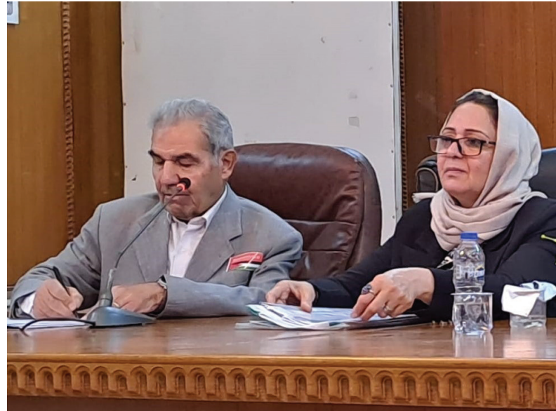
في «ملتقى رواد المتنبى»

وفي مستهل محاضرتها، ذكرت الضيفة أن «الأمم المتحدة أصدرت اتفاقية حقوق الطفل سنة 1989، وبعد التصديق عليها من قبل أكثر من 110 دول، أصبحت نافذة. فيما تحفظ عدد من الدول على بعض بنود الاتفاقية، بحجة مخالفتها الشريعة الإسلامية». وتابعت قولها أنه «بينما منعت اتفاقية حقوق الطفل الاعتداء على الأطفال أو الاتجار بهم أو استغلالهم، سمح البروتوكول الثالث الملحق