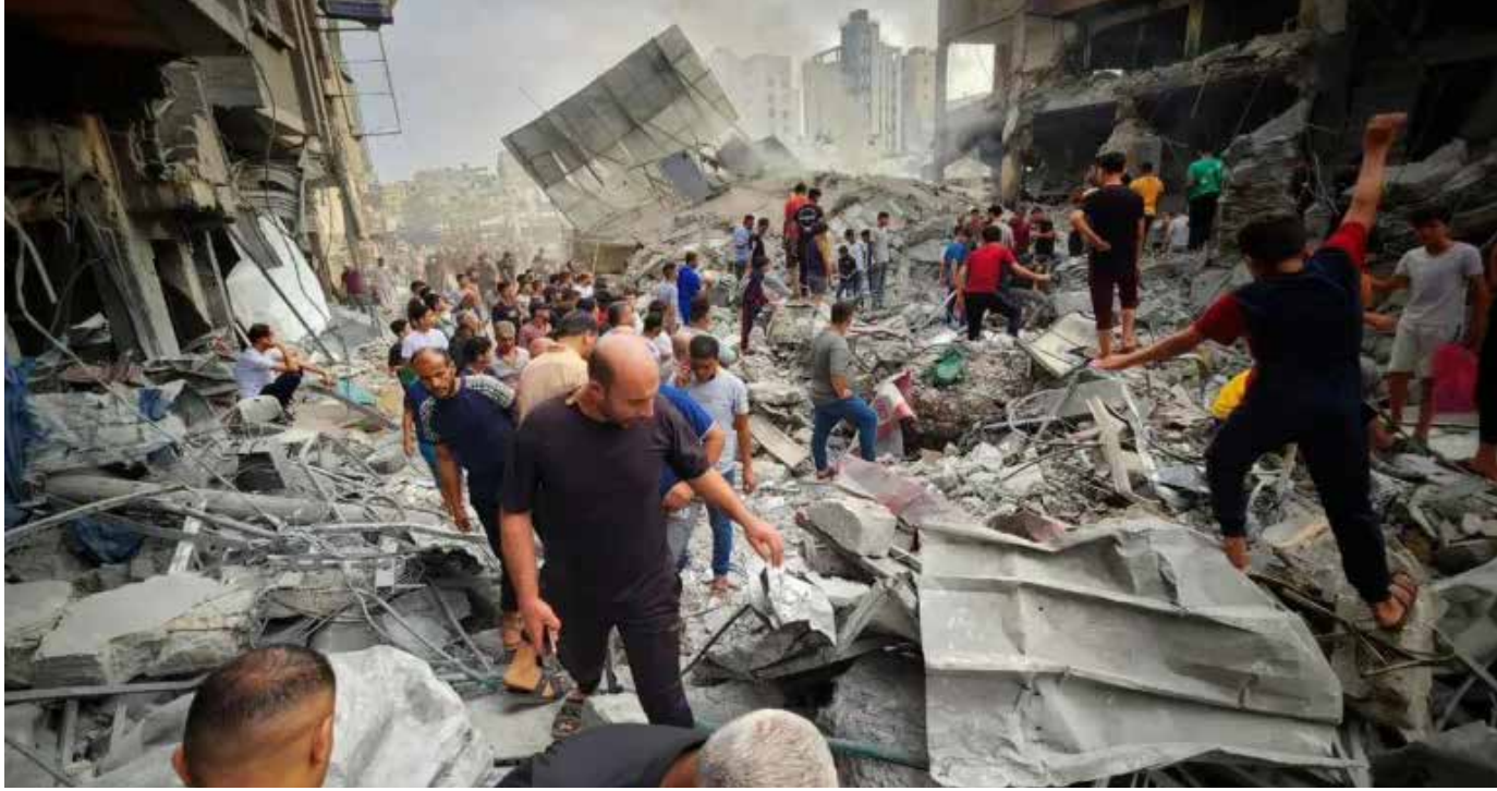
دمار خلفه قصف مبنى بلدية خان يونس القديمة بخان يونس

ووضع الخطط لاستكمال القتال من أجل تفكيك حركة المقاومة الإسلامية (حماس)، حسب تعبيره، مشيراً إلى أن الجيش لا يدافع فقط على الحدود مع شمال لبنان، بل يبادر إلى عمليات، وفق تقديره.