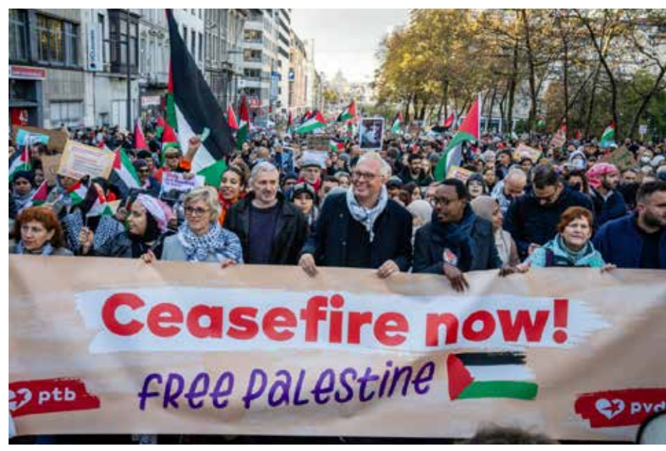
مسيرة تضامنية مع الشعب الفلسطيني في بروكسل

الموقف من الصراع في الشرق الأوسط الحكومة البلجيكية منقسمة حالياً بشأن هذه القضية. هناك قوى داخلها تطالب بوقف فوري لإطلاق النار. وأخيراً قررت الحكومة منح خمسة ملايين يورو للمحكمة الجنائية الدولية للتحقيق في جرائم الحرب، وهو أمر جيد. لكن الحزب الليبرالي في المناطق الناطقة بالفرنسية، ثاني أكبر حزب في الحكومة، يتخذ موقفاً مؤيداً للغاية لإسرائيل. كما أن أكبر حزب فلمنكي يؤيد بشكل علني وواضح إسرائيل داخل المعارضة. بلدان الجنوب والتضامن مع الفلسطينيين شهد العالم حالياً تحولا جديداً في الطريقة التي ينظر بها العالم إلى أوروبا والولايات المتحدة. وعندما نتجاوز وجهة النظر "المركزية الأوروبية"، نرى الجنوب العالمي يتحدث بصوت موحد دعماً لفلسطين. كما تتحد آسيا وإفريقيا وأمريكا الجنوبية ومنطقة البحر الكاريبي في إدانة نفاق أوروبا، التي تلقي المحاضرات على الجميع وتحاول أن تخبرهم كيف يصوتون على الحرب الروسية الأوكرانية، لكنها تسمح لإسرائيل بالإفلات من كل شيء. ولا يتعلق الأمر بإسرائيل وفلسطين فحسب، بل يتعلق أيضاً بالقانون الدولي وموقع أوروبا والولايات المتحدة في هذا النظام العالمي الذي يقرب من نهايته. ولهذا السبب فعلى كل قوة تقدمية في أوروبا أن تقف إلى جانب بلدان الجنوب في الدفاع عن سيادتها وحقوقها في مقاومة الإمبريالية. وهذا أمر مهم أيضاً بالنسبة للشعوب الأوروبية ذاتها. لأنه لن تكون هناك حرية للطبقة العاملة في أوروبا، وفي بلجيكا، ما دام الاتحاد الأوروبي مستمراً في الترويج للاستعمار وتصدير الأسلحة. ولهذا السبب جاءت الدعوة من الطبقة العاملة البلجيكية، من النقابات العمالية، قائلة لا نريد أن نتورط في الإبادة الجماعية.