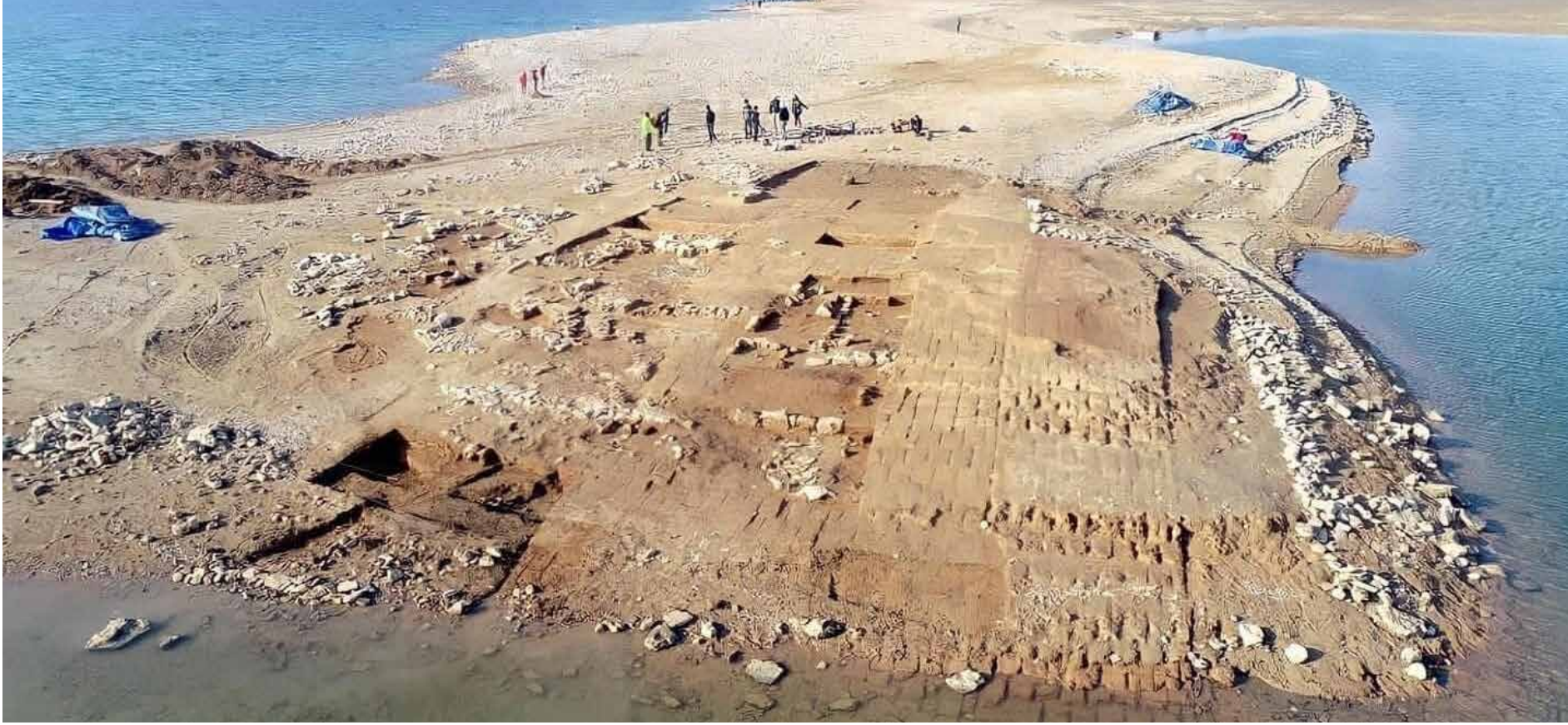
الجفاف في العراق يكشف عن كنوز وآثار تحت مياه النهرين

وأكد بأن الدول النامية لم تشهد سوى قدر ضئيل من العدالة حتى الآن في ما يتعلق بتحويل الطاقة، وإن الحاجة ماسة لتوفير رأس المال من أجل التشغيل الكامل لصندوق "الخسائر والأضرار" الذي تبناه مؤتمر شرم الشيخ في العام الماضي. وحسب على التكاتف الدولي ليكون مؤتمر الأطراف في دبي مؤتمر النتائج العملية واحتماء الجميع. أنه لطموح أممي مشروع التطلع نحو نتائج إيجابية جديدة للمؤتمر العالمي للمناخ في دبي في ظل ما يواجهه من تحديات ساخنة عديدة، تستلزم بالضرورة إيجاد حلول ومعالجات آنية وملحة وفاعلة، نقترب بتنفيذ الالتزامات الدولية، إذا ما أرادت الأطراف المعنية الحد حقا وفعلا من وطأة المشكلات المزمنة والمتفاقمة والخطيرة المتعلقة بالتغيرات المناخية وتداعياتها الاقتصادية-الإجتماعية والبيئية والصحية والأمنية، التي واجهتها المؤتمرات السابقة وأخفقت في تحقيق حتى أهمها وأكثرها إلحاحا. فهل سيكون COP 28 فرصة أخرى لإحداث نقلة نوعية لحلول ومعالجات مناخية وتهيوية عاجلة، تضع مصلحة الشعوب وتطلعاتها المشروعة بالحد عاجلا من الكوارث والأضرار الناجمة عن التغيرات المناخية، على رأس أولويات المفاوضات الجديدة؟ * أكاديمي متقاعد، متخصص بالصحة والبيئة