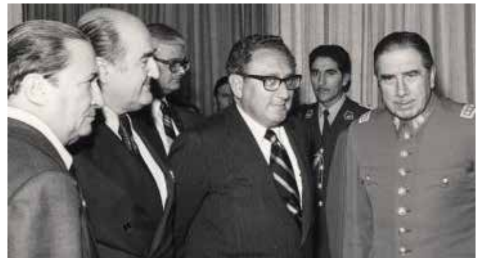
كيسنجر وبينوشيه في عام 1976

"خطة كوندور" أو "عملية كوندور" هو الاسم الذي أطلق على التعاون بين مختلف الأجهزة السرية في أمريكا الجنوبية والولايات المتحدة الأمريكية في السبعينات والثمانينات. وتحت شعار "مكافحة الشيوعية"، بين عامي 1970 و1990، تبادل تشيلي والأرجنتين والبرازيل وباراجواي وأوروغواي وبوليفيا وبعد ذلك