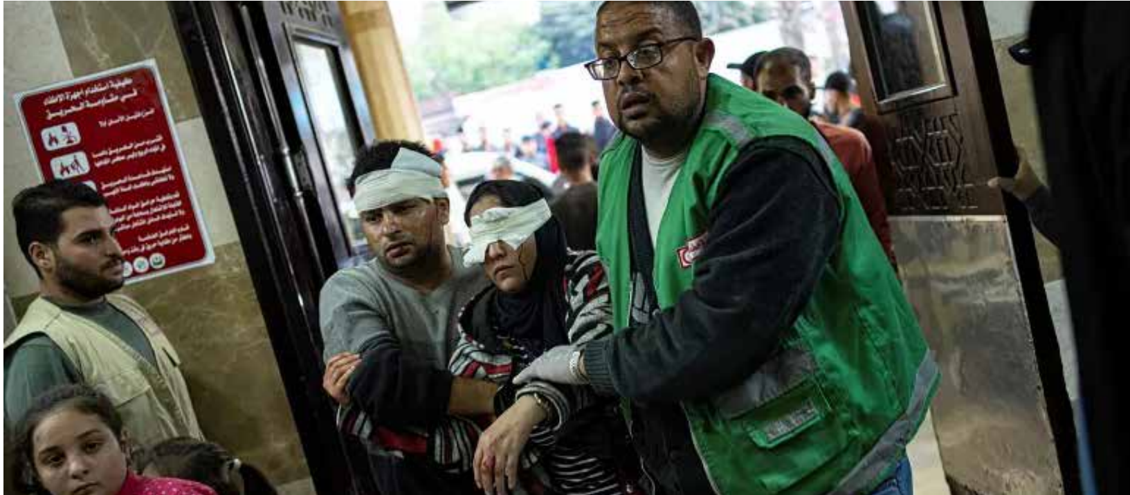
الاحتلال الاسرائيلي يواصل ضد الفلسطينيين في قطاع غزة

وحذر الحزب في بيان امس، تسلمته "طريق الشعب"، من مخاطر الممارسات التي يقوم بها جيش الاحتلال على الأرض في قطاع غزة، عبر الاستهداف المباشر للمدنيين والىابادة الجماعية لهم، مؤكداً أنها تهدف أساساً إلى ترويع وترهيب الشعب بالنار والدمار من أجل دفعه إلى مغادرة القطاع.