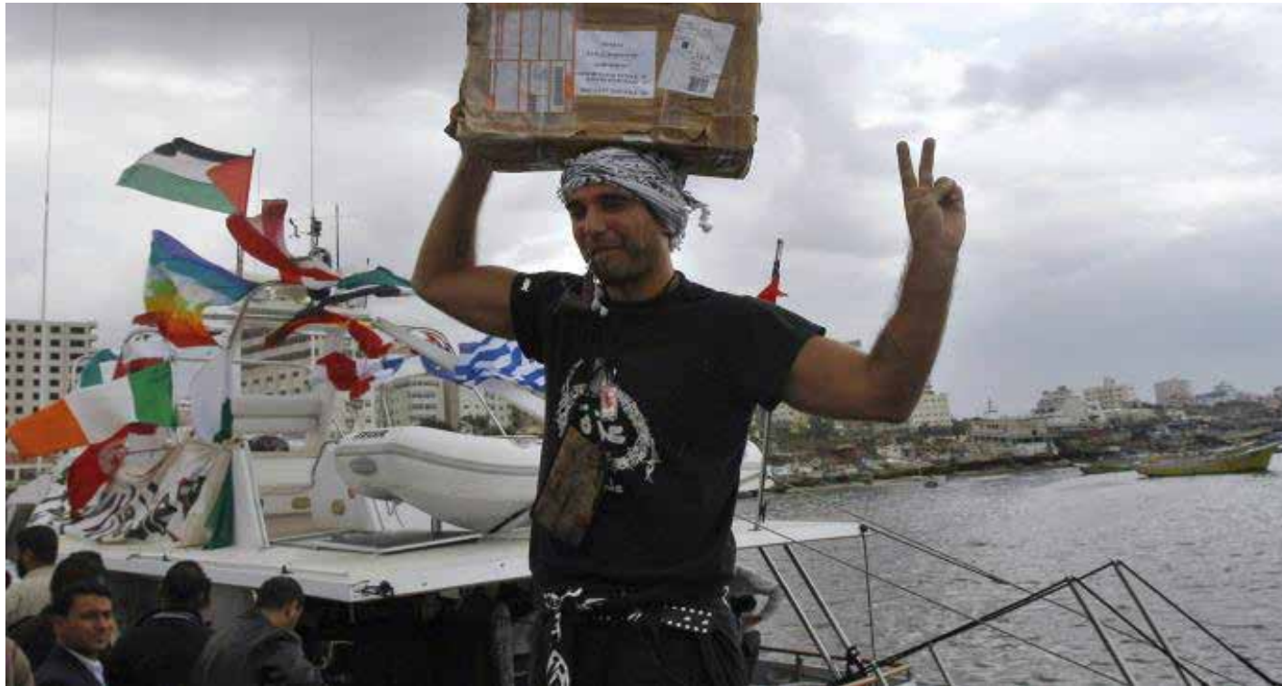
فيتوريو أريغوني يحمل طردا من الادوية نقلته سفينة الكرامة الى غزة

أن نعود، هذه الأيام، لنقرأ كتاب "غزة.. حافظوا على إنسانيتكم"، للصحافي والناشط الإيطالي الأممي فيتوريو أريغوني (1975 - 2011)، والذي صدرت ترجمته عن "المركز العربي للأبحاث ودراسة السياسات" عام 2012 (أنجزها مالك ونوس)، ففي هذا ضرب من التسلسل بالقيم النضالية العليا أمام الهجمة الصهيونية البربرية المستمرة منذ أكثر من شهر، وتذكير بأن القضية الفلسطينية تمثل حي لخبرات الكفاح الوطني، وإلا ما الذي يفسر وقوف ثلاثة بلدان لاتينية، اليوم، بشكل واضح مع الحق الفلسطيني، وقد قررت بالفعل أن تحافظ على إنسانيتها، فسحبت سفراءها من الكيان، في ظل تخاذل العرب، بل مشاركة بعضهم في الحصار، وإصرار آخرين منهم على المضي قدماً في نهج التطبيع؟ عمل أريغوني، منذ 2008، مع "حركة التضامن العالمية الداعمة للشعب الفلسطيني" (ISM)، حتى اغتياله فوق أرض غزة عام 2011 على يد مجموعة سلفية متشددة مشبوهة. ومن خلال مدونته "إذاعة حرب العصابات" (Guerrilla Radio) وصحيفة "إل مانيستو"، قدم هذه اليوميات التي يعرض فيها معايشته لحرب 2008 - 2009 التي استمرت ثلاثة أسابيع، وصدرت في كتاب بالإيطالية، قبل ترجمتها إلى عدد من اللغات، بتصدير المؤرخ إيلان بابيه.