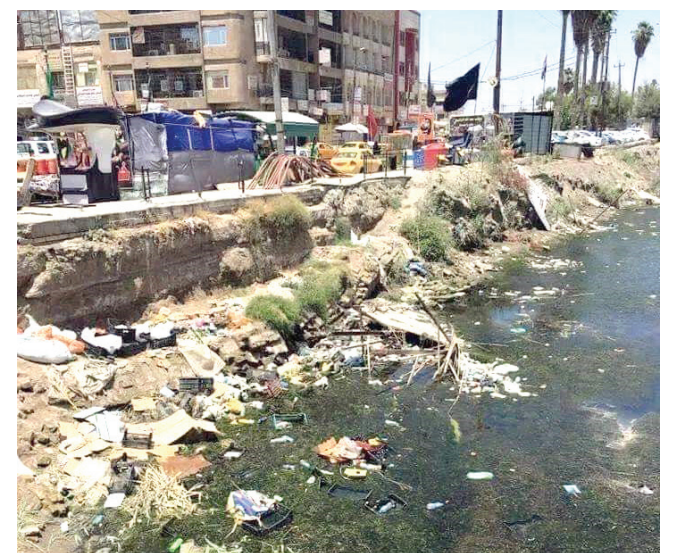
شط الحلة لم يعد شطاً!

هذا الجرف الباسل من شط الحلة - الظاهر في الصورة - محصور بين مقر بلدية الحلة و"حديقة النساء". وكان في القرن الماضي فردوساً لشباب الحلة. إذ كان الساحل مفروشا بالرمل النقي الناعم كمهد ومجال رائع للسباحة خلال الصيف بين الظهيرة والغروب. لم تكن نستطيع دخول "حديقة النساء" في ذلك الزمن، بسبب صرامة حراسها الذين يعاقبون بشدة من يقطع وردة من أغصان شتلاتها، او يقطف ثمرة من اشجارها البانعة المانحة.. كانت