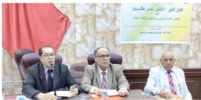
الضيوف الثلاثة على المنصة

بصوته وعلى عوده. وأشار الضيوف الثلاثة إلى أن الأغنية السبعينية من أرقى ما قدمه الفن الغنائي العراقي، لاقين إلى أن تلك الفترة كانت تشهد انفتاحاً وبناء وتطوراً في كل ميادين الحياة، الأمر الذي انعكس إيجاباً على الأداء الشعري واللحن والغنائي. وخلال الجلسة قدم العديد من الحاضرين مداخلات، وطرحوا أسئلة أجاب عنها الضيوف بإسهاب.