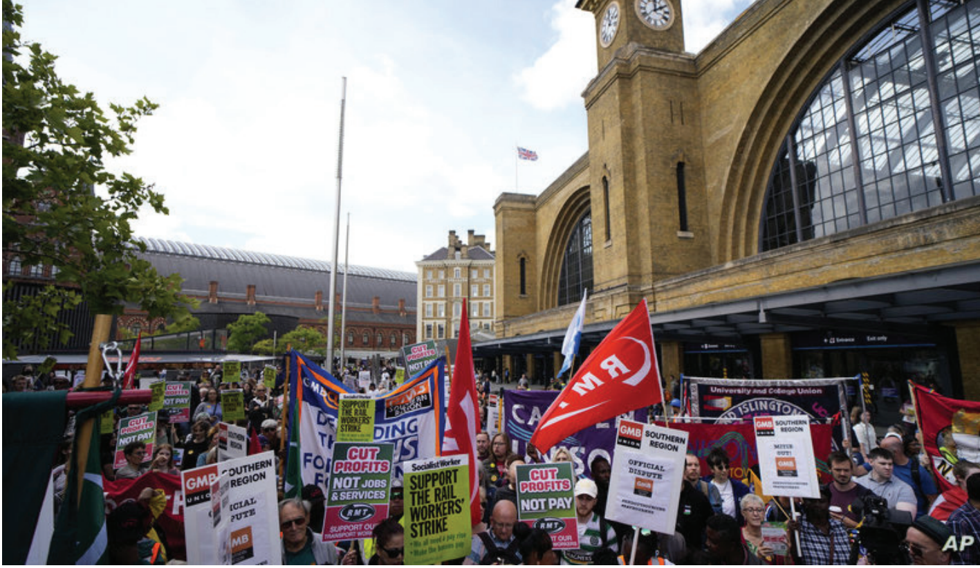
احتجاجات عمالية في روما ضد ارتفاع تكاليف المعيشة

ووفق رؤية الحزب الشيوعي الفرنسي بشأن الأحداث، فإن ما يحدث غير مسبوق. لقد أدى الهجوم المستمر على قانون التقاعد، باعتباره حجر الزاوية لنظام الرعاية الاجتماعية في فرنسا دائماً، إلى تظاهرات ضخمة. لكن هذه المرة كان الأمر غير عادي، والبلاد لا تواجه أزمة اجتماعية خطيرة فقط، بل تواجه الآن أزمة سياسية وديمقراطية أيضاً.