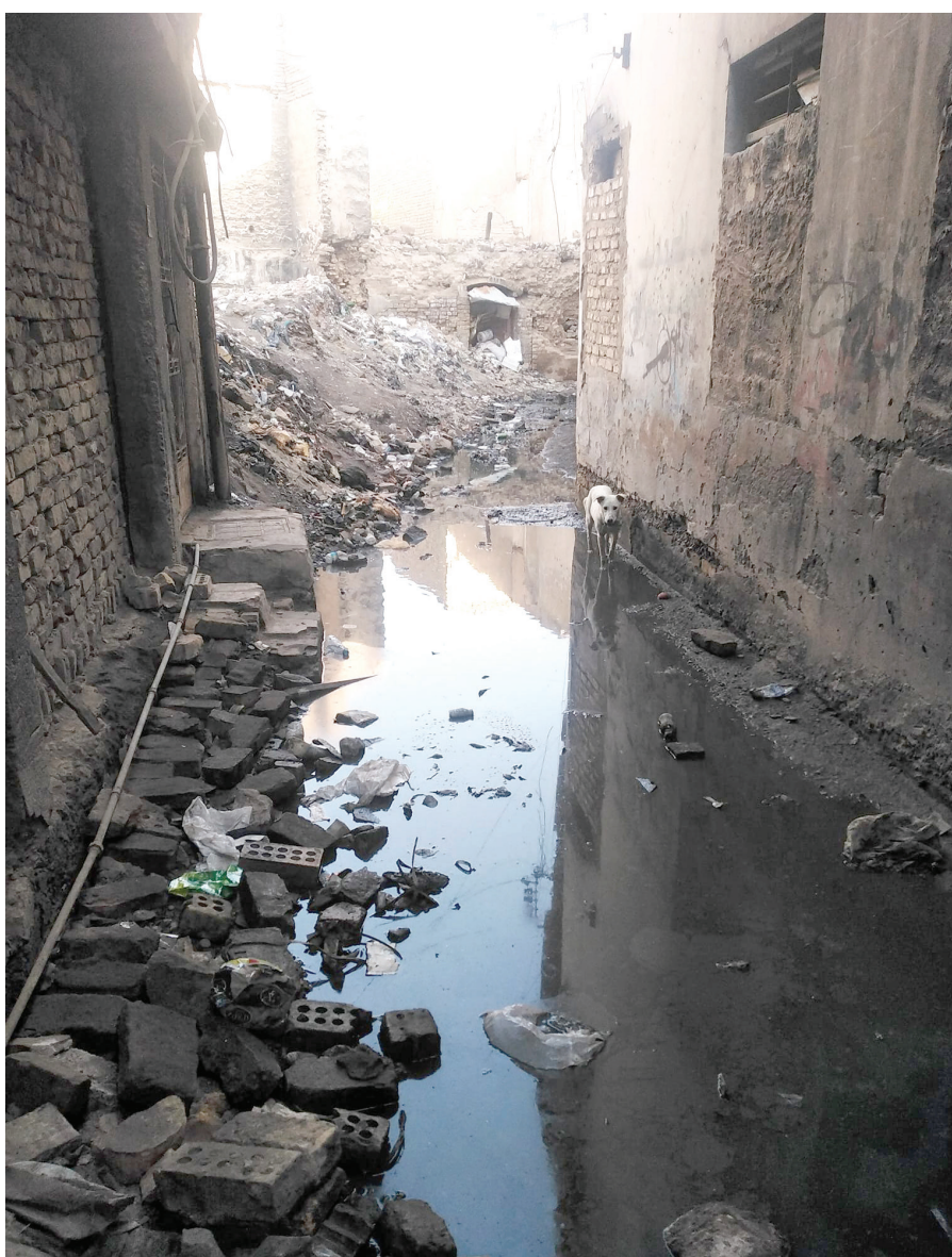
هذا ما انتهت إليه الالابالية والإهمال الذي لا يزال يطاول المناطق التراثية البغدادية. أزقة «الجدير خانة» مثال مؤلم جد!