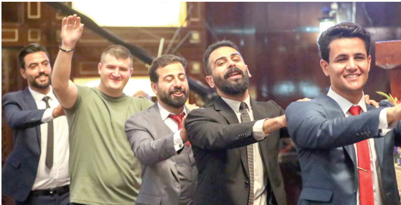
مشاركة واسعة للشباب في الاحتفال المركزي بذكرى التأسيس يوم 21 آذار الجاري

نوع من القداسة أم نوع من الزهو والفخر لمآثر حزبهم المجيد. نعم أيها الأصدقاء الشيوعيون لقد كنت صديقكم وقريباً منكم ومن أخلاقكم وتصرفاتكم ونزاهتكم وحكمكم لوطنكم، أقولها بملء الفم لكم الحق أن تعتبروا يوم ميلاد حزبكم أعز المناسبات فالحزب الذي أنتج هذه العينات من البشر يستحق الفخر والمجد والعلو. سنحتفل بعد أيام قليلة بالذكرى التاسعة والثمانين لميلاد حزبنا العظيم حزب الشهداء وحزب العمال والفلاحين وشغيلة اليد والفكر، حزب الأمل والعمل، حزب الكادحين الطيبين، حزب الشبيبة والطلبة والمرأة المناضلة