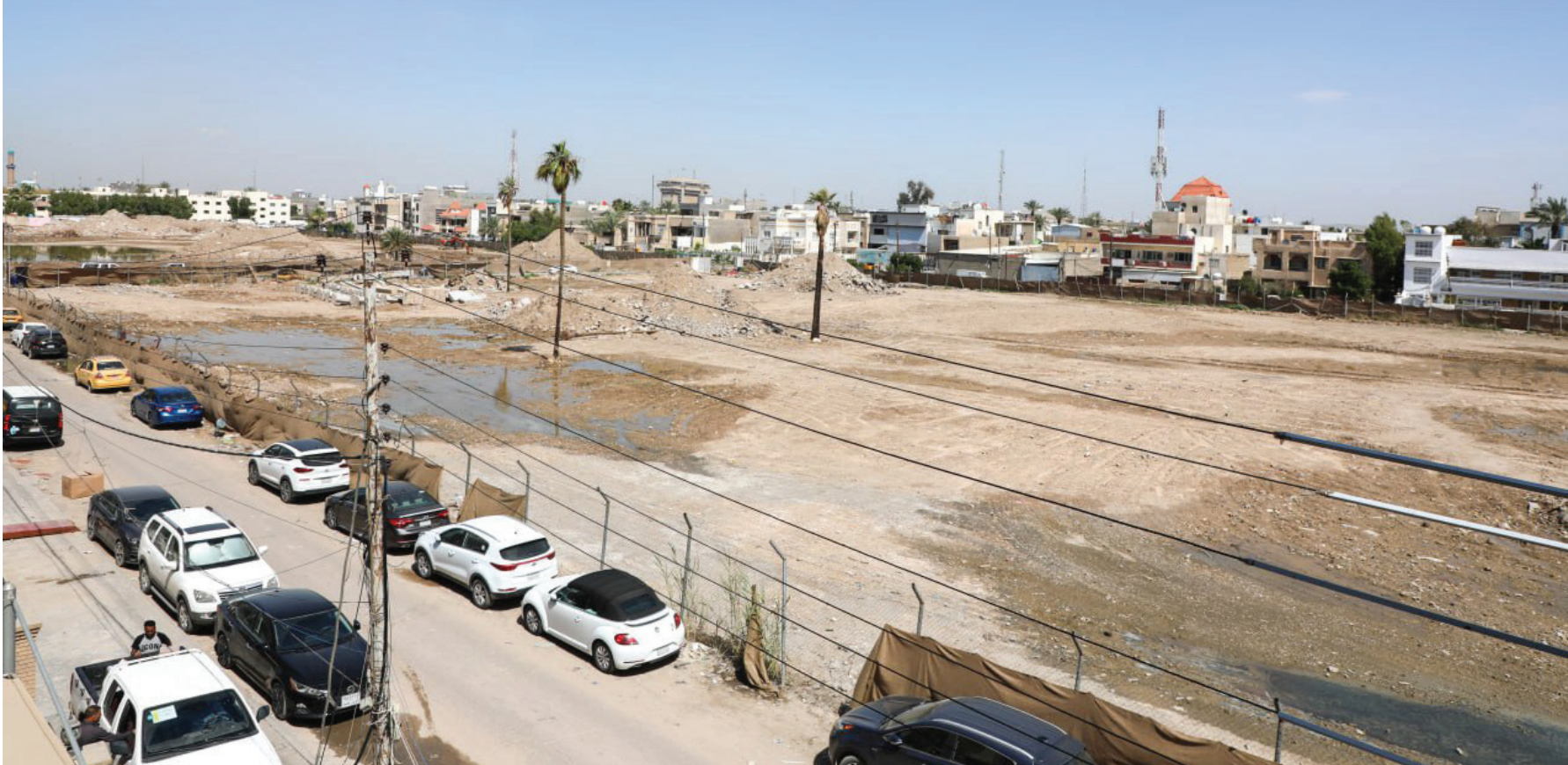
بغداد. طريق الشعب

حملت توقيع عدد من النواب تطالب الأمانة، بوقف إجراءات منح منطقة تعود لها إلى جهات استثمارية، لبناء مجمع تجاري ترفيهي وناج اجتماعي، بعد ورود مناشدات واسعة من المواطنين هناك. وحينها أوقفت أمانة بغداد السابقة ذكرى علوش، إجراءات منح هذه القطعة للاستثمار، وخلال تلك الفترة استمرت المطالبة، بأن تقوم أمانة بغداد بتنفيذ مشروع ترفيهي يكون متاحاً للجميع بصورة مجانية، وأن تتحول قطعة الأرض الواسعة إلى مساحة خضراء.