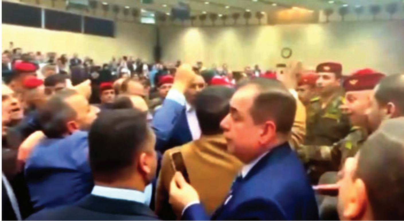
قوة حماية مجلس النواب تدفع النواب المعارضين إلى خارج القاعة

ولم تمر الجلسة من دون ردود فعل حول ما جرى، فقد وصل مدونون على مواقع التواصل الاجتماعي الأمر