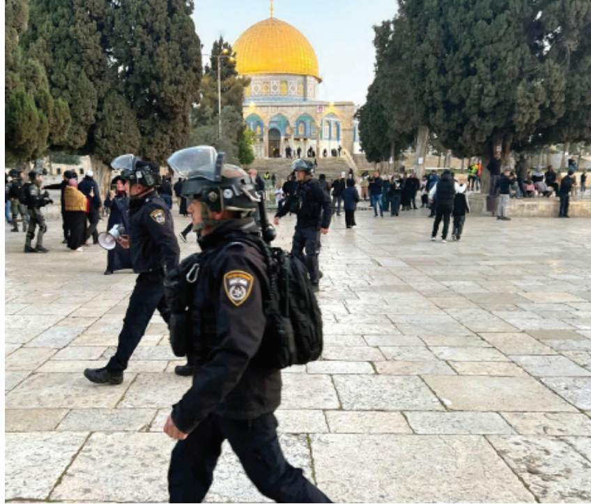
جنود الاحتلال الاسرائيلي في المسجد الاقصى

ورداً على الغارات الإسرائيلية التي استهدفت مناطق عدة بقطاع غزة أطلقت الفصائل الفلسطينية عشرات الصواريخ على مستوطنات غلاف غزة، من بينها دفعة جديدة تم إطلاقها أمس الأول باتجاه إسرائيل، ولم تنجح القبة الحديدية في اعتراض هذه الصواريخ بشكل كامل. وقال الجيش الإسرائيلي، إن القبة الحديدية اعترضت 29 صاروخاً من جملة 44 صاروخاً أطلقت من غزة. وكانت إسرائيل قد دعت مستوطناتها بغلاف غزة