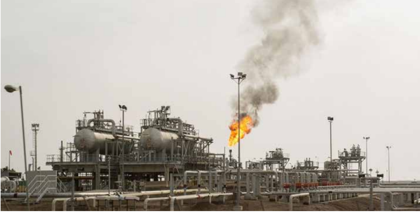
حقل مجنون النفطي في البصرة

الحدودية، ستساهم بانتاج 750 مليون قدم مكعب قياسي من الغاز، تليها جولة مكتملة سيعلن من خلالها عن تراكيب هيدروكربونية (غاز في باطن الأرض).