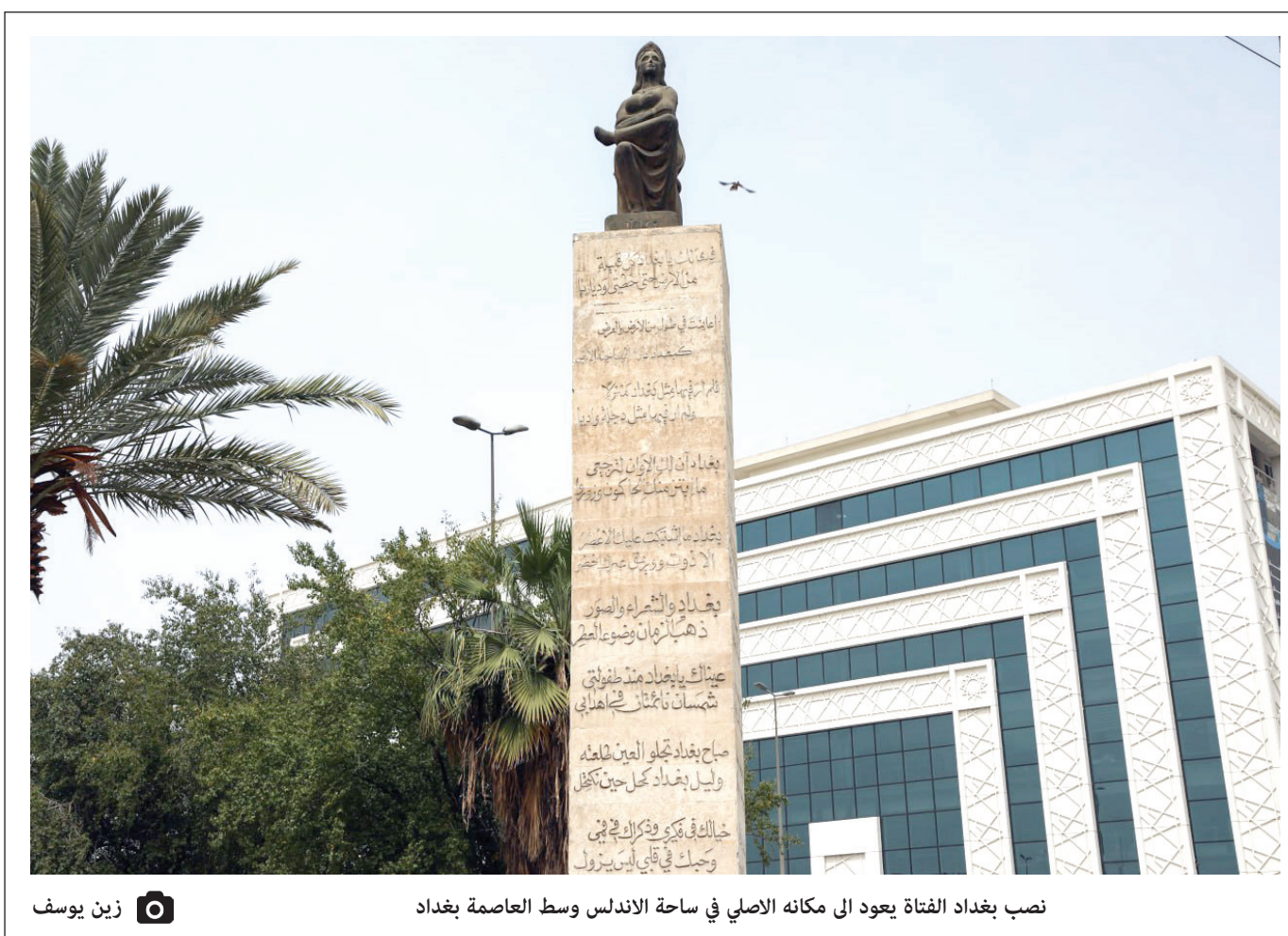
نصب بغداد الفتاة يعود الى مكانه الاصلي في ساحة الاندلس وسط العاصمة بغداد