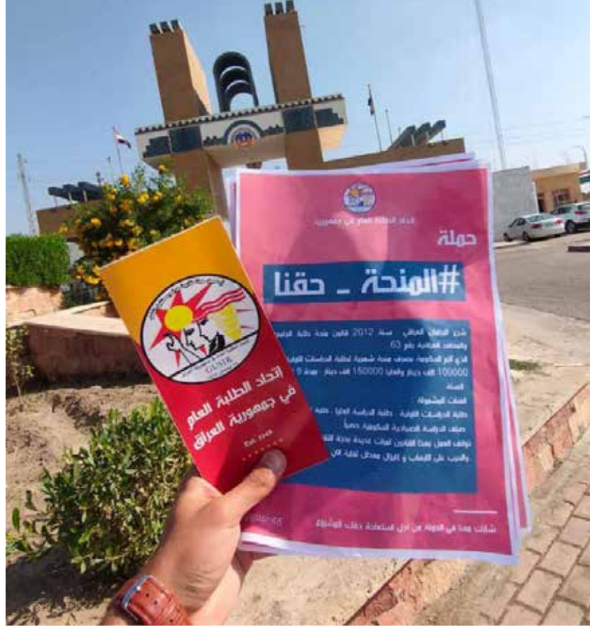
جانب من حملة "المنحة حقنا" التي اطلقها الاتحاد في بداية العام الدراسي الحالي

وفي انفضاض تشرين الاول عام 2019 الباسلة كانت الشريحة الطلابية السباقة في المشاركة الفاعلة في التظاهرات الجماهيرية التي انطلقت بمشاركة مختلف شرائح ومكونات المجتمع العراقي والتي كانت تهدف بشكل عام إلى اصلاح النظام السياسي وتغيير المنظومة السياسية الفاسدة، ولكنها في الجانب الآخر كانت تمثل مطالب اجتماعية ومهنية وحتى سياسية للشريحة التي تمثلها، إضافة إلى أنها شريحة الشباب المنتفض التي تتكون من قطاع واسع من الطلبة في المؤسسات التعليمية (كليات) - معاهد - اعداديات ..الخ) وقد أعلنت هذه الشريحة الطلابية عن تضامنها التام ودعمها الكامل لمطالب المنتفضين ولم يهابوا العنف الدموي والقمع الوحشي المفرط الذي تم استخدامه من قبل جهات معروفة، بل واصلوا احتجاجاتهم وتظاهراتهم وحققوا انتجازات كبيرة.