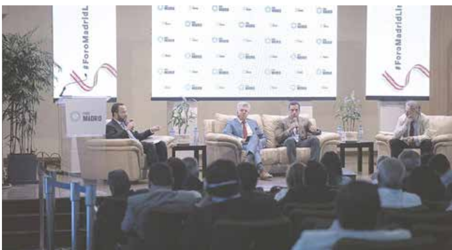
جانب من جلسات «منتدى مدريد»

حضر المنتدى رموز اليمين المحلي مثل: عمدة ليما، رافائيل لوبيز ألياجا، نائب الديكتاتور السابق ألبرتو