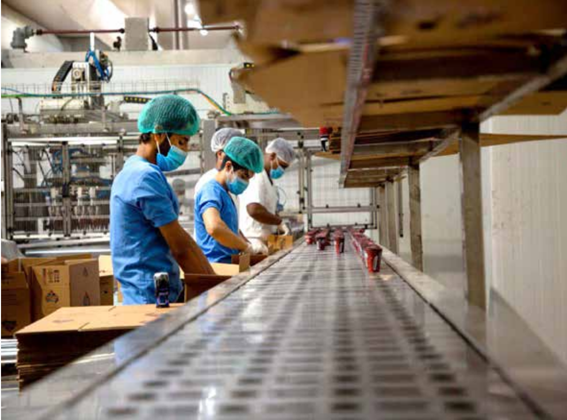
بغداد. طريق الشعب

التعامل مع القطاع الخاص، ورسم المساحة المناسبة لعمل هذا القطاع، ضمن مساحة المؤسسات الاقتصادية التجارية والانتاجية. وقال ان هذا المسح سيمنح الوزارة "من رسم صورة لهذه المؤسسات ودورها التنموي والاقتصادي، وهذه الصورة ستساعدنا في رسم السياسات ووضع خطط التنمية لتطوير هذه المؤسسات وزيادة فاعليتها، وبالنتيجة تحقيق التنمية الاقتصادية".