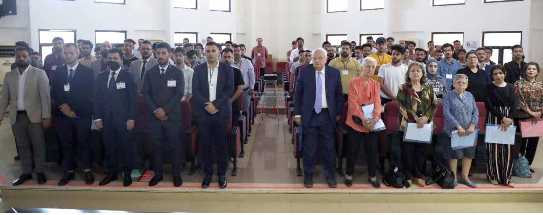
جانب من المؤتمر الثاني عشر لاتحاد الطلبة العام في جمهورية العراق المنعقد في نيسان 2022

بدأ منذ عام 2017 حين اعتمد التعليم الموازي. في ضوء ما تقدم، فإن على الاتحادات الطلابية المنتهكة من الحاجة الموضوعية والمدافعة حقاً قولاً وفعلًا عن حقوق الطلبة تطوير أساليب عملها لمواكبة العصر الحالي ومراجعة آلياتها التنظيمية وفق متطلبات المرحلة الحالية. ونتمنى بالقول إن العمل الطلابي متحرك غير ثابت ومن الممكن أن تمر الحركة الطلابية بمراحل من الفتنور خاصة بعد الأحداث العاصفة التي مر بها العراق، وهنا على كل العاملين في الاتحادات والمدافعين عن الحقوق المشروعة للطلبة أن لا يصيهم اليأس، فإن مواصلة العمل وحمل راية الكفاح المهني الديمقراطي وشعلة الوطنية لا يقدر عليها إلا من وهب نفسه دفاعاً عن هذا البلد، أما ما يظهر بهرجة زائفة فإنها زائلة مع مرور الزمن.