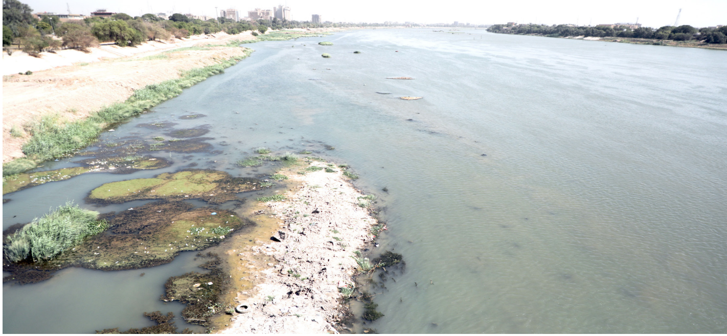
نهر دجلة قرب مدينة الطب في بغداد

ويتابع حديثه عن شبكات الصرف الصحي، قائلا ان "العديد من شبكات الصرف الصحي للمناطق ترتبط بمجاري الأرصفة وشبكات مياه الامطار، وبدورها تضح بشكل مباشر الى نهري دجلة والفرات، وهذه الالية متبعة في العاصمة وعموم المحافظات". والحكومات المتعاقبة يبدو انها غير قادرة على وضع رادع للحد من تزايد العشوائيات، بحسب ما بين، ملوحا بوجود بعض المنتهزين والمسؤولين الداعمين لهذا الفعل.