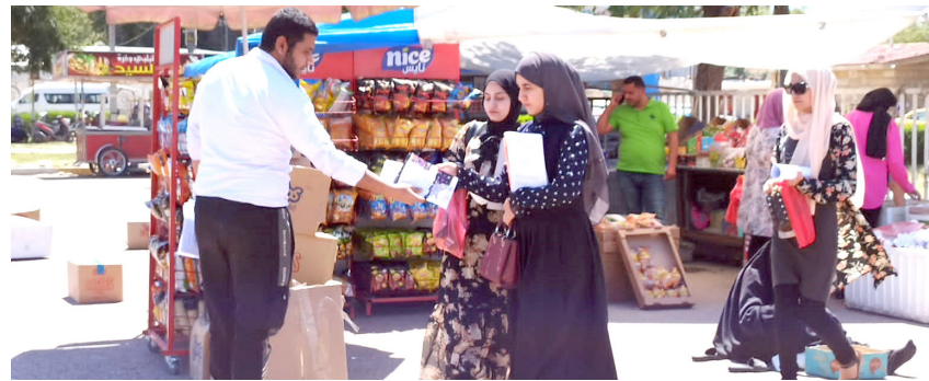
اعضاء اتحاد الطلبة العام يوزعون بيان ذكرى تأسيس اتحادهم في جامعة بغداد