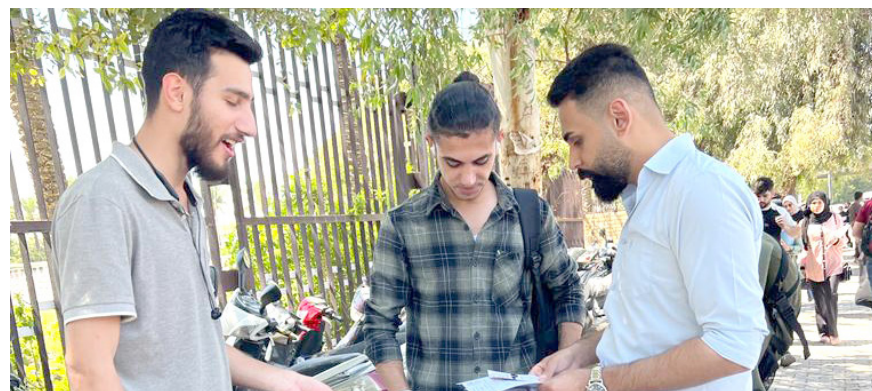
توزيع البيان في الجامعة المستنصرية