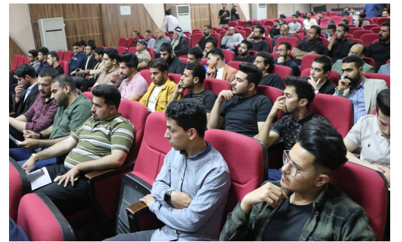
جانب من حفل ذكرى التأسيس في النجف