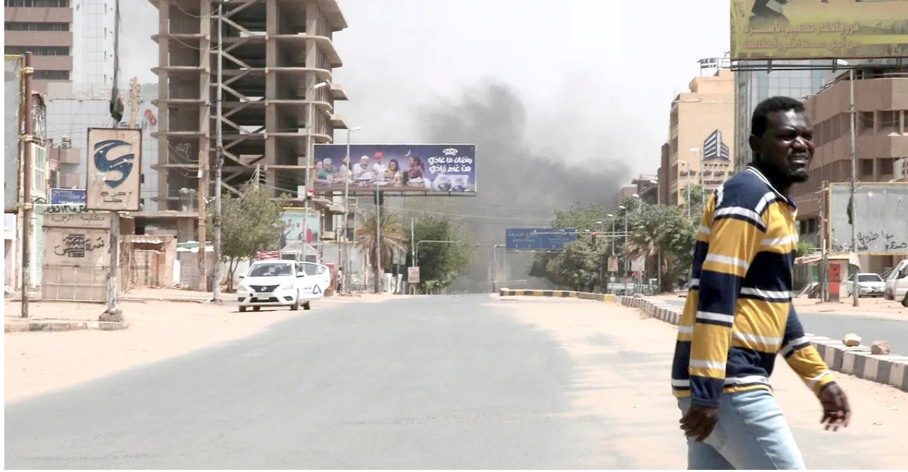
القتال مستمر في شوارع الخرطوم

بعيداً عن التدخلات الدولية". ودعا وزيرا الخارجية الأمريكي والبريطاني إلى "وقف فوري" للعنف في السودان حيث خلفت اشتباكات بين الجيش وقوات الدعم السريع 97 قتيلاً. كما دعت وزارة الخارجية الألمانية إلى وقف تصعيد الصراع.