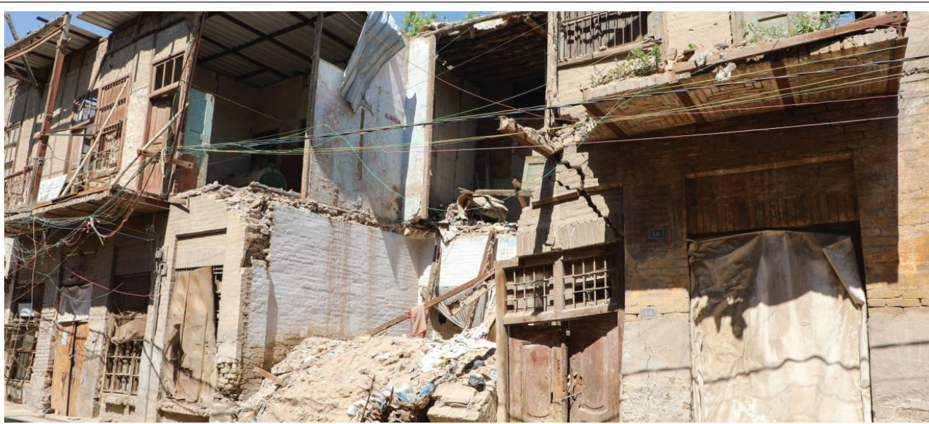
البيوت البغدادية التراثية في البتاوين تنهار.. من ينقذها؟ زين يوسف

وبالعودة الى النائب عنوز، فان هذه المعطيات مهمة ومن الضروري معرفتها ولكن للأسف أصبحت هناك عادة تشريعية مسؤولة عنها كل الكتل السياسية والنيابية التي لم تلتزم بهذا الشرط الدستوري، حيث لا