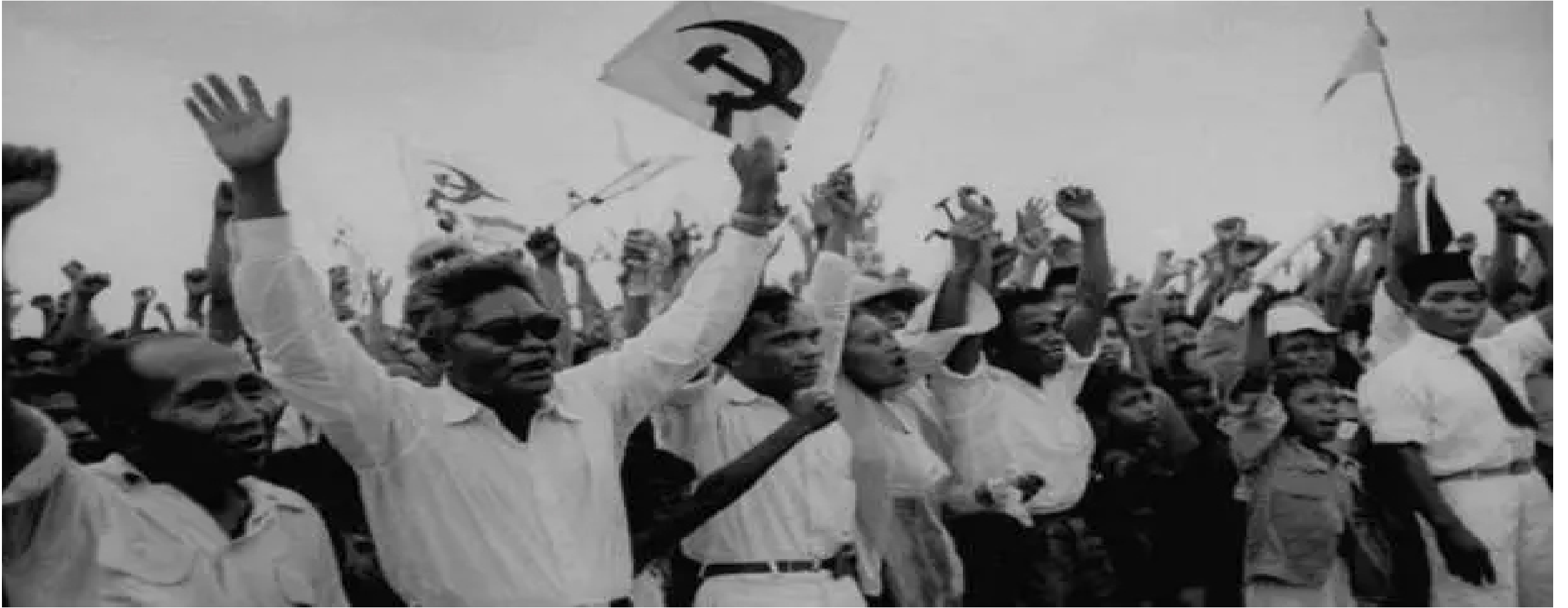
حشود في مسيرة انتخابية للحزب الشيوعي الإندونيسي 1955