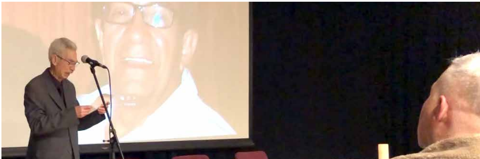
الرفيق ستار الريحاني يقرأ رسالة مواصلة المكتب السياسي للحزب الشيوعي العراقي