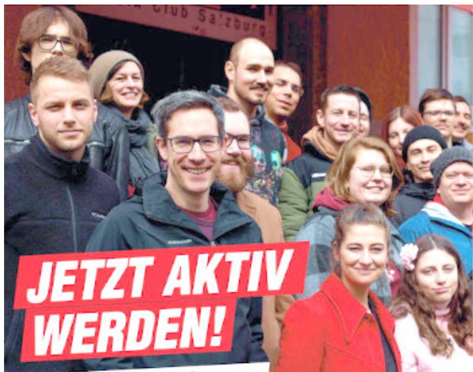
ملصق انتخابي للمرشحي القائمة

لصندوق طوارئ المواطنين. وكذلك عدم التصويت لأي مشروع يعارض مع مصالح السكان، ويستهدف خصخصة عقارات الدولة. والنقطة الثالثة برفض النواب لمشاريع قيد المناقشة لبيع عقارات عامة في المدينة. إن الشيوعيين في سالزبورغ وظفوا عمليا تجربة رفاقهم الناجحة والمستمرة، منذ عدة دورات انتخابية في بلدية مدينة غراتس.