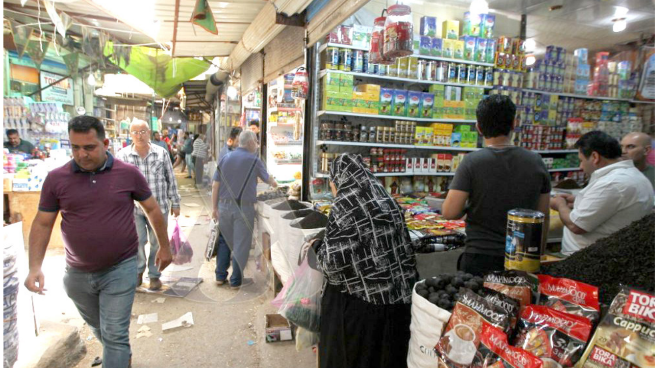
بغداد. طريق الشعب