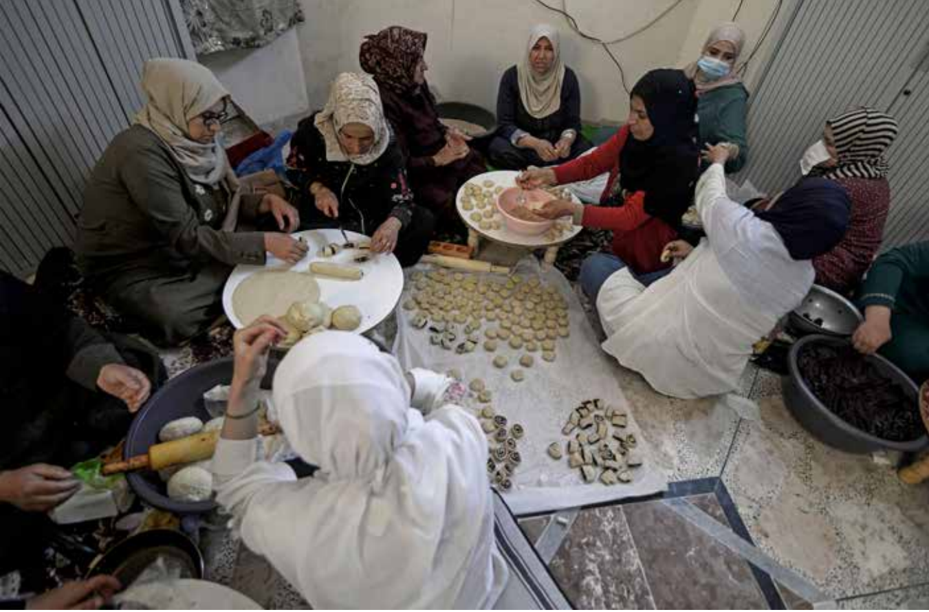
«الكليجة» حلوى العيد المحببة لدى العراقيين

يؤكد تجار ان ارتفاع الأسعار ليس بأيديهم، وانهم يواجهون مشكلات كبيرة تتعلق بانخفاض القدرة الشرائية لدى المواطنين، موضحين ان بضائعهم بقيت في المخازن بسبب قلة الإقبال على شراؤها.