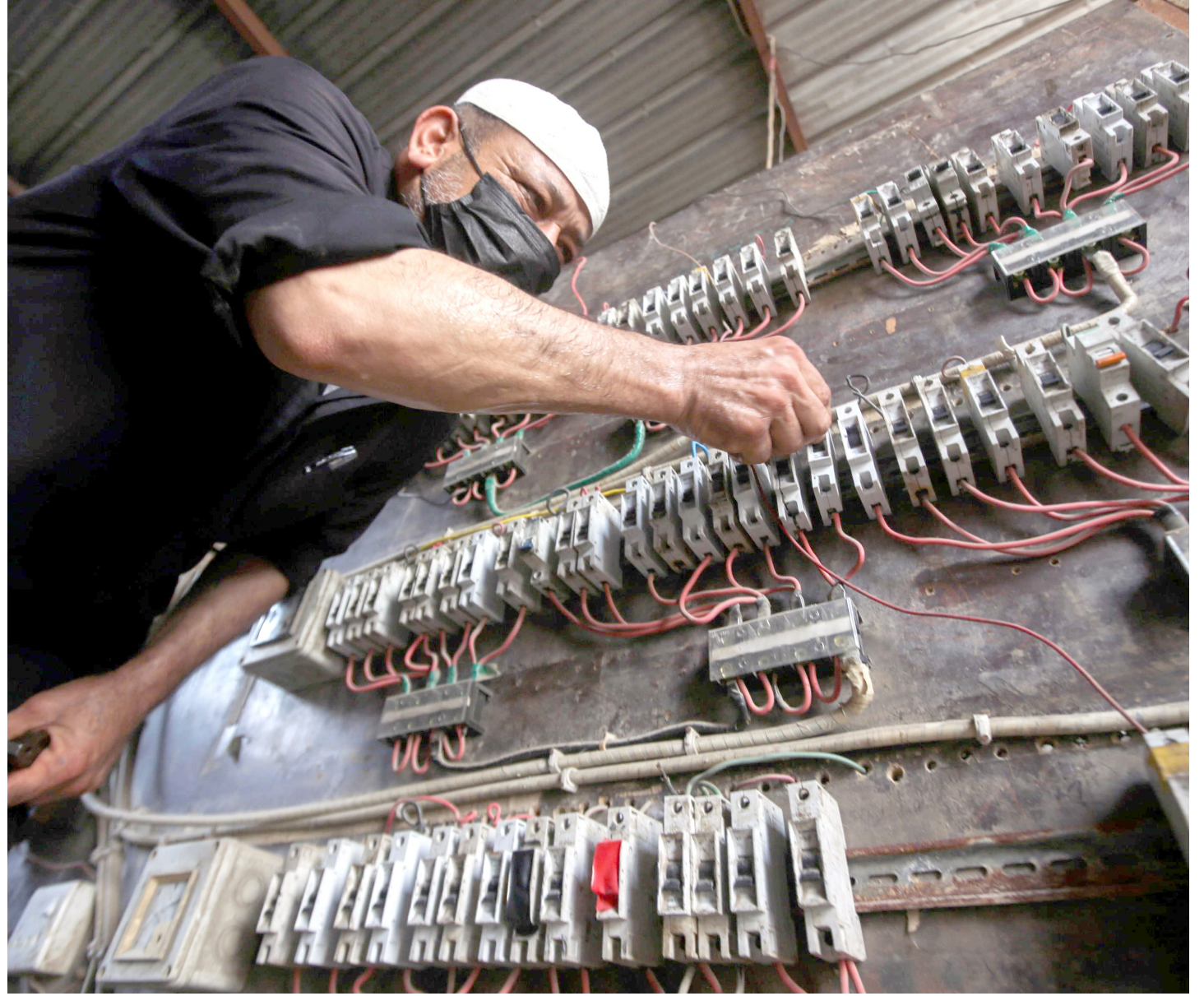
بغداد. طريق الشعب

يشكو مواطنون كثيراً من عملية انقطاع التيار الكهربائي مع بداية كل شهر، بالتزامن مع مواعيد تسديد أجور المولدات الأهلية، الأمر الذي يجعل المستهلكين يشككون في وجود توافق بين مديريات توزيع الكهرباء وبين أصحاب تلك المولدات، من أجل إجبار الأهالي على دفع أجور الاشتراك، برغم استقرار الكهرباء في فصلي الربيع والخريف.