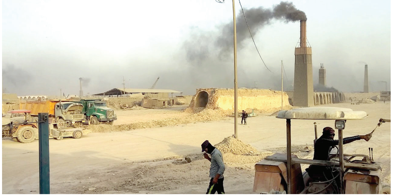
معمل الطابوق.. المداخن تنفث "السم الأسود" في أجواء بغداد