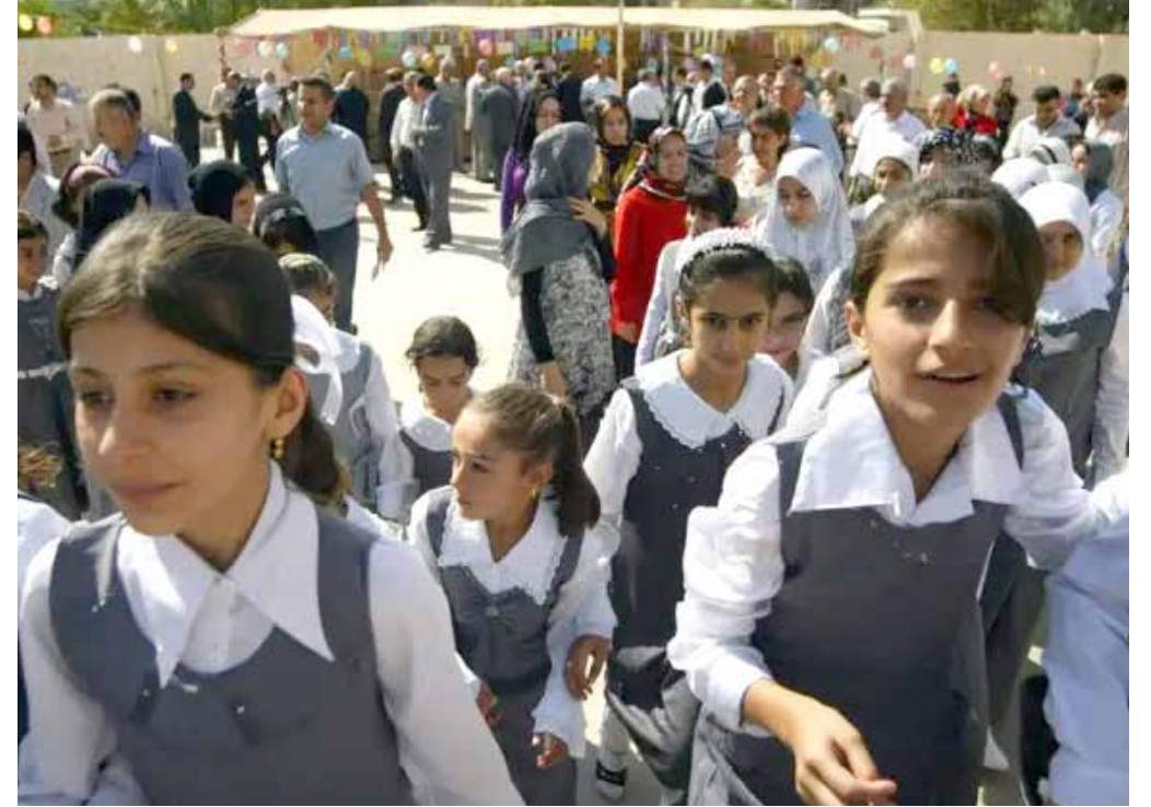
بغداد - طريق الشعب

بنسبة ٢٣ في المائة ثم البصرة ٢١ في المائة، وفي دفع الرشوة كانت القادسية هي الأعلى أيضا بنسبة بلغت ١٠ في المائة تلتها تريبنا البصرة وكركوك بنسب ٦ في المائة و٤ في المائة على التوالي. فيما سجلت مديرية تربية المثنى أقل نسبة في تعاطي ودفع الرشوة وبلغت ٦ في المائة و١ في المائة تواليها، وهذا بحسب الإحصائيات التي ذكرتها هيئة النزاهة في بيان صدر عنها يوم ٣١ آذار الماضي، والتي اشارت الى استبعاد نتائج مديرية تربية الأنبار، لوجود خلل في منهجية البحث في اختيار العينة المستهدفة وقلة عددها.