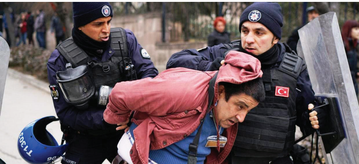
الشرطة تدهم احتجاجات عفوية ضد الاعتقالات الجماعية في ديار بكر، 25 نيسان 2023

بدوره، قال وزير الداخلية بسام مولوي، إن الأجهزة الأمنية سوف تتخذ التدابير الضرورية أمام مخيمات النازحين، مضيفاً: "نؤكد على حقوق الانسان ومن الواجب احترام القانون اللبناني وحفظ النظام، وأن يكون السوريون في لبنان خاضعين للقانون اللبناني، ويجب تسجيلهم وتنظيم وضعهم لأن الفلتان مضر بلبنان ومصالحهم". وشدد على "أننا لن نسمح بالتحريض على الجيش اللبناني وعلى الدولة، وعلى النازح السوري أن يلتزم بالقانون". بدوره، قال وزير الداخلية اللبناني الأسبق مروان شربل: "بلدنا مفلس ولم يعد باستطاعتنا التحمل اقتصادياً واجتماعياً، اللبناني غير قادر على إيجاد عمل وهذا الأمر يخلق حساسية بين السوري الذي يتلقى أموالاً من المنظمات الخارجية والبناني الذي يعيش في لبنان من دون مأك ولا مشرب".