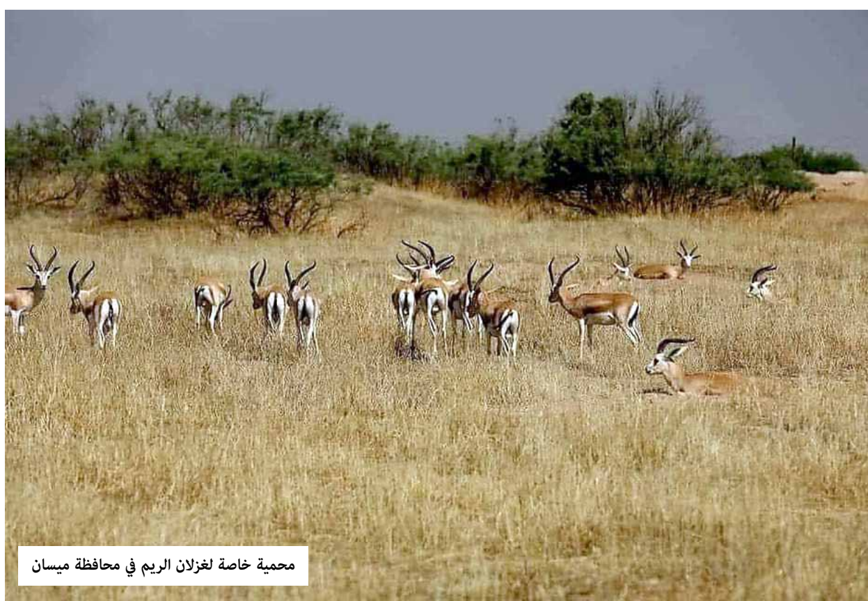
محمية خاصة لغزلان الريم في محافظة ميسان

وإن كانت الحكومة ومؤسساتها جادة في معالجة الامر فلتجد حولا أخرى.