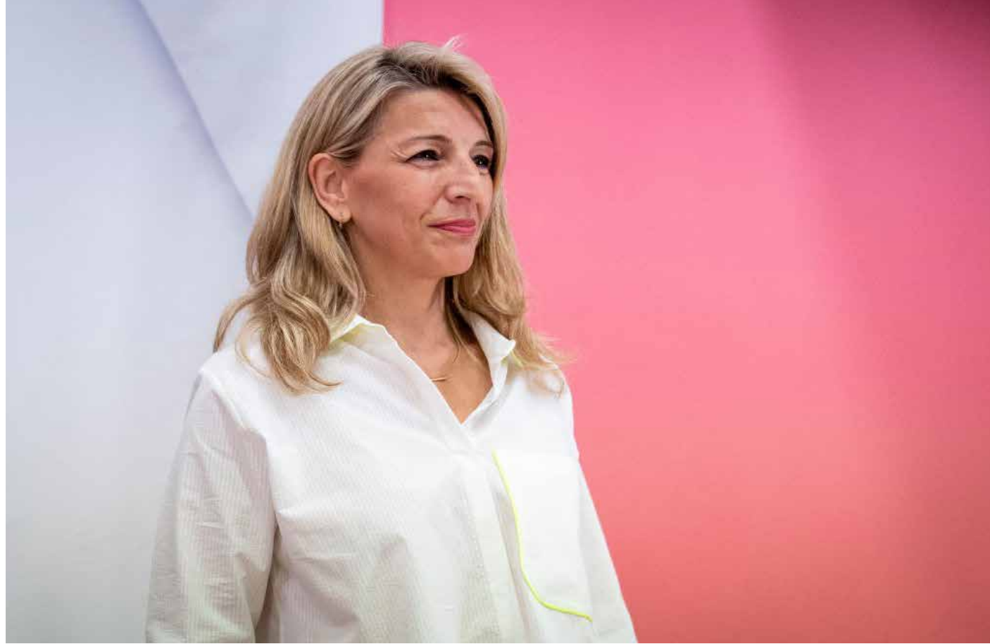
يولاندا دياز اثناء اعلان ترشحها

لقد حضر حفل اعلان الترشيح خمسة عشر حزبا سياسيا، فضلا عن قادة من حزب اليسار الأوروبي وحزب الخضر الأوروبي. ويستند توحيد هذا الطيف السياسي الواسع على برنامج سومار السياسي، الذي يركز على مشروع دولة جديدة. وهناك العديد