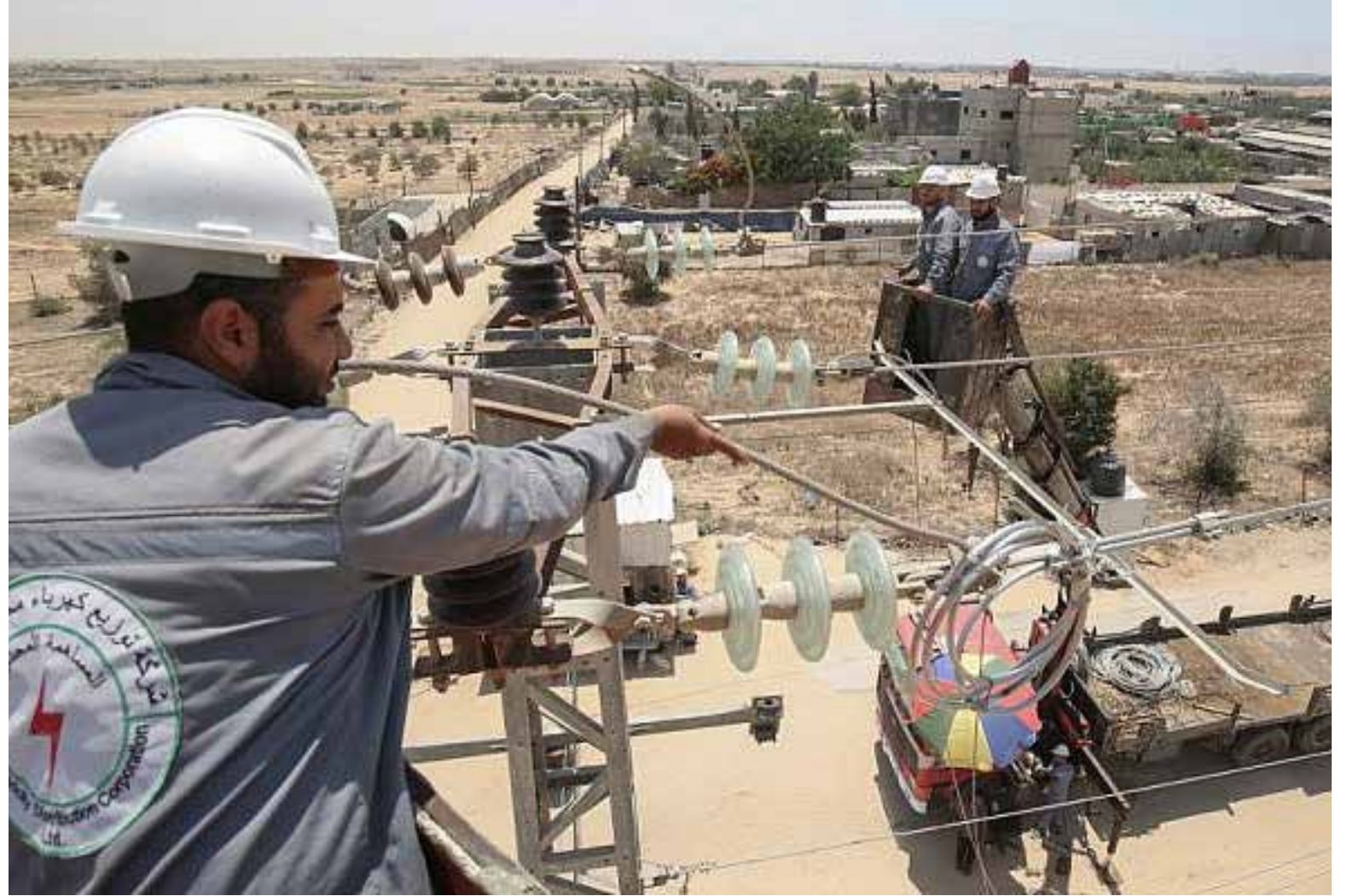
بغداد. طريق الشعب

تؤرق أزمة الكهرباء العراقيين في كل عام، وبرغم التحسن الذي شهدته ساعات التجهيز في موسم الشتاء الاخير، فقط اخذت تتراجع مؤخرا مع ارتفاع درجات الحرارة التي فاقت 40 مئوية، إذ أعلنت الوزارة خسارة نحو 1000 ميغاوات من الطاقة الكهربائية في المحطات الجنوبية، بسبب انحسار الغاز الإيراني المورد للبلاد.