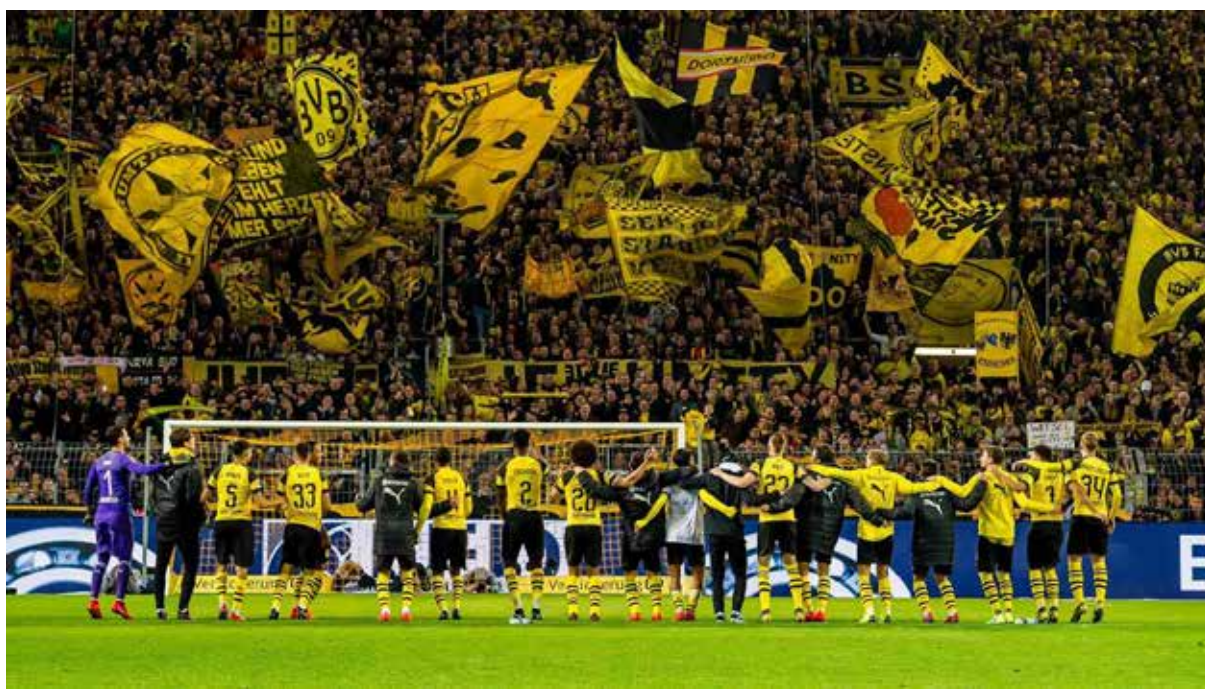
درس كروي.. جماهير نادي دورتموند تصفق لفريقها الكروي لمدة 15 دقيقة رغم خسارته الدوري الألماني على ملعبه

يختم اليوم الاحد منتخبنا الشباني مشاركته في بطولة كأس العالم للشباب من خلال لقاء متصدر المجموعة المنتخب الإنكليزي. وفشل منتخبنا بتحقيق نتائج ايجابية خلال البطولة بعد تلقيه خسارتين كبيرتين امام الاورغواي وتونس.