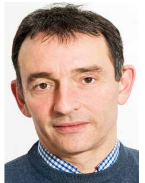
انريكي سانتياغو السكرتير العام للشيوعي الاسباني

رغم المخاوف والتباينات داخل معسكر اليسار، وداخل قواه منفردة بشأن المشاركة في حكومة يقودها الحزب الاشتراكي (ديمقراطي اجتماعي)، وعدم الاتفاق مع إجراءاتها المتدفقة بملف الهجرة، والموقف من قضية الصحراء الغربية، الا انه لا يوجد أحد داخل الحزب الشيوعي الاسباني يشعر بالندم إزاء المشاركة في الحكومة.