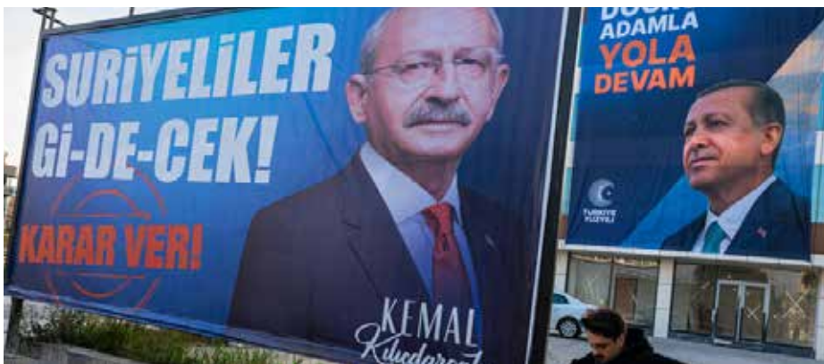
اللاجئون ورقة مساومة للفوز بالانتخابات

ويسعى مرشح المعارضة اللحاق بأردوغان، المدعوم من تحالف إسلامي - فاشي، والذي حصل على 49.5 في المائة في الجولة الأولى مقارنة بـ 45 في المائة لكليجدار أوغلو، وفي هذا السياق كسب أغلو دعم حزب فاشي منشق عن حلفاء أردوغان يحمل اسم "الظفر"، حصل في جولة الانتخابات الأولى 2 في المائة فقط، بعد أن قدم