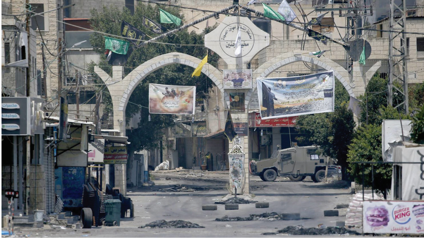
أثناء اقتحام قوات الاحتلال الإسرائيلي لجنين

وبغية تبرير هذه التوغلات الدموية، كانت سلطات الاحتلال تتدرب بأن مخيم جنين بات موقفاً لـ "إرهابيين" من حركتي "حماس" والجهاد الإسلامي بصورة خاصة، وأن عليها "أن تقضي عليهم قبل قيامهم بعمليات تستهدف الإسرائيليين". أما تصريحات المسؤولين السياسيين والعسكريين الإسرائيليين، التي صدرت بشأن العدوان الجديد على مخيم جنين، فقد كان أبرزها التصريحات التي صدرت عن رئيس الوزراء الإسرائيلي وعن مستشاره لـ "شؤون الأمن القومي" وعن ناطق بلسان الجيش الإسرائيلي، إذ أعلن بنيامين نتانياهو، صبيحة يوم الاثنين في الثالث من الشهر الجاري، أن وقته "دخول إلى عش الإهابيين في جنين، وهي تدمر مراكز القيادة وتستولي على كميات كبيرة من الأسلحة"، وصرّح، لدى زيارته قاعدة عسكرية في ضواحي جنين صباح اليوم التالي، أن إسرائيل "لن تسمح بأن تتحول جنين إلى ملاذ للإرهاب"، مضيفاً أن الجيش يستهدف "بنية تحتية إرهابية" و "مركز عمليات" تابعين لـ "كتيبة جنين"، ثم توقع في تصريح آخر على أعتاب بدء انسحاب قواته من المخيم مساء يوم الثلاثاء أن العملية التجارية "لن تكون الأخيرة، وإما ستكون بداية توغلات منظمة وسيطرة مستمرة على أرض المخيم". أما مستشاره تساحي هنغبي، فقد أعلن أن العملية "هدفت إلى منع مجموعات مسلحة مدعومة من إيران من أن تستخدم مخيم جنين موقفاً لتحصير هجمات وصنع صواريخ، وأن العملية ستحقق قريباً أهدافها". بينما قال المتحدث باسم الجيش الإسرائيلي، العميد دانيال هاغاري، صباح الاثنين: "عنا هذا