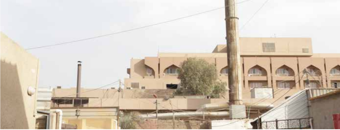
محارق النفايات الطبية الحكومية - داخل الاحياء السكنية في بغداد