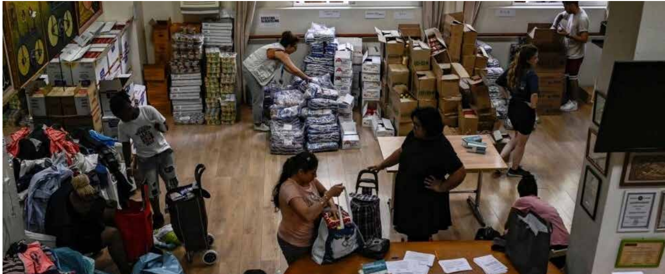
طالبو لجوء يتسلمون مساعدات من مواد غذائية وملابس تقدمها منظمة غير حكومية في أئينا، في 26 حزيران 2023

وتجمع العديد من الهولنديين خارج مكان انعقاد اجتماعات الائتلاف في الوسط التاريخي لأمستردام.