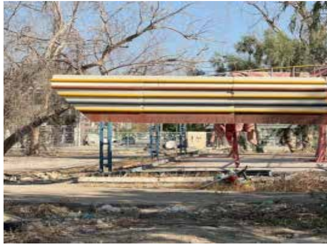
في حديث صحفي أن "الخلاف بين البلدية والمستأجر كان يتعلق بتحديد الجهة المسؤولة عن صيانة الألعاب وتأمين المتنزه"، مؤكداً أنه "سحبنا المنطقة".