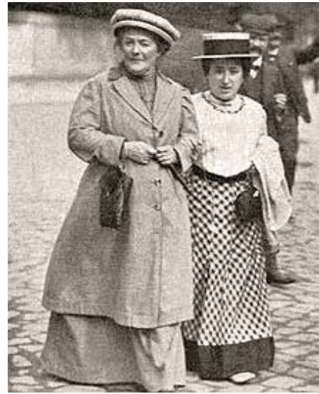
روزا وكلارا في الطريق الى مؤتمر الحزب 1910

والثاني أكثر تعقيدا: في صيف عام 1922، تطوعت كلارا زيتكين للمشاركة في محاكمة منافسي البلاشفة، الاشتراكيين الثوريين، والذين يطلق عليهم في الغالب ثوريون اجتماعيون للتقليل من شأنهم، كمدعية، كانت كلارا تعلم، بمطالبة لينين بإدراج عقوبة الإعدام في قانون العقوبات لغير المرغوب فيهم سياسياً، والذي تم في الأول من تموز 1922. ليس كلارا زيتكين وحدها فقط، بل كان اليسار الأوروبي كان دوماً ضد عقوبة الإعدام. البلاشفة، بين قوى اليسار، الذين تعرضوا للعنف الشديد في الحرب الأهلية، استخدموا فوهة البندقية للتعامل مع المعارضة. كان هناك رسالة من كلارا زيتكين مؤرخة في 29 تموز 1922، حاولت فيها أن توضح للبلاشفة أن سياساتهم تدمر في النهاية جاذبية الفكرة الاشتراكية. وكانت الترجمة الروسية متاحة في اليوم التالي فوراً، لم يتم تنفيذ عقوبة الإعدام بالمتهمين. بالإضافة إلى ذلك، تم التخلي عن خطط تصفية مثقفين معارضين. وبدلاً من ذلك، رحلوا مع عائلاتهم بدأ من نهاية آب على متن سفن إلى شتتين وتركيا. لقد كان شينا فظيحا أيضا، لكن لا مزيدا من الموت. في عام 1921، كان على كلارا زيتكين أن تختار بين مكانها في تاريخ العالم، وبعض التأثير الإيجابي على البلاشفة، فاخترت