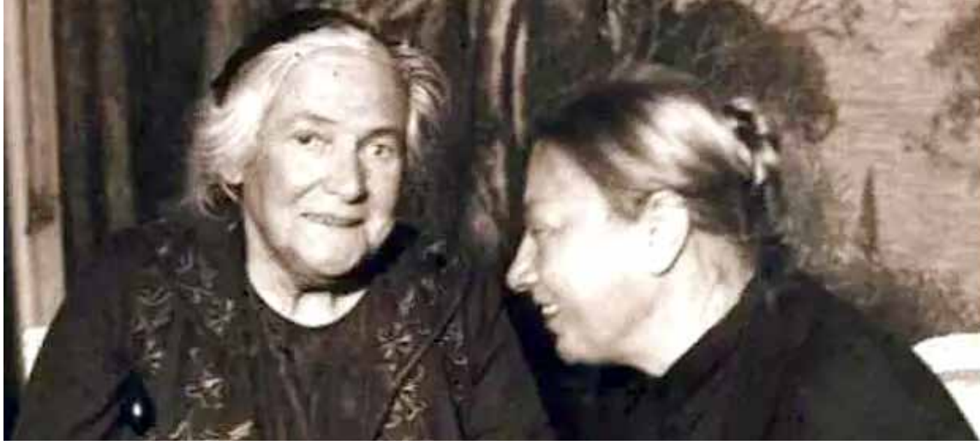
كلارا وكروسكا زوجة لينين

أفكار واقعية بشأن طبيعة الفاشية وسياستها، وقبل كل شي رؤية للنضال ضدها. صحيح أن مصطلح "الفاشية الاجتماعية" قد اختفى من الاستخدام النشط في قاموس الأمم المتحدة لبضع سنوات لأسباب تقنية، لقد كانت هناك بعض المحاولات الخجولة للتعاون مع الديمقراطية الاجتماعية في إطار "تكتيك الجبهة المتحدة"، جرى التركيز على إبرازها. ولكن مع اعتقاد المؤتمر العالمي السادس للأمم المتحدة الشيوعية في موسكو في صيف عام 1928، أصبحت معادلة "الفاشية القومية" و "الفاشية الاجتماعية" الأساس الرسمي للسياسة الشيوعية في جميع أنحاء العالم.