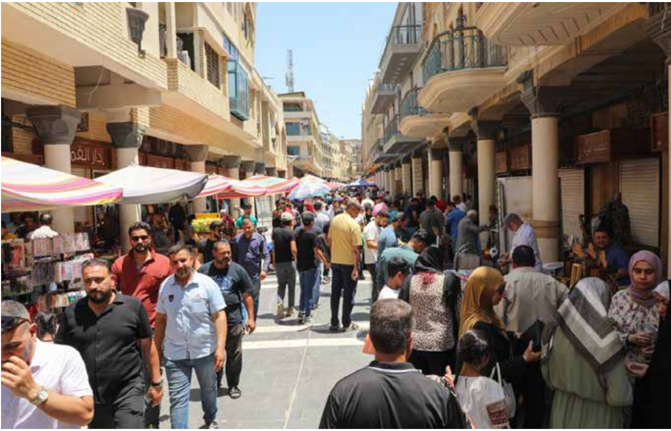
رغم ارتفاع درجات الحرارة... العراقيون لا يكونون عن عادة زيارة المتنبي كل يوم جمعة