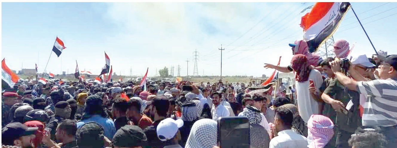
من احتجاجات المواطنين يوم أمس على تردي خدمة تجهيز الكهرباء في محافظة واسط

حولها ضبابية كبيرة فهي غير واضحة، اضافة لسوء التخطيط، فعلى سبيل المثال المحطات الكهربائية التي تم بناؤها وتعمل بالغاز، بنيت بمواصفات غاز معين مطابقة للغاز الايراني، ولا يتطابق مع الغاز الذي ينتجه العراق حتى».