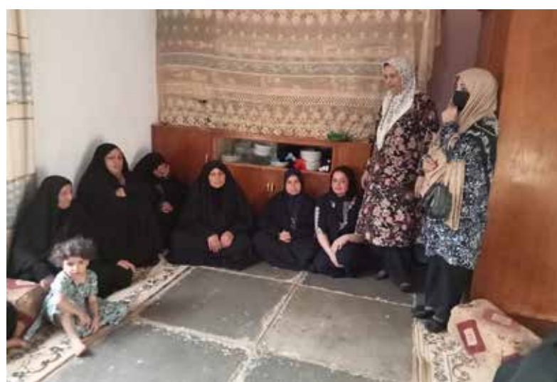
"وزارة الصحة والبيئة إلى ضرورة التوجه للنظر بالواقع البيئي والصحي في مناطق معامل تعاني الفقر الشديد".