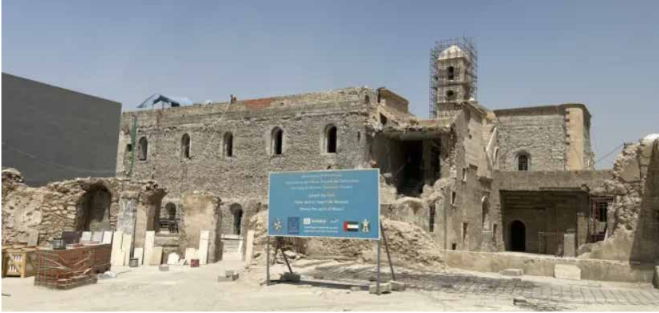
"كنيسة الساعة" وسط الموصل تشهد حالياً حملة إعمار بعد أن دمرها إرهاب داعش

وكان إرهاب داعش قد عمد إلى تدمير معالم المدينة التاريخية، ومن بينها كنائس قديمة. كما قام باستغلال بعض تلك المباني كمراكز ومقرات له، ما ألحق ضرراً بالغاً بنحو 30 كنيسة، لم يُرمم منها بعد التحرير سوى عدد قليل، وذلك بجهود ذاتية من قبل مسيحيين جمعو تبرعات من أجل هذا الغرض. وكانت المدينة القديمة في الموصل تمتاز بألوان بيوتها الزاهية، فهناك من يصبغها بالأزرق أو بلون الحناء. فيما كانت أزقة المدينة عامرة بالسكان، لكن بعد دخول إرهاب داعش تحول جزء كبير منها إلى دمار وحطام، ذلك الجانب الذي كان يتمتع بالتنوع الديني.