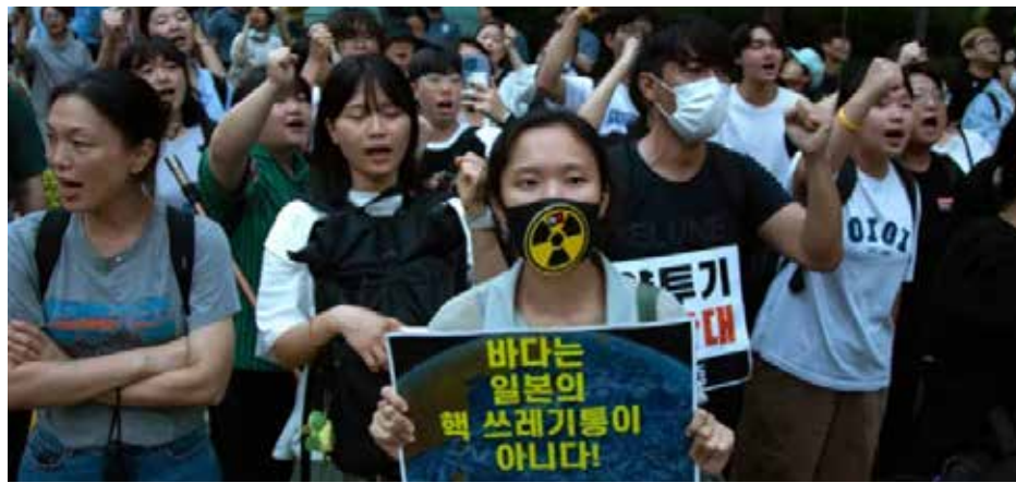
متظاهرون في سول ينددون بخطة اليابان لتصريف المياه المعالجة من محطة فوكوشيما

أعلنت شركة طوكيو للطاقة الكهربائية -المشغلة لمحطة فوكوشيما النووية-، أن التحضيرات الأخيرة لتصريف المياه المعالجة من المحطة بدأت، أمس الأربعاء. وقالت الشركة، في بيان "إنها خففت متراً مربعاً من مياه الصرف بنحو 1200 متر مكعب من مياه البحر، وسمحت للمياه المخففة بالتدفق إلى داخل أنبوب". وأضافت، أن "المياه ستخضع لتدابيل وسيتم تصريفها