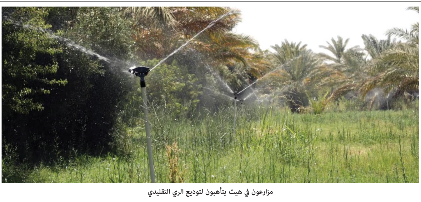
مزارعون في هيت يتأهبون لتوديع الري التقليدي

ويضيف، أن "هناك توجيهات من قبل رئيس الوزراء ووزير التخطيط بضرورة إنجاز المشاريع المتلكئة في مدة أقصاها العام القادم، وعلى اقل تقدير إنجازها بنسبة 90 في المائة". ويبين الهنداوي، انه "في ما يتعلق بمشاريع المستشفيات المتلكئة، فقد تم وضع حلول لما يقارب ٥١ مستشفى: ١٤ مستشفى منها بسعة سريرية تتجاوز ٤٠٠ وأخرى بسعات مختلفة، وتنتشر في غالبية المحافظات"، مؤكداً انها ستعز خلال العام الجاري او المقبل.