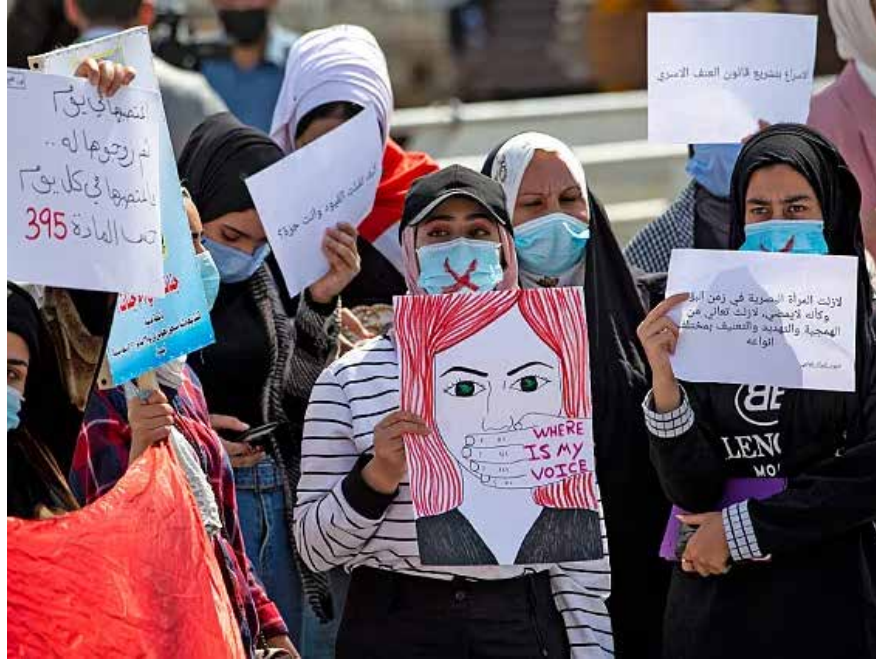
تظاهرة نسوية ضد العنف الأسري في البصرة

وأخيراً، شهدت منطقة النهروان شرقي بغداد، حادث عنف أسري خطيراً، انتهى بإطلاق رجل النار