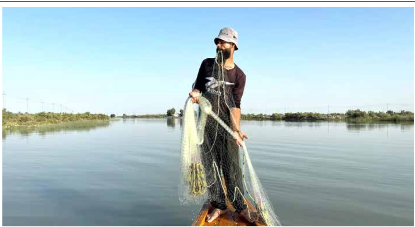
صيادون في هور المسحب بالبصرة: شباكنا بدأت تصطاد السمتي بدل الاسماك الدخيلة

وتلفت المتحدثات إلى أن الفشل والاهمال في أداء المهام التشريعية والنيابية على مدى السنوات الماضية وحتى الآن «أنتج ظواهر مشوهة كثيرة،