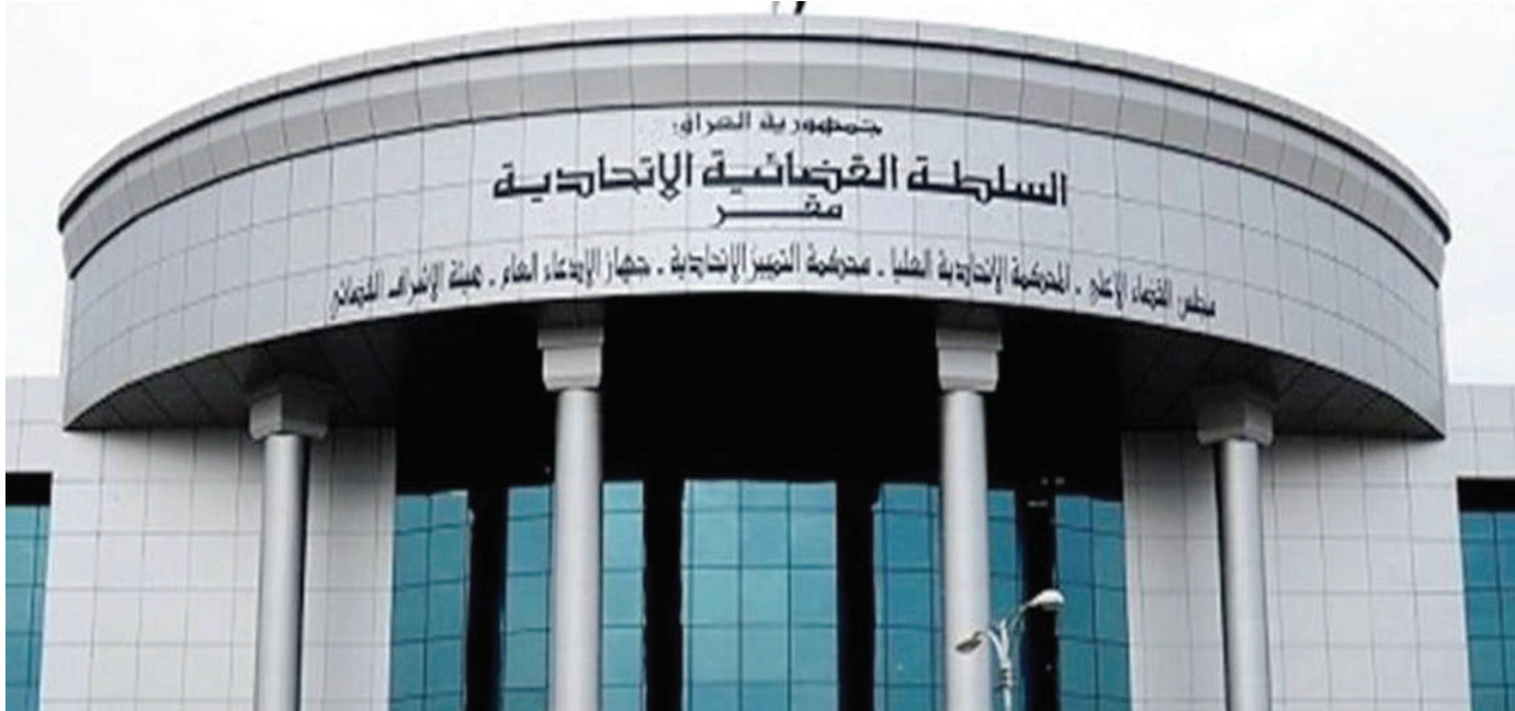
بغداد. طريق الشعب

ورغم تعدد الرؤى، فإننا اتفقنا على أن تمكّن المرأة من حقوقها يتعارض قطعًا مع أية نظرة ترى فيها إنسانًا قاصرًا وتحاول تقنين ذلك بقوانين، أو تزيد من التفاوت الاقتصادي بين النساء والرجال، أو تقلص من مشاركتهن السياسية ومن فرص تعلمهن، أو تفرض على حريتهن، المكفولة دستوريًا، شتى أنواع القيود. وفيما تجنبنا مشاريع وبرامج متطرفة، لا تمت للواقع ومستوى التطور بصله، دعونا لتقييم العمل المنزلي والإنجابي اجتماعيًا، عبر القضاء على كل أشكال العنف الأسري، ومنح أجازات مدفوعة الأجر للنساء، أثناء الحمل والولادة والرضاعة، وتقليص ساعات عمل الزوجات، وضمان مساواة المرأة مع الرجل في فرص العمل والتعليم والأجور، وتنفيذ مشروع ثقافي يخلق نموذجًا لفرد ذي تفكير ديمقراطي. كما أدركنا بأن ثقافة الهيمنة الذكورية السائدة في المجتمع الطبقي، قد تتسلل لصفوفنا بشكل ما، فعمدنا إلى معالجتها بشكل دوري، دون أن نضع أسوارًا صينية بين أهدافنا المختلفة، فاعلمنا للخلاص من اضطهاد النساء مرتبط بالنضال ضد باقي أشكال الظلم والاستغلال والعنصرية واستعباد الشعوب ونهب ثروتها وتخريب البيئة والسلام. وبهذا كانت ثقتنا ببرامجنا وفكرنا مبررة، ولهذا أيضاً تهافتت إعاءات الخصوم.