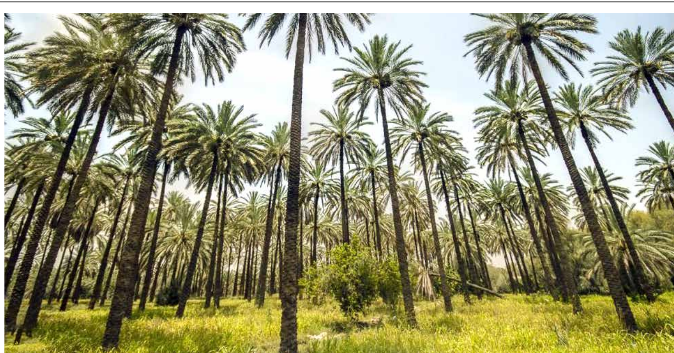
وسط درجات حرارة قياسية ينطلق موسم جني التمور في العراق