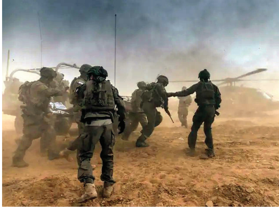
وحدة إسرائيلية متخصصة في الإنقاذ ترافق جندياً أصيب في المعارك لنقله على متن مروحية خارج قطاع غزة

قال وزير المالية الإسرائيلي المتشدد بتسلئيل سموتريتش،