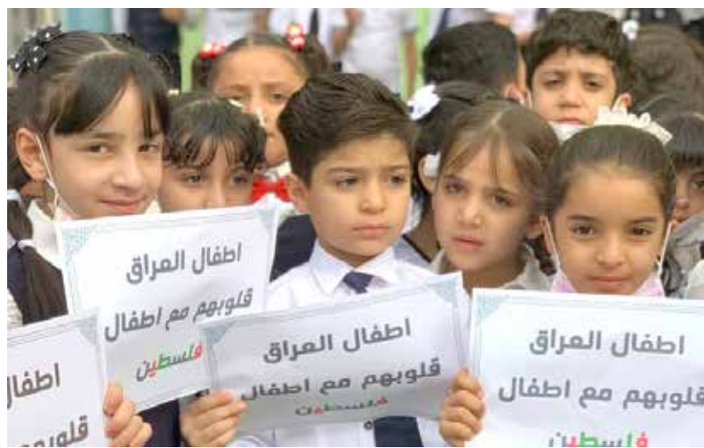
تلاميذ عراقيون صغار يتضامنون مع أقرانهم في فلسطين

أما وزارة التربية، فقد أعلنت عن مدارس ستبنى في بغداد وديالى والنجف وتحمل اسم «طوفان الأقصى»، ترسيخاً للقضية الفلسطينية في وجدان الأجيال. وفي حديث صحفي، تقول