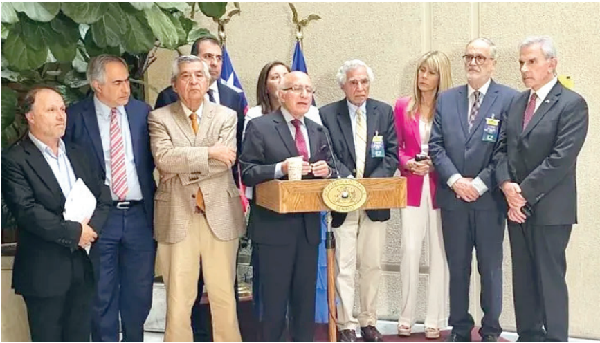
١٠٠ محام من تشيلي يقاضون إسرائيل أمام المحكمة الجنائية الدولية

محكمة ضد إسرائيل رفعتها جنوب أفريقيا في 29 كانون الأول بتهمة الإبادة الجماعية ضد السكان الفلسطينيين. ومن وجهة نظر جنوب أفريقيا، يتعين على قضاة الأمم المتحدة أولاً أن يأمرؤا بالوقف الفوري لهجمات ووضع حد للعنف ضد الفلسطينيين في إجراء عاجل. لقد أصدرت وزارة الخارجية الإسرائيلية تعليمات لسفاراتها «بحث الدبلوماسيين والسياسيين في البلدان المضيفة على إصدار بيانات ضد الدعوى القضائية التي رفعتها جنوب أفريقيا قبل بدء جلسات الاستماع الخميس المقبل». والهدف الاستراتيجي لإسرائيل هو أن ترفض المحكمة الدعوة، وتقر أن إسرائيل لا ترتكب إبادة جماعية في غزة، وتثبت أن الجيش الإسرائيلي يعمل في قطاع غزة وفقاً للقانون الدولي.