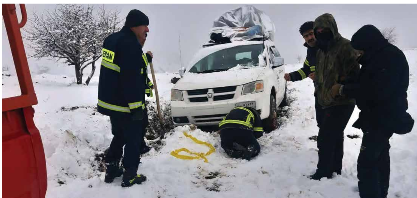
تزايد هطول الثلوج في أربيل.. فرق الدفاع المدني تنقذ ٤ سياح علقوا وسط ثلوج قضاء جومان

التخادم المحاصصاتي يتحكم بتشكيل الحكومات المحلية.. صراع كتل «الاطار» يطفو على السطح « 4