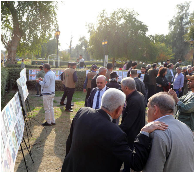
في معرض صور ضحايا الانقلاب ضمن حفل الاستذكار