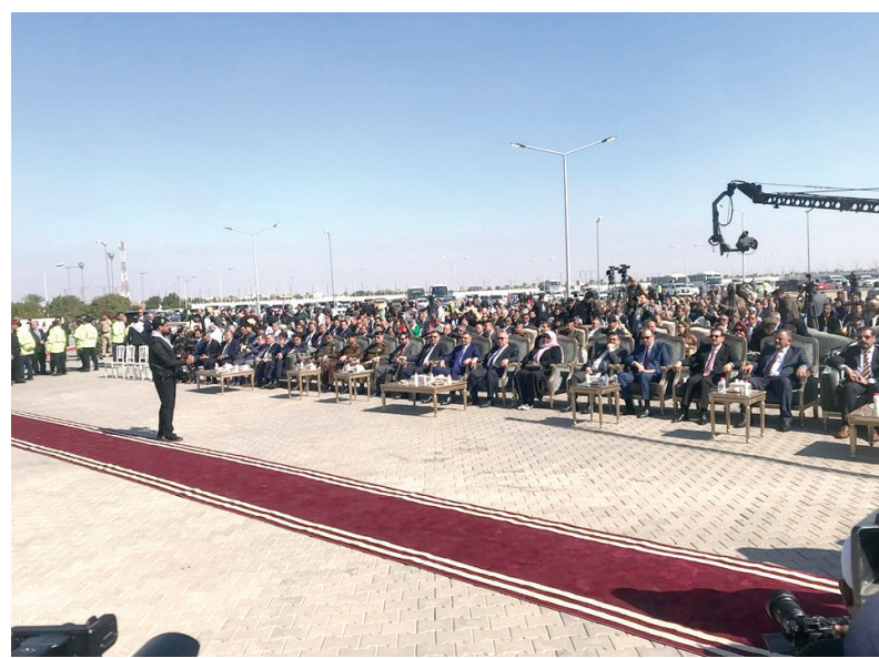
من حفل الافتتاح

وأضاف قائلاً: «آن لتعب الأيام أن يُغسل بهذا الألق.. وصار لزاماً أن نفكر بالمدن العراقية عواصم دائمة للثقافة وعلى رأسها البصرة». وشهد المهرجان، طيلة أيامه الأربعة، جلسات شعرية ونقدية صباحية ومسائية، احتضنتها قاعة «فندق غراند ميلينيوم». فيما أُخّص جناح لعرض باقة مميزة من منشورات الاتحاد، بلغت أكثر من 74 عنواناً توزعت بين الشعر والرواية والقصة والنقد والفكر. وتزامناً مع هذه الدورة من المهرجان، أطلق الاتحاد سلسلة مطبوعات ضمن منشوراته، أطلق عليها «ماس القصائد»، وتتضمن طباعة مختارات شعرية لشعراء مبدعين. وقد طبع الاتحاد بداية مجموعة لأربعة شعراء، هم: الراحل مظفر النواب، أحمد مطر، كاظم