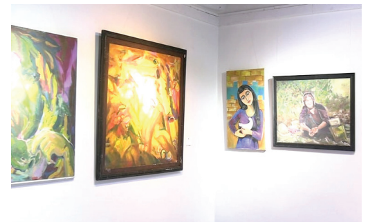
من أعمال المعرض