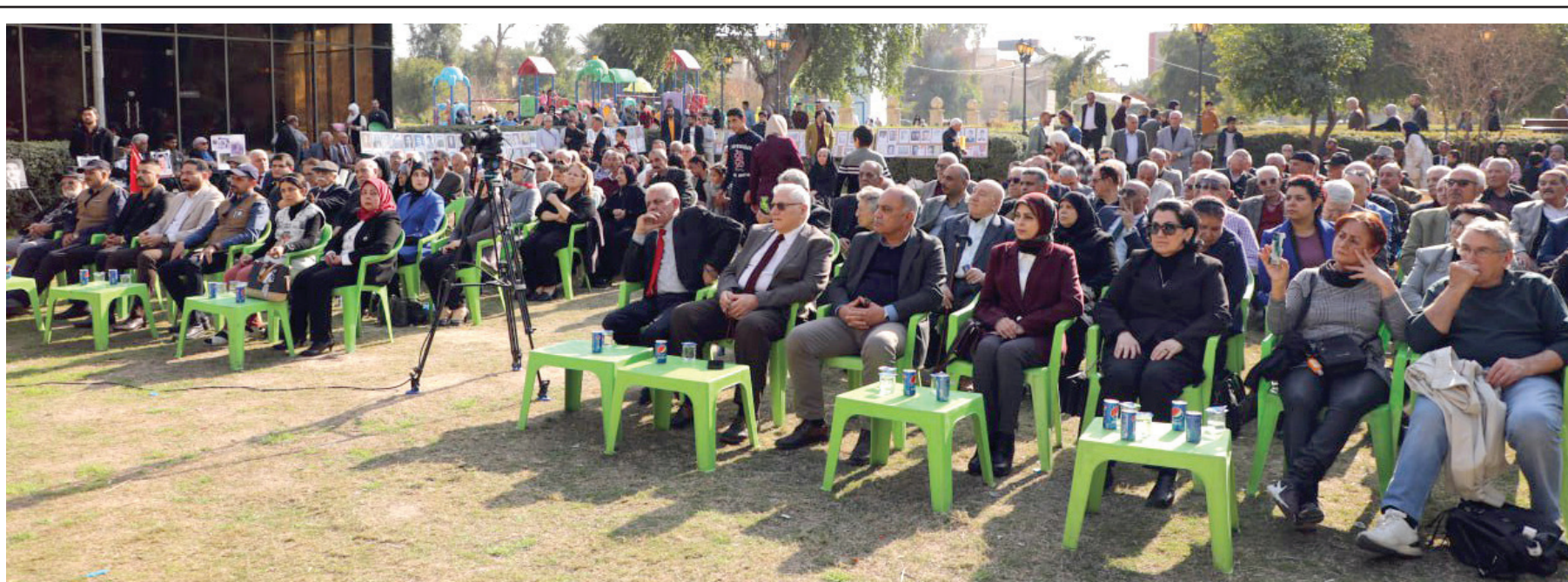
استذكار الكاظمة لضحايا انقلاب 8 شباط الاسود واحتفاء بمآثر المقاومين الابطال