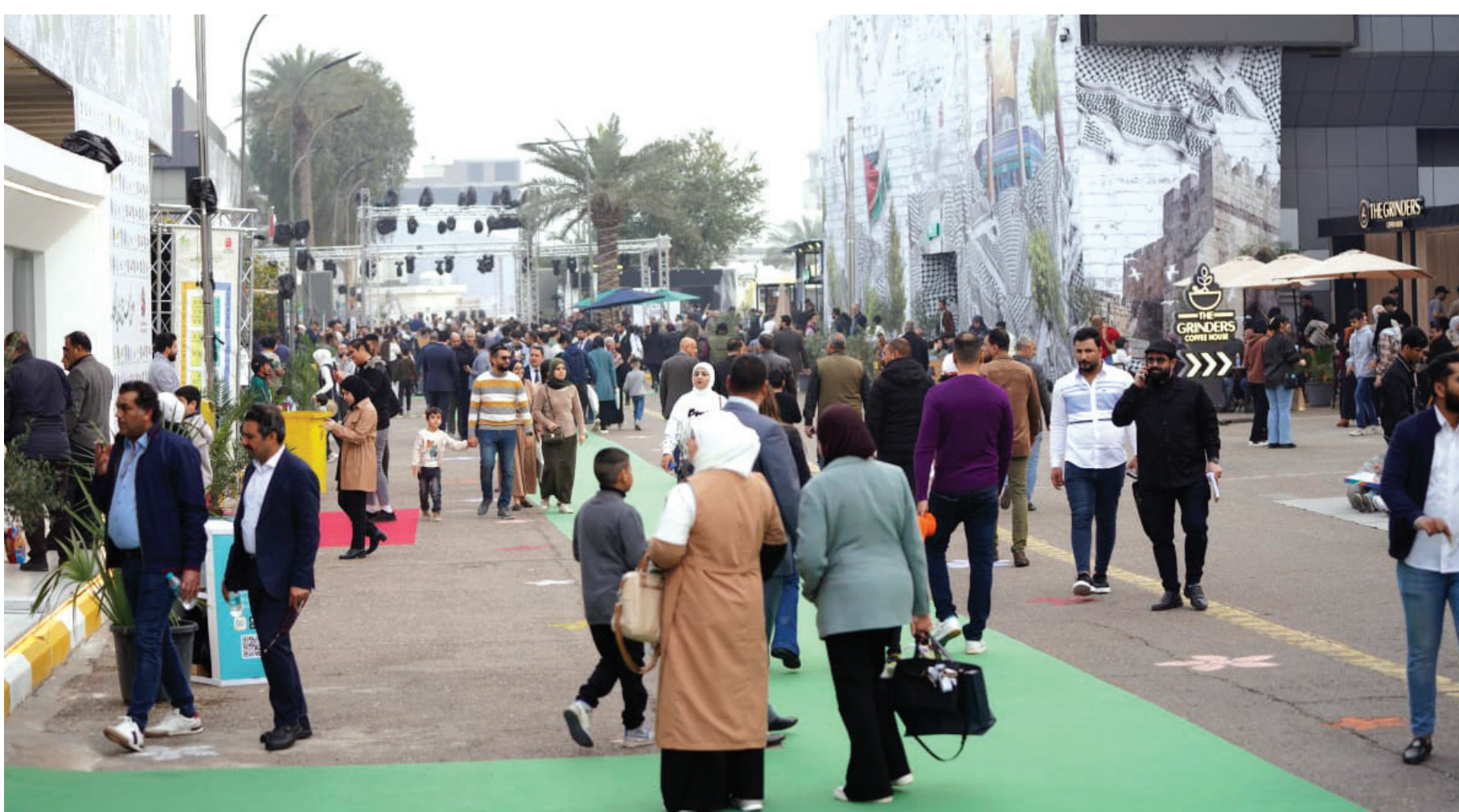
فعاليات متنوعة وحضور حاشد في معرض العراق الدولي للكتاب المقام على ارض معرض بغداد الدولي

وفي ما يخص اعداد الأسلحة خارج اطار سيطرة الدولة قال الموسوي: «الاعداد كبيرة جداً وما زالت مجهولة. نحن ماضون تجاه الاحصاء لكشف هذه الاعداد او تقديرها او تخمينها في ما بعد. ونأمل ان نسيطر عليها بشكل كبير»، مشيراً إلى ان وزارته «تسعى إلى جمع كافة الأسلحة من المواطنين سواء كانت خفيفة ام متوسطة ام ثقيلة. والغاية هي تقليل العنف