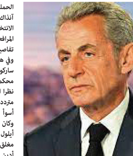
ساركوزي ادين بملفات فساد

وليس من المستبعد ان يواجه ساركوزي تهمة التمويل غير الشرعي لحملته الانتخابية الاولى في عام ٢٠٠٧، والتي قبل ان الرئيس الليبي الراحل معمر القذافي قد ساهم في دعمها بمبلغ ٥٠ مليون يورو. وهناك في فرنسا شائعة متداولة مفادها أن الرغبة في إخفاء هذه الحقيقة كانت أحد أسباب سعادة ساركوزي بالغايات الجوية الغربية عام ٢٠١١، التي ساعدت في الإطاحة بالقذافي.