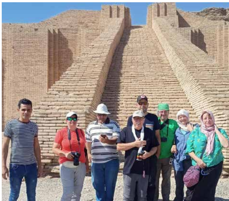
أمام سلم الزقورة في أور الأثرية

ويختتم نوري بالتأكيد على أن «الاهتمام بالسياحة