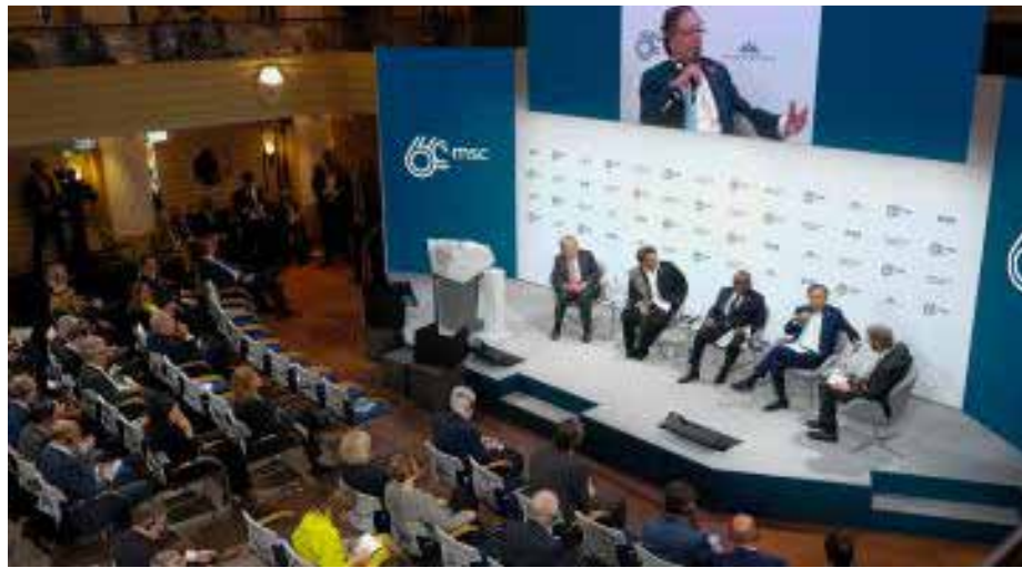
الرئيس الكولومبي في مؤتمر ميونخ: الصالح العام وليس السوق