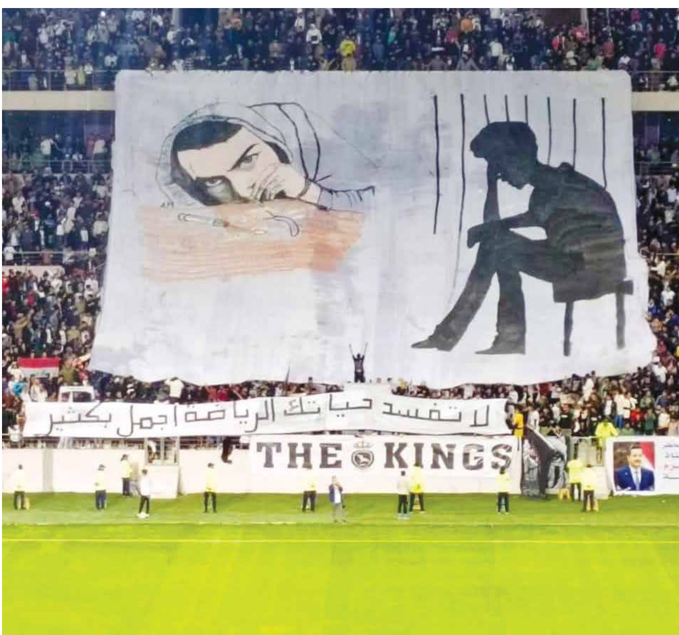
«تيفو» جماهير الزوراء خلال مباراة الكلاسيكو ضد القوة الجوية: «لا تفسد حياتك، الرياضة اجمل بكثير»، في إشارة الى خطر تعاطي المخدرات