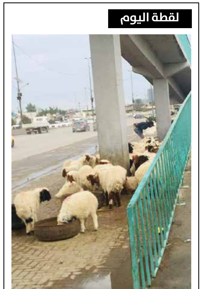
"جوبة" لبيع الأغنام في قلب بغداد على سريع البتايح مقابل عمارات حي السلام