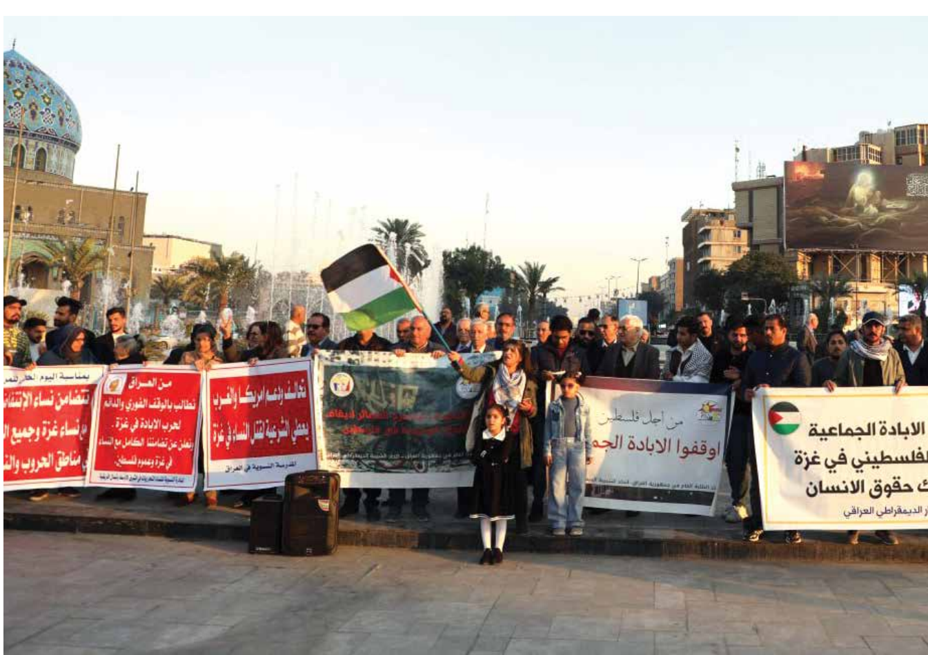
الوقفة التضامنية التي دعا إليها اتحاد الطلبة العام واتحاد الشبيبة الديمقراطي للتضامن مع الشعب الفلسطيني وادانة العدوان الصهيوني

واردف بالقول: ان «أحدى صور الخلل في إدارة الضريبة، هي سرقة القرن على سبيل المثال، نتيجة