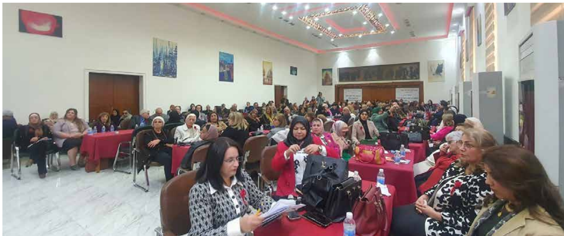
من حفل افتتاح المؤتمر الحادي عشر لرابطة المرأة العراقية الذي اختتم اعماله امس الاول الجمعة

ونرى انها، أيضاً، فرصة لان تبادر القوى المدنية والديمقراطية، قوى التغيير الى التحرك وبلورة رؤاها والمساهمة الفاعلة في النقاش والحوار الذي دشّن، وأن تقول بوضوح ماذا تريد، وان تحشد وتضغط وتعود الى الرأي العام ليقول كلمته ويضغط على المنتفضين واجبارهم على تنفيذ إرادة الأغلبية، وبما يحفزها على المساهمة والمشاركة الفاعلة في الانتخابات لتغيير موازين القوى لصالح المشروع التغيير الشامل.