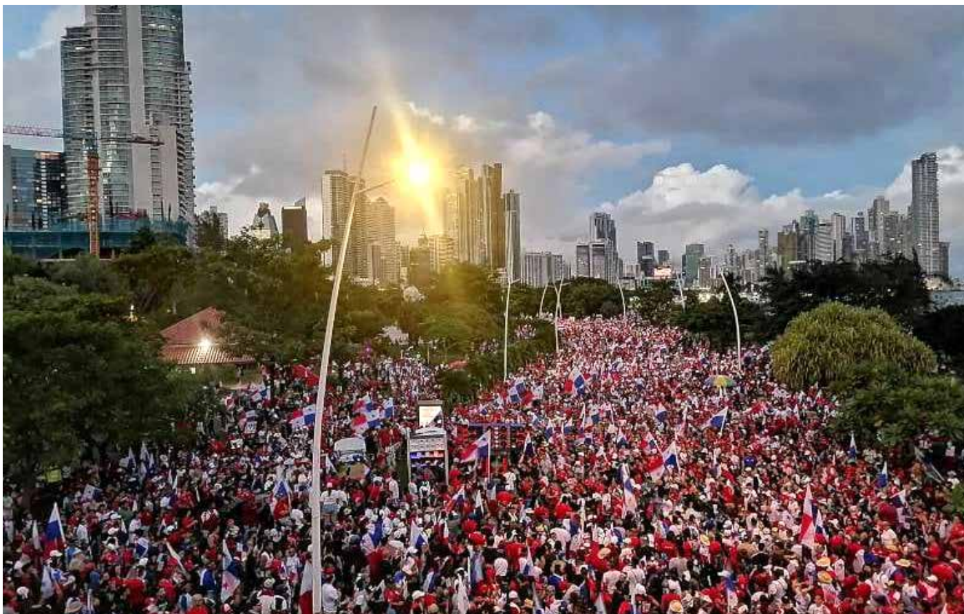
من احتجاجات البنمين ضد القانون

رأت أوساط من السكان والعديد المنظمات أن شل الحياة اليومية في البلاد هو الوسيلة الوحيدة لممارسة الضغط على حكومة لا تستمع لشعبها. وتمكنت منظمات مثل نقابة عمال البناء، جمعية المعلمين، حركات الفلاحين والسكان الأصليين والطلابية التي اجتمعت معًا في التحالف الشعبي المنتمت من أجل الحياة، وتجمعات شبابية في وسائل التواصل الاجتماعي، من حشد أكبر انتفاضة في السنوات الأخيرة. ووقعت خلال التظاهرات مواجهات بين المتظاهرين وكاسري الاحتجاجات، أسفرت عن مقتل أربعة متظاهرين. وقد تصور عينه برصاصة أطلقتها الشرطة. وبحسب صحيفة لا بريسا اليومية، تم اعتقال أكثر من 1,061 شخصًا خلال التظاهرات، وفتحت قضايا جنائية ضد 170 منهم بتهمة التخريب.