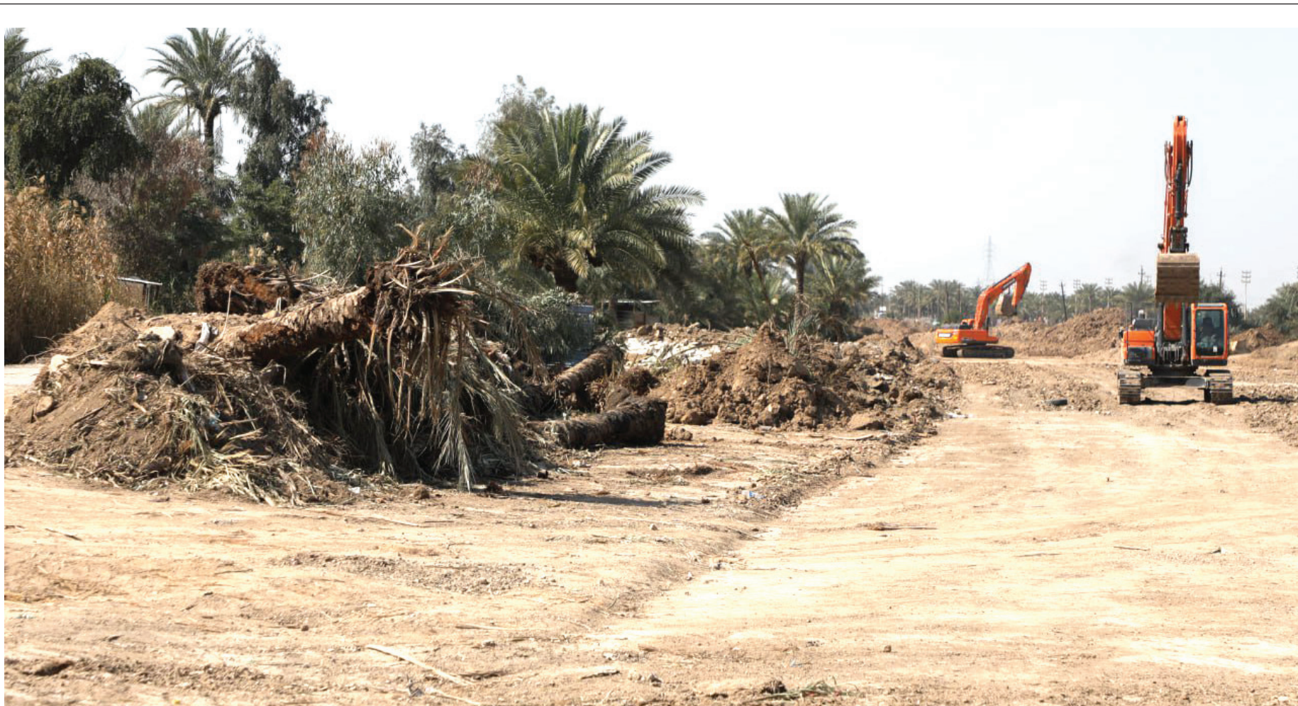
نخيل بغداد (منطقة البوعينة) ضحية عمليات التجريف