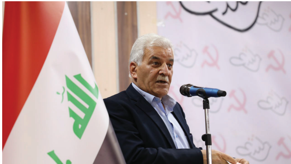
الدكتور باقر الكرباسي

سلام عادل لم يكن موجوداً بيننا لكننا لن ننساه ولن ننسى كل ما ارتبط بحياته وسيرته من جميل، وما تركه لنا من سيرته ونضاله كثير وراسخ في وجدان كل منا وراسخ في وجدان شعبه العراقي، وللجواهر الكبري قصيدة نظمه بعد الانقلاب الدموي سنة 1963 استذكارة وتخليداً للشهيد سلام عادل ورفاقه من شهداء العراق: