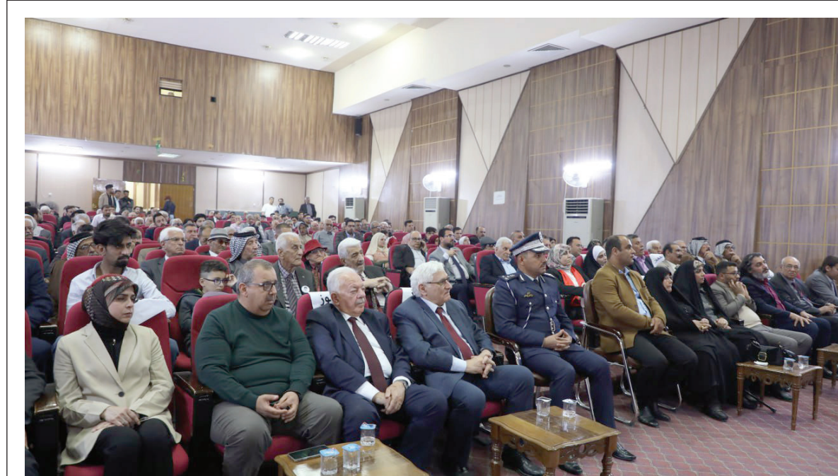
مهرجان احياء ذكرى استشهاد الرفيق سلام عادل الخامس أمس الاول الجمعة في النجف

ويسعى منظمو الماراثون - حسب ما ذكروه في حديث صحفي - إلى أن تكون النسخة المقبلة من هذا النشاط دولية، مؤكداً انهم سيدعون رياضيين من مختلف بقاع العالم.