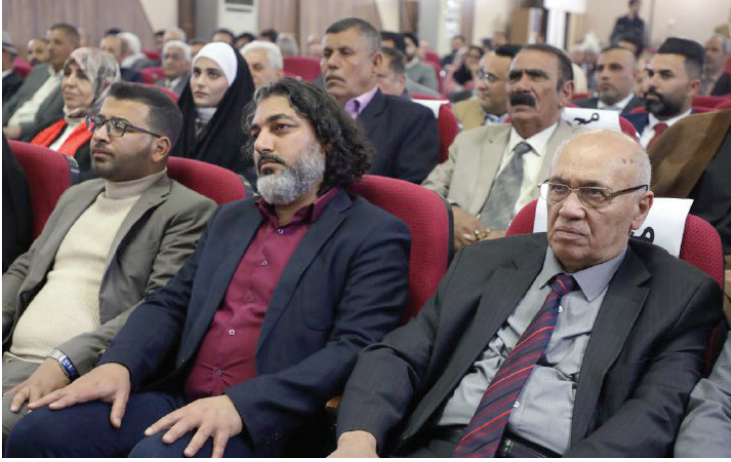
جانب من حضور قيادة الحزب في المهرجان