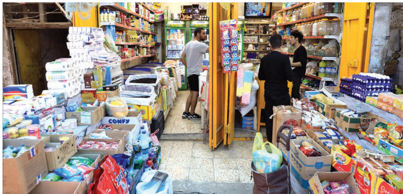
العراقيون يستقبلون شهر رمضان وسط ارتفاع بالغ للاسعار

وقدر الصندوق نمو الناتج المحلي الإجمالي الحقيقي غير النفطي للعراق بـ 6% في 2023 بعد انحساره في 2022، فيما انخفض معدل التضخم الرئيس من