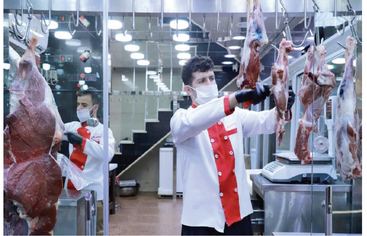
بغداد. طريق الشعب

يستقبل العراقيون كل عام شهر رمضان وسط ارتفاع ملحوظ في أسعار اللحوم والمواد الغذائية والخضراوات، الأمر الذي يلقي بظلاله على الأحوال المعيشية في بلد يقف 10 ملايين مواطن من أبنائه تحت خط الفقر، برغم امتلاكه ثروات طبيعية لا يملكها بلد آخر.